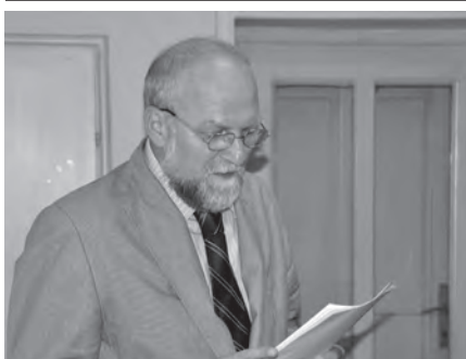
Skupščina je verifcirala sprejem novih članov Društva z zaključno zoporedno