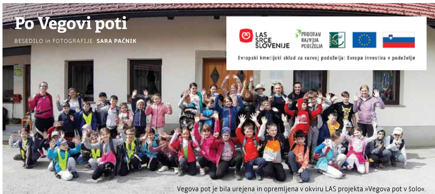
Vegova pot je bila urejena in opremljena v okviru LAS projekta »Vegova pot v šolo«.

V četrtek, 23. marca 2023, smo obeležili občinski praznik, in sicer rojstvo znanega matematika, plemiča, meteorologa in topniškega častnika Jurija Vege. Ob prazniku smo se učenci in učitelji Podružnične osnovne šole Vrhpolje odpravili po Vegovi spominski poti – poti, po kateri se je Jurij Vega kot otrok vračal domov v Zagorico od verouka in nedeljske šole v Moravčah.