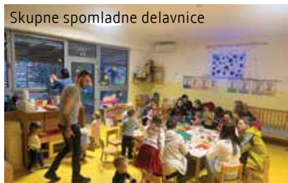
Skupne spomladne delavnice

Pomladne delavnice so potekale v času od 13. do 23. marca 2023 v vseh skupinah prvega in drugega starostnega obdobja. Skupaj smo okrasili našo igralnico s pisanimi pomladnimi rožami.