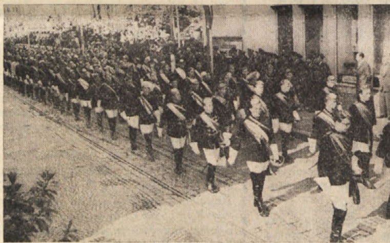
Samo zahteve po ugotavljanju manjšine so pričale, da Koroška ni popolnoma nemška. —