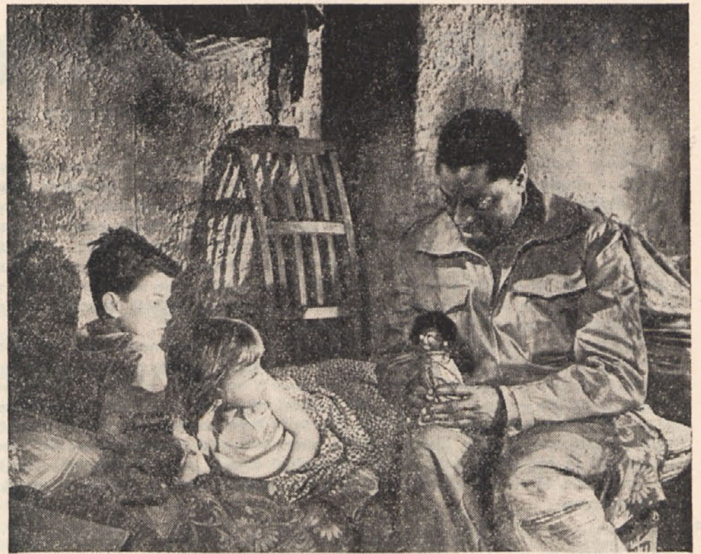
Prizor iz filma »Dolina miru«

Igra »Kekec« je na razpolago v knjižnici Slovenske prosvetne zveze.