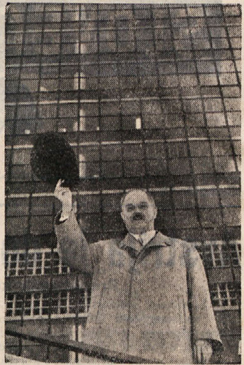
Kakor smo že svojčas poročali, je zvezni kancler ing. Raab med svojim bivanjem v Ameriki (v času od 21. novembra do 9. decembra t. l.) obiskal tudi sedež Organizacije združenih narodov. Naša slika ga kaže pred poslopjem sekretariata OZN v New Yorku.

šilingov retnikom in upokojemcem. Kljub tem ogromnim vsotam, ki jih mora kot davčno breme v pretežni večini nositi delovno ljudstvo, so posamezne rente v nešteti primerih še tako nizke, da ne krijejo niti eksistenčnega minimuma. Stalno pa so napredne socialistične sile na delu, da mostrujejo tudi ta težavni finančni problem ter iščejo poti in načine, da bo uspelo stare ljudi tako preskrbeti, kakor se za kulturno državo spodobi.