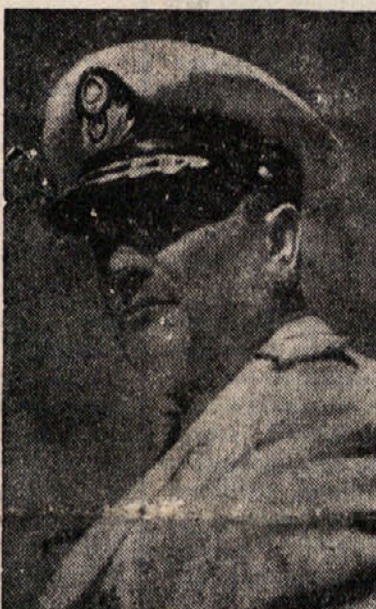
Predsednik FLRJ maršal Josip Broz-Tito

Ves svetovni tisk zla- stí pa jugoslovanski in indijski posveča veliko pozornosti šestim se- stankom med predsedni- kom indijske vlade Ne- hrujem in predsedni- kom FLRJ maršalom Titom, o katerih je bila minuli teden izdana skupna deklaracija, ki jo označujejo kot v zad- njem času najvažnejši prispevek k utrditvi mi- roljubnih sil v vsem svetu in jo celo imenu- jejo »Ustanovno listino miru«.