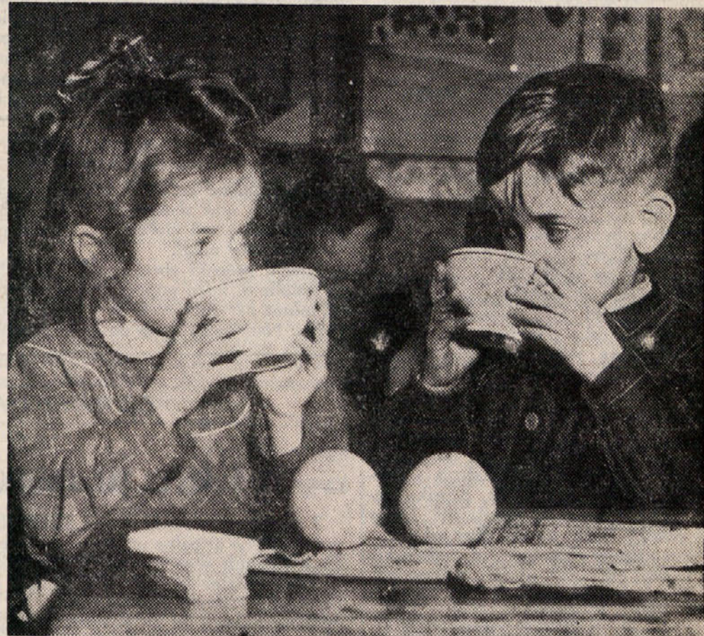
O francoskem ministrskem predsedniku Mendes-Franceu je znano, da posebno rad pije mleko in da poskuša to svojo dobro navado v okviru svoje borbe proti prekomernemu uživanju alkoholnih pijač prenesti tudi na francosko ljudstvo. Prva dva pomembna ukrepa v tem pravcu sta že storjena: vsak šolski otrok v Franciji dobi brezplačno po 1/8 litra mleka dnevno v odmoru med poukom in od 1. januarja naprej bo tudi v francoski vojski mleko sestavni del dnevnega obroka hrane namesto vina, ki so ga francoski vojaki doslej dobivali s hrano vred. (AND)

Upamo tudi v novem letu na plodonosno, dobro in zaupno medsebojno sodelovanje!