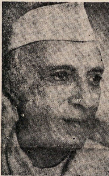
Predsednik indijske vlade Džavaharlal Nehru