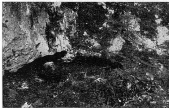
Slika 5. Izvir vode nad Miklarji, imenovan »Škrlinec«, kjer so dobivali vodo prvi belokranjski partizani, dokler so se zadrževali v prvem taborišču

Poleg teh in podobnih zapisanih ukazov pa je Robotti preko svojih podrejenih divizijskih, polkovnih in bataljonskih poveljnikov dal vojakom še strogo zaupna ustna naročila in ukaze za njih ravnanje in vedenje v okupirani Sloveniji, ki so zapovedovala takojšnjo uporabo orožja, če se le kakemu vojaku zazdi, da mu hoče kak Slovenec kaj hudega storiti. Še več, obljubljal je za nagrado enomesečni dopust za vsakega, ki bi s tako utemeljitvijo ubil civilno osebo. Vojakom je bilo zapovedano, da smejo izven vojašnic hoditi le najmanj v troje s puškami v rokah in s prstom na petelinu. Da je bila