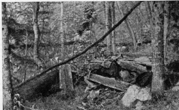
Slika 1. Prostor in sled kuhinje prvih belokranjskih partizanov leta 1941 v drugem taborišču pri Kozlovi vodi

Med vsemi temi poročili so nekatere manjše razlike, ki zadevajo čas napada ali imena napadalcev, ki so razumljivo nastale zato, ker so bila vsa — razen tistega v SP iz leta 1941 — zapisana 3 do 10 let po izvršenem napadu. Časovno najbližje je poročilo v Slovenskem poročevalcu, ki pa zmotno navaja čas, pri tipkanju pa so bila pokvarjena tudi nekatera imena italijanskih vojakov, kar je posebej jasno pri imenu Cari, kjer je iz imena Dismo nastalo Disuno, kar je brez smisla. Komentar ponatisa Slovenskega poročevalca te napake ni popravil.