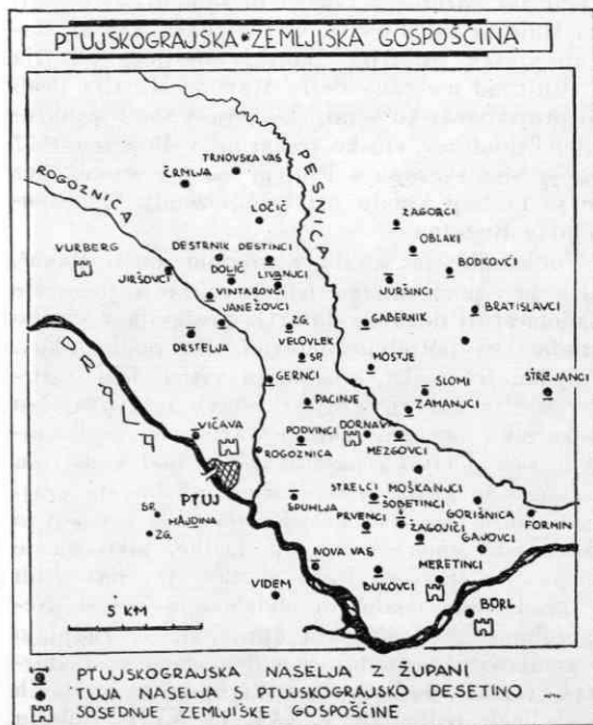
Skica ptujskograjske zemljiške gosposčine

Srednjeveški grad v Ptuj je bil sedež upravitelja 2 salzburške zemljiške posesti, ki je segala od Hajdine do Središča. Z upravno razdelitvijo