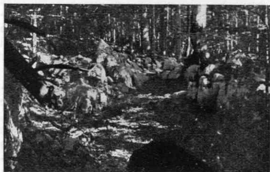
Slika 2. Na tem prostoru med skalami je stal šotor prvih belokranjskih partizanov v avgustu in septembru 1941

Napad je v svojem glavnem namenu, zadetih živo silo okupatorske vojske, uspel. Iz-