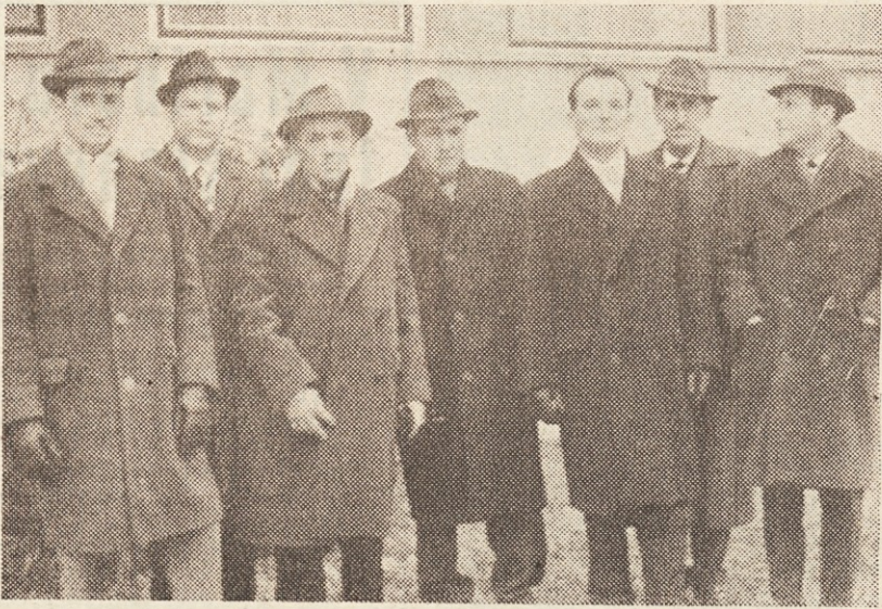
Zidarji in tesarji pred odhodom v Nemčijo