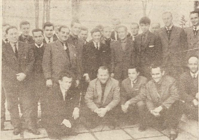
Zelimo, da bi bili vsi naši upravljalci sposobni in zavestni graditelji naše socialistične domovine. Udeleženci prvega dela seminarja za člane delavskih svetov PE