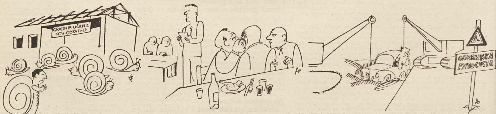
IZ LJUBLJANE — »Fantje, nikar preveč hitro. Pazite na svoje zdravje!«

Nekatere poslovne enote stoji bolje od drugih. Čeprav je to težko zahtevati, vendar