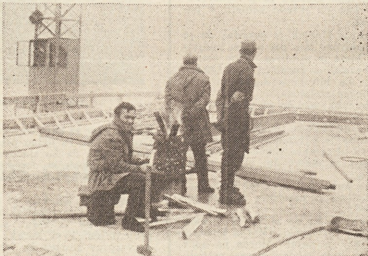
Tudi takole se prileže

Odgovor: Tudi na to vprašanje mi ne bo težko odgovoriti, saj je nanj dal odgovor kar nemški partner, ko je povabil predstavnike našega podjetja v Frankfurt in jim predložil sklenitev pogodbe za angažiranje za naslednjih 200 novih delavcev. To pa pomeni, da bomo v letu 1965 najmanj podvojili sedanjo posadko in to takoj po novem letu. Tudi to je za nas veliko priznanje, saj smo v deželi zagrizenega konkurenčnega boja, kjer odločajo tudi desetine ali stotine DM, da se delo dobi. Seveda