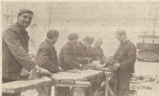
Tudi nas ne bo pregнал mraz, so dejali železokrivci na ljubljanski toplarni

Ker se v tem času pripravljamo na letne konference osnovnih organizacij ZK, kamor tudi na občne zbornice sindikalnih podružnic, bo dovolj priložnosti, da bomo članom našega kolektiva pojasnjevali in tolmačili ukrepe, ki bodo sprejeti za izboljšanje pred-