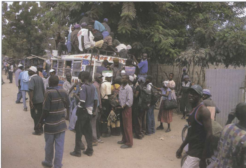
Slika 7: Prometna infrastruktura je zelo slabo razvita. Železnic ni, ceste so večinoma slabe, vozila pa zastarela; velika gneča na njihovih strehah je povsem običajen pojav.

okolici razlaga vzroke bolezni ali nesreče. Pri skoraj vsakem obredju žrtvujejo živali, največkrat piščance ali koze. Loa so namreč utrjeni in žrtvovana živalska življenja jih razveselijo in pomladijo.