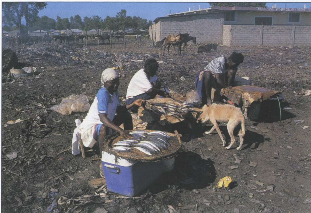
Slika 2: Prodaja živil sredi kupov odpadkov je eden od najbolj šokantnih pokazateljev pomanjkanja najosnovnejše higiene in odraz velike zaostalosti.

vek iz njegove stranke, ki je bil leto pozneje zaradi novega vala političnega nasilja in umorov prisiljen zaprositi za podaljšanje bivanja mirovnih sil. Spomladi leta 2000 je Aristidova stranka Lavalas ponovno zmagala na volitvah, Aristide pa je bil jeseni znova izvoljen za predsednika. Zaradi prepočasnega uvajanja demokratičnih standardov je demokratični svet Haitiju ponovno zagrozil s sankcijami (4, 5, 6).