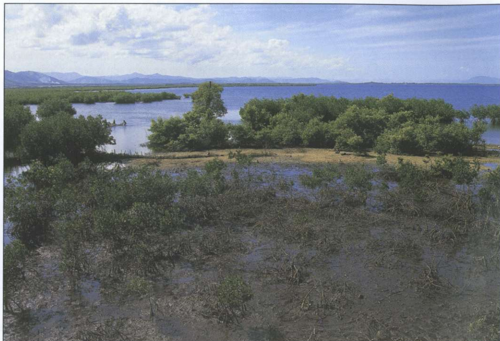
Slika 1: Haiti je država tropskega pasu. O tem pričajo tudi mangrovske obale na severovzhodu države.

dva dela. Jean-Pierre Boyer ju je uspel ponovno združiti in leta 1822 je državi za 22 let priključil še vzhodni del Hispaniole. Ta je po uspešnem uporju proti haitijski nadvladi leta 1844 razglasil neodvisnost kot republika Santo Domingo (zdajšnja Dominikanska republika). Po Boyerjevi smrti se je zvrstila vrsta državljanskih vojn in spopadov za oblast med črnskimi in mulatskimi voditelji. Leta 1915 so Haiti zaradi zaščite svojih interesov in vzpostavitve reda okupirale Združene države Amerike. Obdobje okupacije je trajalo do leta 1934. Haiti je ostal politično nestabilen tudi v naslednjih desetletjih.