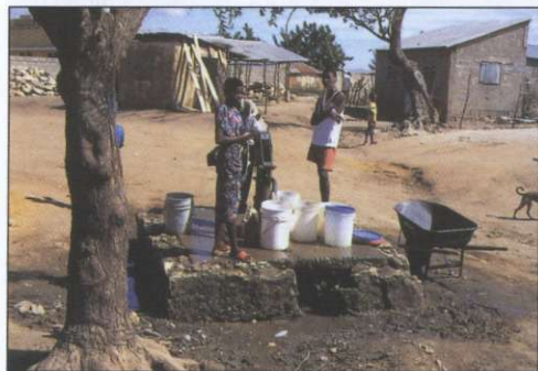
Slika 8: Prebivalstvo se s pitno vodo oskrbuje iz vaškega vodnjaka.

Številni Haitijci verjamejo v dve skupini loa. Prvo predstavljajo večinoma »prijazni« družinski duhovi, imenovani rada , drugo pa »jezni,