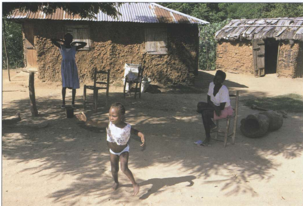
Slika 9: Haitijsko podeželje tudi po gradbenem materialu in obliki hiš močno spominja na Afriko (foto: Jurij Senegačnik).

Francoski lastniki sužnjev so vudu sicer prepovedovali, vendar je preživel na skrivaj. V petdesetih letih prejšnjega stoletja je katoliška Cerkev začela spreminjati strategijo in z vudujem vzpostavljati nekakšno sobivanje. V katoliško bogoslužje so celo vključili določene ljudske prvine, na primer bobnanje, ki jih uporabljajo tudi pri vuduju. Protestanti pa so ostali trdi nasprotniki vuduja in ga vseskozi označujejo kot hudičevo delo. Nekateri med njimi vso haitijsko bedo razumejo kot božjo kazen za prakticiranje vuduja (2, 7).