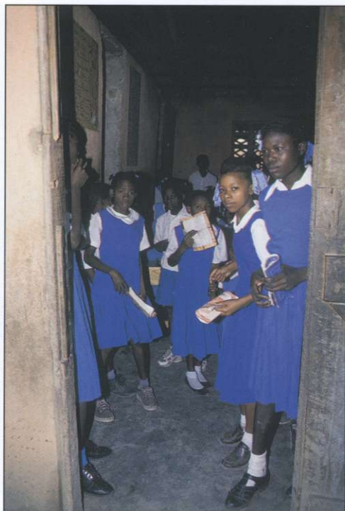
Slika 6: Šolske uniforme sredi dokaj kaotične okolice dajejo prijeten vtis urejenosti, vendar je obisk šole privilegij le nekaterih otrok.

Opisi vuduja se v različnih virih razlikujejo, vendar se ujemajo v nekaterih stalnicah. Pri vuduju naj bi šlo za nekakšno mešanico afriških verskih in čarovniških prvin, ki so jih prinesli sužnji iz zahodne Afrike, s prvinami katoliškega obredja, ki izvirajo iz obdobja francoskega kolonializma. Beseda vudu izhaja iz izraza vudun , ki v jeziku plemena Fon iz Benina pomeni bog oziroma duh. Za vudujsko obredje so značilni pesmi, bobnanje, ples, priprava hra-