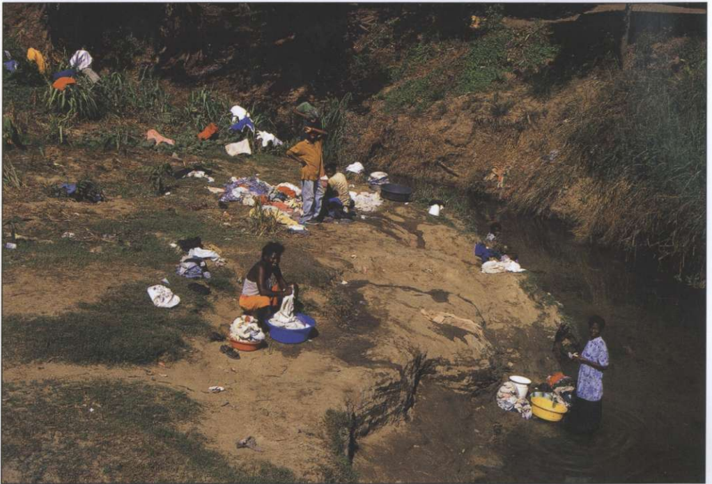
Slika 3: Sanitarije, vodovod in kanalizacija so na haitijskem podeželju povsem neznan pojmi, zato vaščanke perilo perejo v bližnji rečici (foto: Jurij Senegačnik).

Rasna sestava in socialna razloženost prebivalstva. Prebivalstvo Haitija se deli predvsem na osnovi rasne pripadnosti. Kar 95 % je črncev, preostalih 5 % so mulati in drugi. Belcev naj bi bilo manj kot odstotek. Kot edina narodna manjšina se omenjajo Arabci – potomci sirske, libanonske in palestinske trgovce. Haiti je torej najbolj »afriška« država ameriške celine. Velika večina prebivalstva francoščine