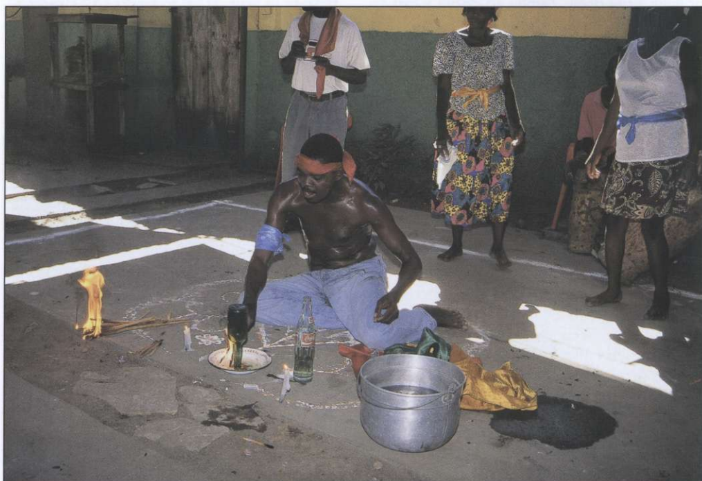
Slika 5: Za turiste prirejeni vudujski obredi so ena najbolj znanih haitijskih atrakcij in ena redkih stvari na skromnem seznamu tamkajšnje turistične ponudbe.

Prvi poskus kreolskega besedila se je pojavil leta 1925, prvi kreolski časopis pa so natisnili leta 1943. Ustava iz leta 1957 je dopustila rabo kreolščine tudi v določenih javnih službah, leta 1979 je z vladnim dekretom prodrla v šole, povsem enakopraven položaj pa je dobila šele z ustavo leta 1987. Največ nasprotovanj je bilo deležno njeno uvajanje v šole. Dvojezična družbena elita je namreč v tem videla nevarnost izgube privilegijev. Njena javna raba se je skokovito razširila predvsem v sedemdesetih in osemdesetih letih. Celotna družbena elita, ki je prej komunicirala le v francoščini, je začela zlasti ob elitnih