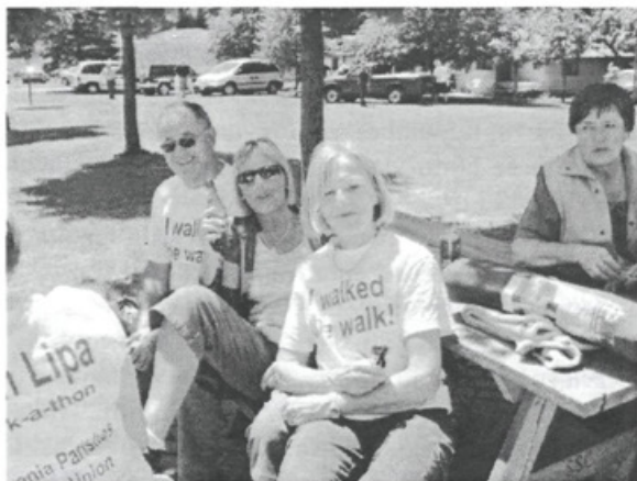
Počitek po Pohodu Ljubezni 2004