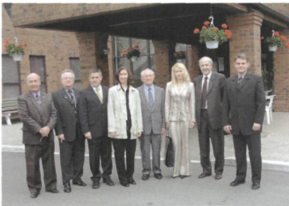
Pred Domom Lipa

V Torontu in Južnem Ontario se je komisija srečala s Kardinalom g. Alojzijem Ambrožičem, obiskali pa so tudi slovenske župnije v Južnem Ontariu.