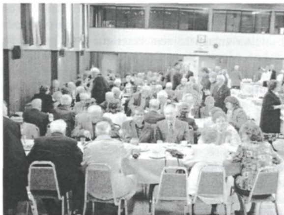
Farani na žeganju

Trideseti maj je bil spet poseben dan. Na Slovenskem letovišču je potekal »Walkathon« za pomoč Domu Lipa. Spet je bilo letovišče polno življenja. Krasno vreme, idealno za tako akcijo večkilometerske hoje, je zvalo okoli stopetdeset mladih in starih »hodačev« na prijetno pot ob stari železnici za letoviščem do Palgrave, kjer so uživali mirno pomladno pokrajino.