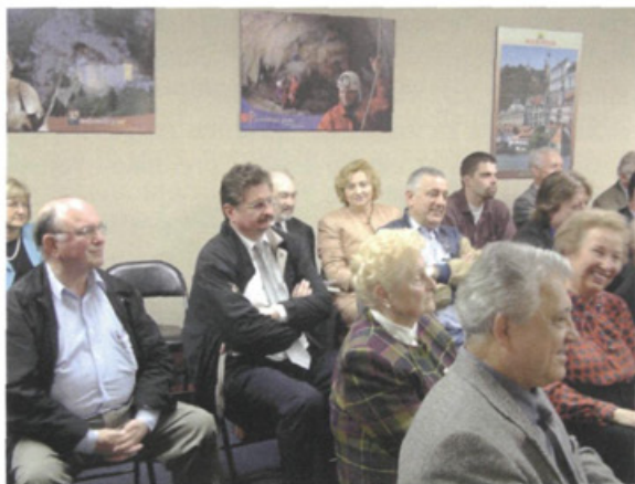
Srečanje v konzulatu

Na skupnem kosilu v restavraciji Linden in pogovoru s predstavniki Vseslovenskega Kulturnega odbora, Kanadskega Slovenskega Kongresa, slovenskimi poslovneži in drugimi predstavniki