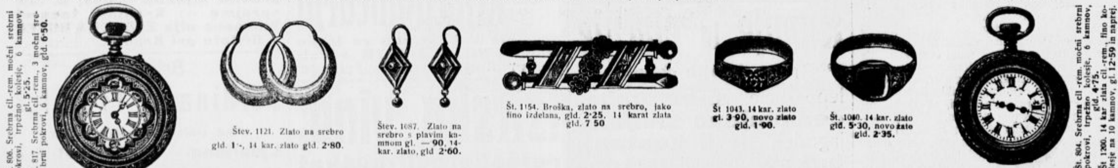
Št. 806. Srebrna cil.-rem. močni srebrni pokrovi, trpežno kolesje, 6 kamnov, gl. 5-25. Št. 817. Srebrna cil.-rem. 3 močni srebrni pokrovi, 6 kamnov, gl. 6-50.

Velika izbira najfinejših precizijskih, švicarskih ur kakor znamke Schoffhausen, Omega, Intakt, Urania, Bilodes itd. — Prstani, uhani z brilantnimi kamni, dolge torgnon veržice, zapesnice, broške, igle itd. različno blago iz kina srebra v največji izbiri. Izborna zaloga finih najnovjših salonskih, stenskih ur in budilk po najnižjih cenah. 2278 25-2