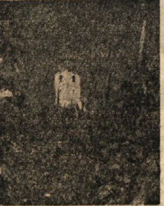
Pogled na vinorodno Ljubno

Rezervirajte svoj prosti čas za obisk tombole v nedeljo popoldne. Na svidenje na stadionu »Rudarja«!