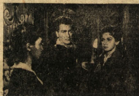
Scena iz filma »Kockar na Mississippiju«