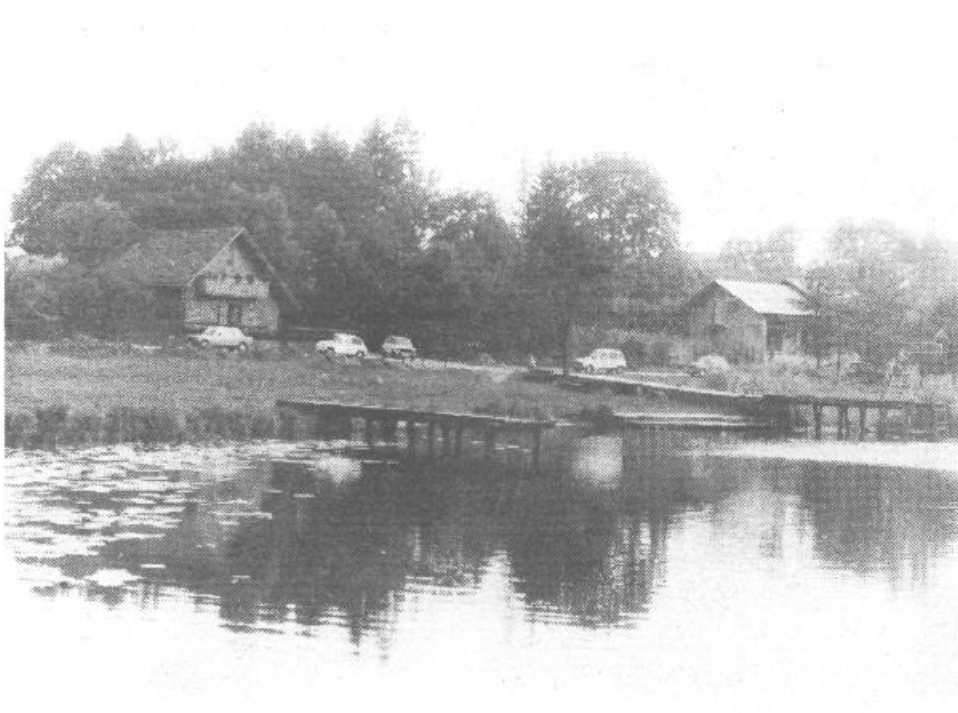
PODPEŠKO JEZERO JE VSE BOLI OGRUŽENO