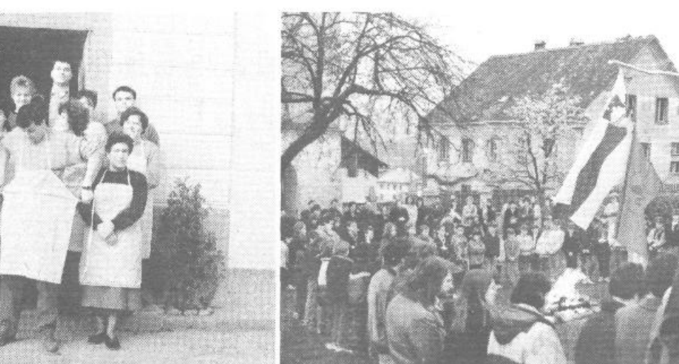
Sprejem skavtov med viteze Sv. Jurija