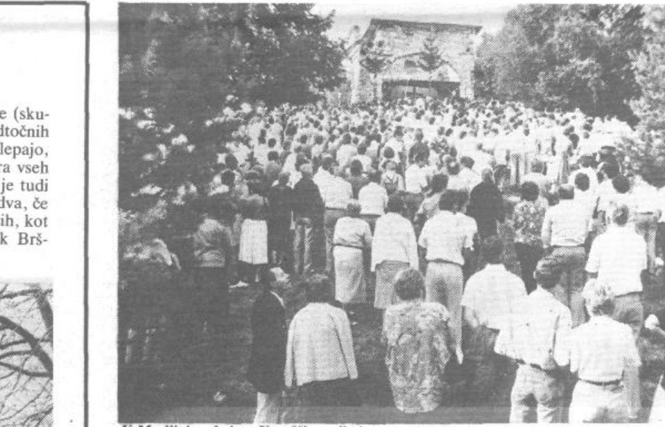
K Marijini cerkvi na Kureščku prihaja vse več ljudi