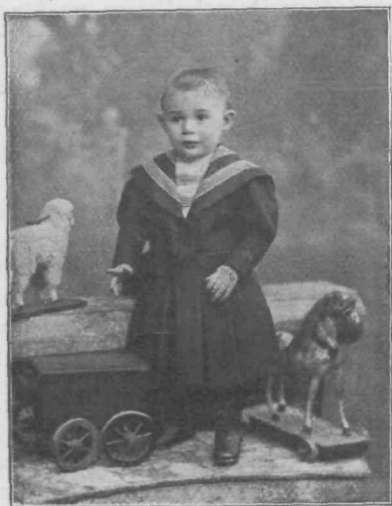
Jezušček me ima rad!

Slava ponižnosti se izkaže tudi iz nasprotnega greha — napuha in prevzetnosti. Z napuhom so hudobni duhovi zapravili rajsko srečo; s ponižnostjo, ki je nanjo prisegal sv. Mihael — kdo kot Bog? — pa so si zaslužili vsi dobri duhovi svoje vekomaj zagotovljeno blaženstvo. — Napuh je bil tudi vzrok prvega greha na zemlji. Že izkušnjava je bila naperjena proti