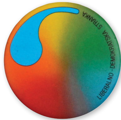
Priponka LDS. (oblikovanje: Matjaž Vipotnik)

Volilna zakonodaja je bistveno spremenila način, na katerega so bili izbrani poslance in poslanci Državnega zbora RS. V 8. volilnih enotah s po 11. okraji so nastopali posamezni kandidati in kandidatke: izvoljeni so bili kandidati z največjim relativnim deležem glasov, upoštevaje celotni delež glasov, ki so jih prejele stranke oziroma predlagatelj kandidatur.