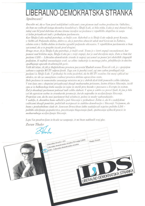
Thalerjevo Pismo volivkam in volivcem. (oblikovanje: Matjaž Vipotnik)