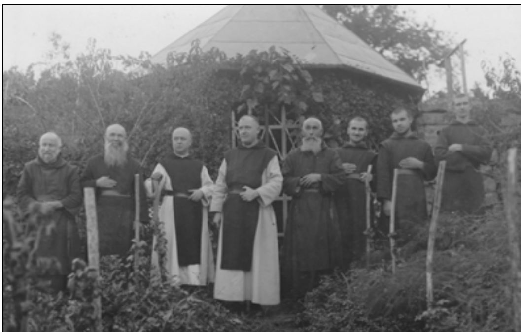
Samostanska družina na Sremiču.

Trapisti so večino pridelanega mesa in predelanih mesnih izdelkov prodali, kar je bil zanje eden od virov zaslužka.