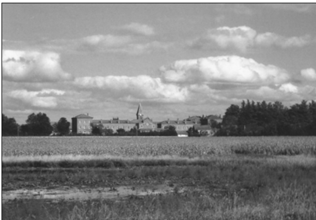
Samostan Notre Dame des Dombes.

opatijo, Augustin pa v opata samostana Dombes. Ko je opat Augustin leta 1870 umrl, ga je nasledil opat Benedikt Margerand, menih istega samostana in prej opatov pomočnik. 27 Med francosko-prusko vojno so leta 1870 dela pri širitvi samostana zastala, v osemdesetih letih 19. stoletja pa je samostan doživel pravi razcvet. V njem je bilo 120 menihov. 28