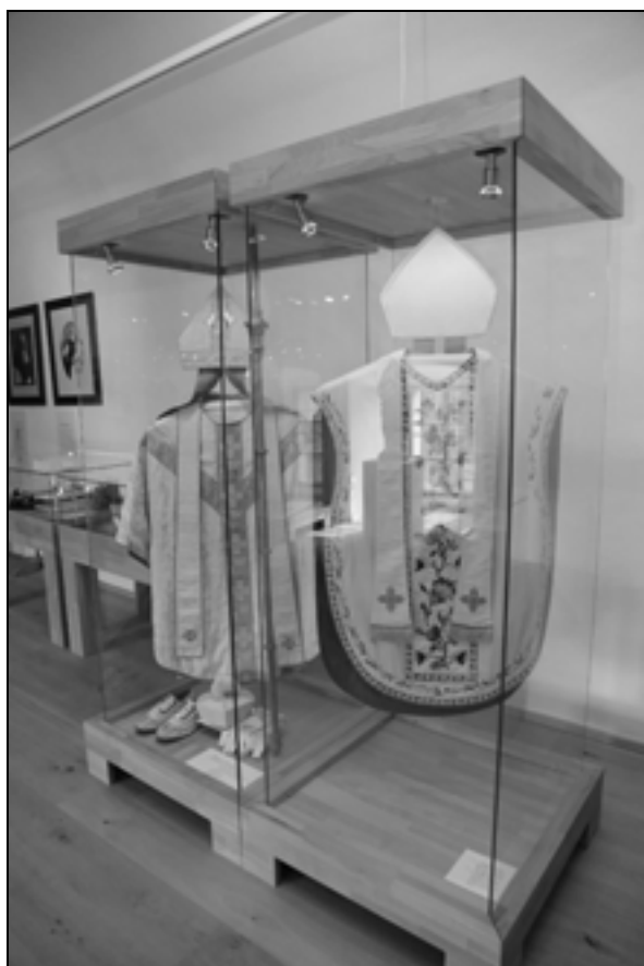
Opatova mašna plašča iz razstave Trapisti v Rajhenburgu.