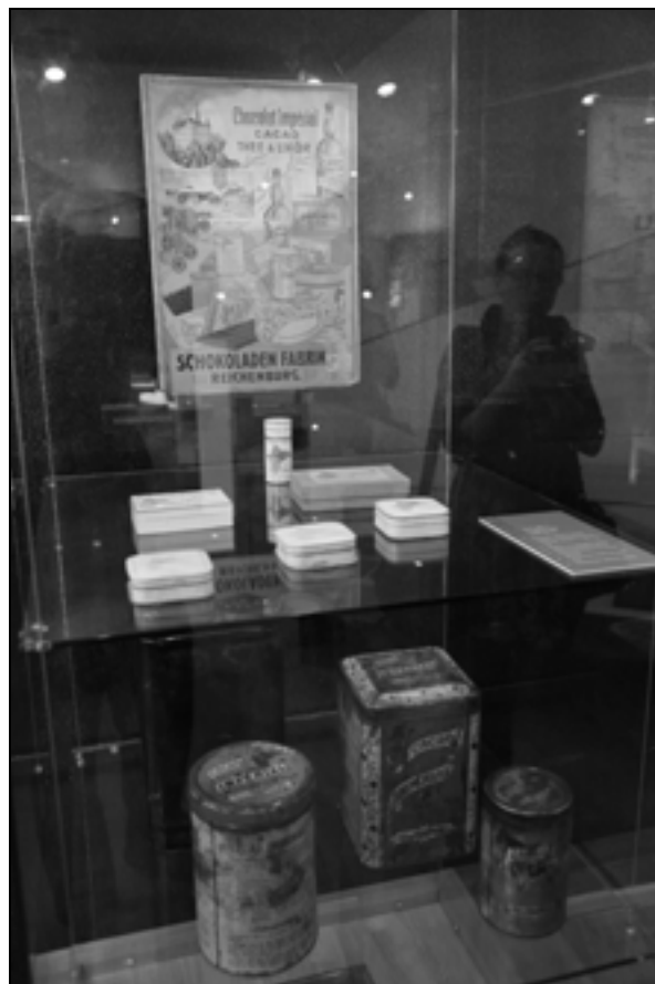
Tovarna čokolade IMPERIAL – posnetek z razstave Trapisti v Rajhenburgu.

Na ovitku trapistovskih čokolad sta bili kravi, v ozadju pa rajhenburški grad in gospodarska poslopja. Na levi strani ovitka zgoraj je bil zaščitni znak – lev in grb rajhenburškega samostana, desno od njiju pa napis Čokolada Imperial. Napisi so bili v