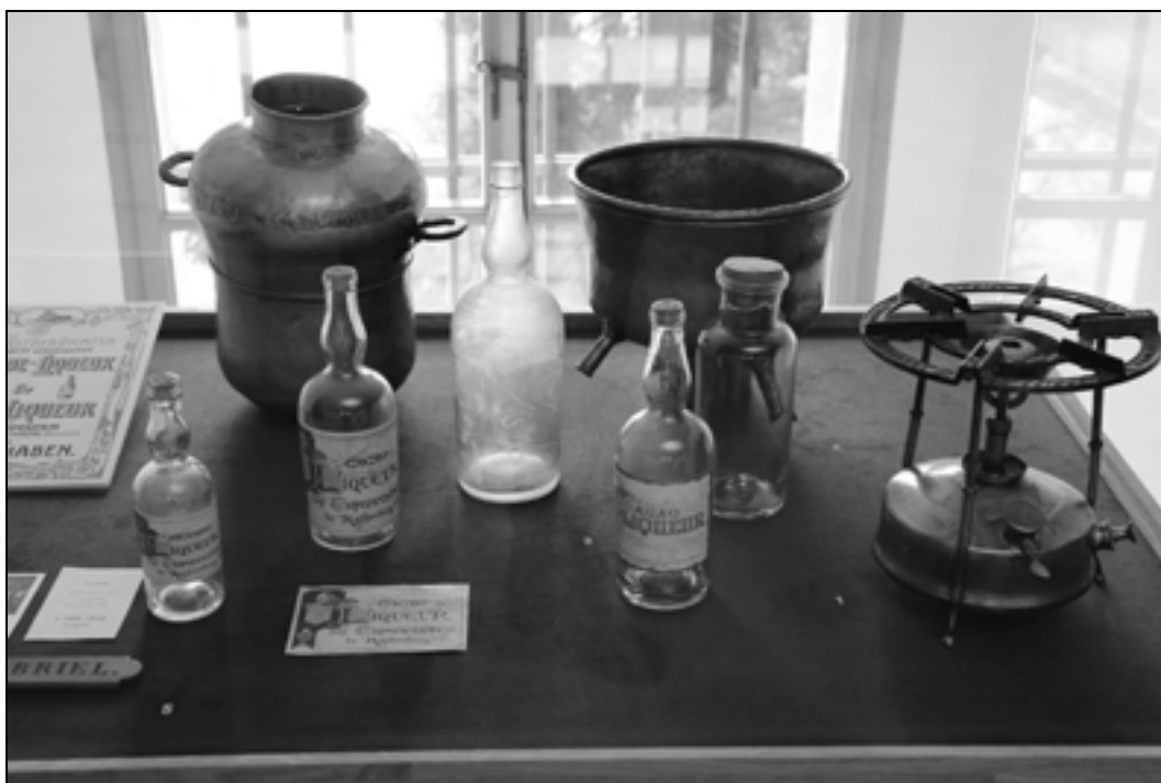
Razstavna vitrina o likerjih na razstavi Trapisti v Rajhenburgu.

različnih jezikih: v slovenskem, nemškem ali francoskem, saj so svoje proizvode prodajali po vsej Evropi. Čokolade so v večjih količinah pakirali v škatle, na katerih je bil poleg zaščitnega znaka, grba in napisa Imperial še napis, da čokolado izdeluje samostan trapistov iz Rajhenburga. Delali so več vrst čokolad: jedilne, mlečne, mlečne z lešniki ter zelo dobre čokoladne bonbone, dražee, ki so jih pakirali v različne škatlice pravokotne, kvadratne ali okrogle oblike. Na njih so bili isti napisi kot na škatlah, v katere so pakirali čokolade.