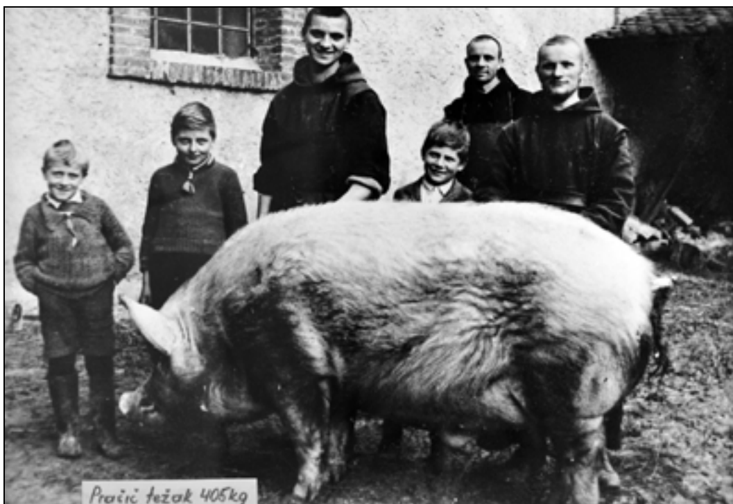
Prašič, težak 405 kg.