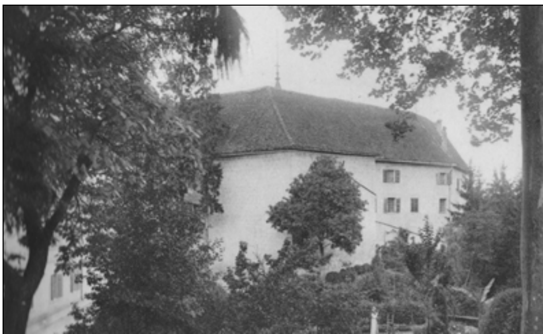
Samostan Marije Rešiteljice (Arhiv MNZS, Enota Brestanica).

V pritličju so menihi uredili obednico, polno dolgih miz. Posoda je bila železna in cinasta, čaše glinene, žlice in vilice pa lesene.