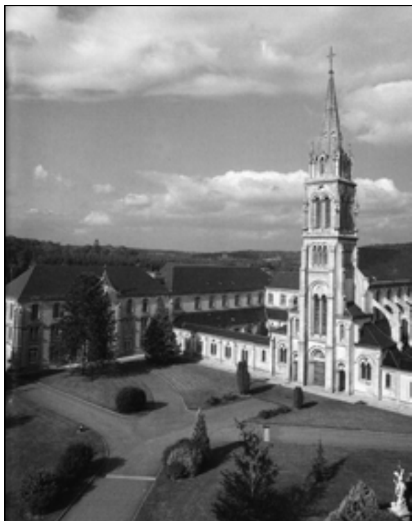
Samostan La Trappe, zibelka reda trapistov.

zernu v Švici, da samostan trapistov povzdigne v opatijo in Augustin pl. Lestrangle je postal opat. Papež je dal redu trapistov tudi vsa dovoljenja za delovanje v Švici. 20 Tako se je večina trapistov preselila v Švico. Tisti, ki so ostali v Franciji, pa so v večini pomrli v ječah ali pregnanstvu. Tudi iz Švice so se morali kmalu umakniti, iskali so zavetišča po vsej Evropi, odšli so celo v Ameriko. Med vladanjem Napoleona I. so se smeli trapisti sprva vrniti v Francijo, saj je ta delovanje reda podpiral. A kmalu je prišlo do preobrata. Napoleon je od papeža Pija VII. zahteval, da iz svoje države izžene vse njegove sovražnike, Ruse, Angleže, Švede in Sardince. Ker ta njegove zahteve ni izpolnil, je zasedel Rim, papeža pa je dal odpeljati v Francijo, kjer so ga zaprli v Sorbono. Trapisti so stopili v bran papežu, in to je bil razlog, da je Napoleon leta 1811 samostanom reda trapistov prepovedal delovanje; tako so bili ponovno izgnani iz Francije. 21 Po padcu Napoleona se je opat Avgustin, v začetku leta 1815, vrnil iz Amerike v Francijo, kjer je odkupil samostana La Trappe in Aiguebelle. Ustanavljati so se začeli tudi drugi samostani. Samostan La Trappe je bil vse do leta 1892 sedež generalnega vikarja, nato pa so trapisti dobili lastnega generalnega opata, ki je imel do leta