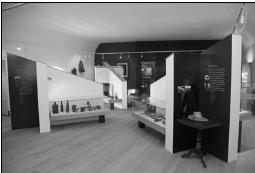
Pogled v razstavni prostor razstave Trapisti v Rajhenburgu.