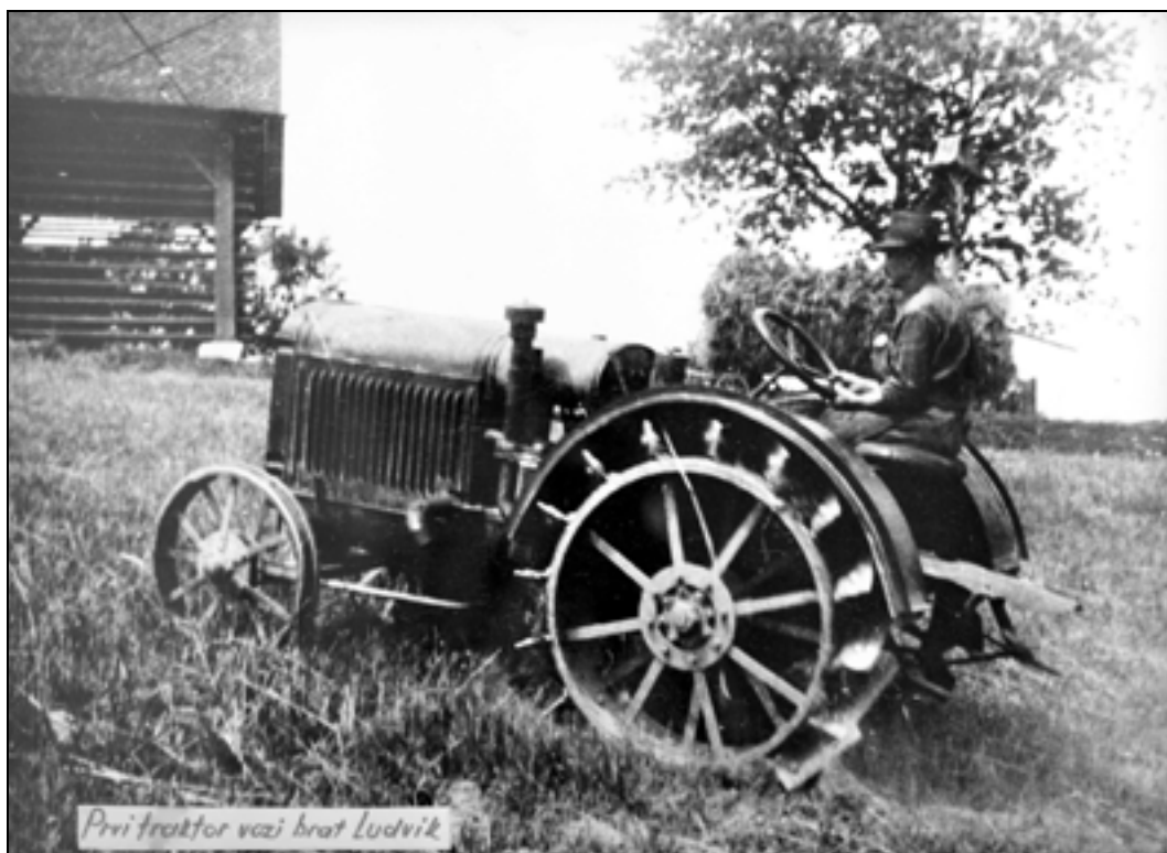
Traktor, prvi v Posavju.