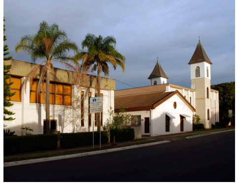
Versko in kulturno središče Merrylands leta 2012.