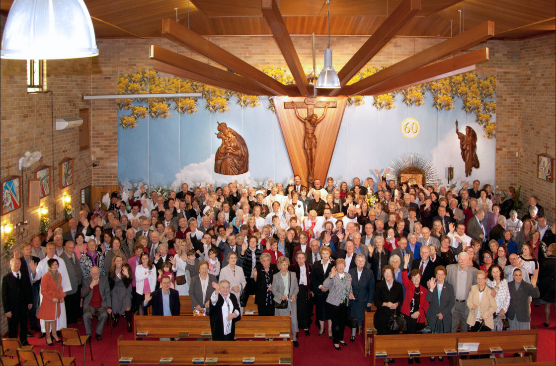
Biserna maša patra Valerijana v Sydneyu, 20. maja 2012