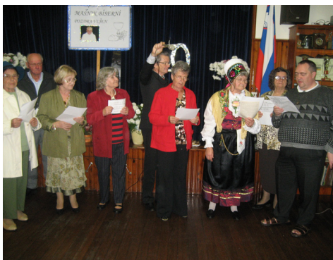
Cerkveni pevski zbor Figtree