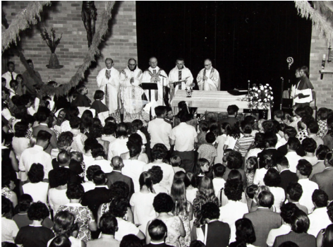
Blagoslov cerkve, 14. januarja 1973.