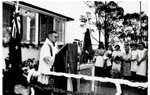
Srečanje s slovensko skupnostjo v Sydneyu leta 1963.