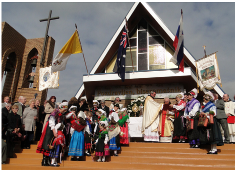
Procesija SRT po slovesni sv. maši. Pri procesiji sodelujejo vsa 4 slovenska društva iz Melbourn in društvo Ivan Cankar iz Geelonga. Sodelovali so tudi otroci Slomškove šole