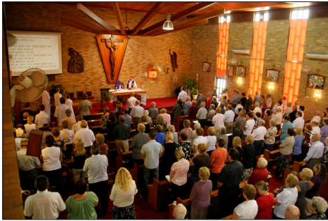
V domači cerkvi sv. Rafaela v Sydneyu leta 2011