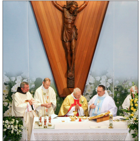
Biserna maša v Sydneyu, 20.maja 2012.