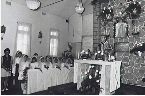
Prvo sveto obhajilo v stari cerkvi v Merrylandsu leta 1970.