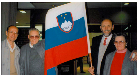
Pater Valerijan je aktivno sodeloval pri osamosvajanju Slovenije.