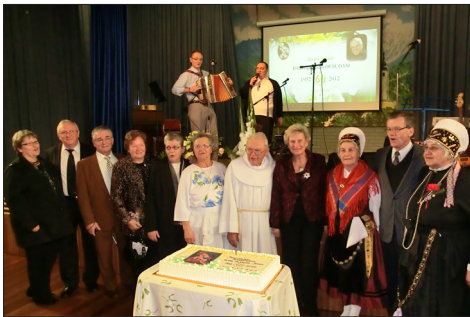
Biserna maša v Sydneyu, 20.maja 2012.