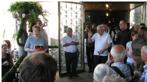
Številni navzoči so želeli pozdraviti biseromašnika, med njimi je kar nekaj naših rojakov iz Avstralije.