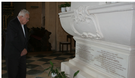
Pater Valerijan je v Vetrinju posvetil svojo molitev žrtvam, ki so jih Angleži vrnili v gotovo smrt, v Jugoslavijo.

Nadaljevali smo študij bogoslovja skupaj z ameriški Slovenci. Predavanja so bila v latinščini, ker oni niso znali toliko slovenščine, da bi profesorji, ki so bili slovenski patri iz domovine, predavali v slovenščini.