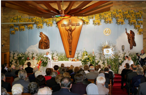
Biserna maša v Sydneyu, 20.maja 2012.