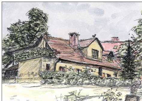
Jenkova domača hiša v Šiški