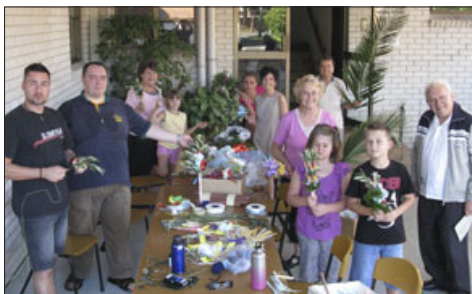
Priprave na cvetno nedeljo leta 2012.