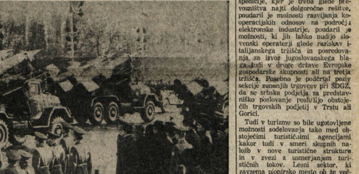
Ob prisotnosti najvišjih sovjetskih oblasti je bila večeraj na moskovskem Rdečem trgu vojaška parada ob obletnici oktobrske revolucije. Pred začetkom parade je govoril obrambni minister maršal Ustinov, ki je ostro napadel države NATO in se zlasti ZDA, ki jih je obtožil oboroževalne tekme. Nit z besedico pa ni omenil izidov ameriških predsedniških volitev