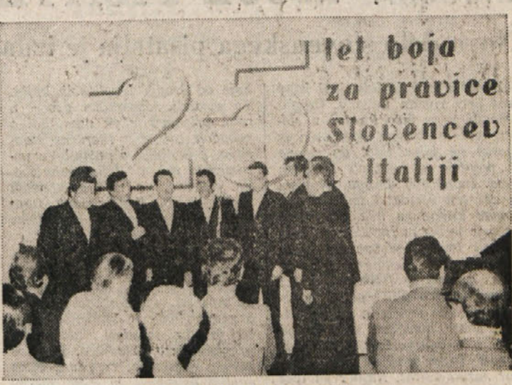
Sporod je zaključil Sovodenski nonet