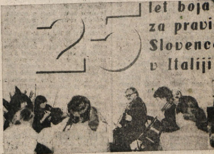
Nastopili so z nekaj točkami tudi člani Glasbene matice

Praznik kostanja v zavodu San Luigi Jutri martinovanje v Štandrežu V Štandrežu bodo kmetje martinovali že jutri, v nedeljo. Za to bo poskrbelo, kot vsako leto, domače Kmečko društvo, ki vabi na štandriški trg pred cerkvijo vse domačine in vse, ki so jim pri razstavi stari običaji. Na trgu bodo razstavili vse dobrote, ki jih domači kmetje ponudijo doma pridelano vino. Martinovanje bo po maši v domači cerkvi.