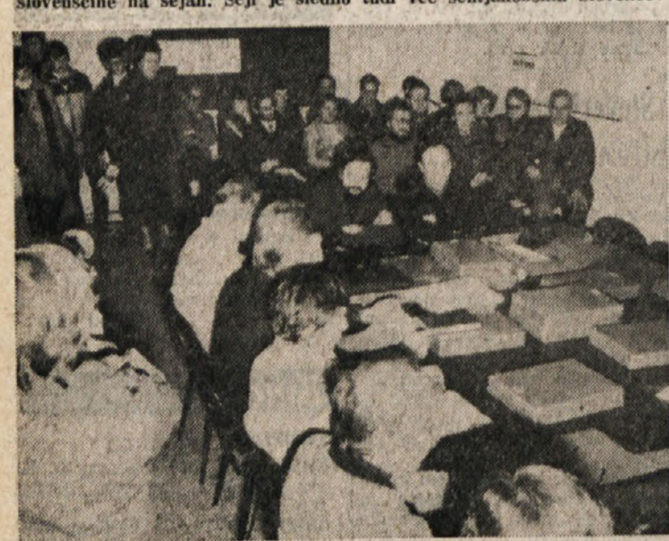
Seji je sledilo tudi več šentjakobskih Slovencev