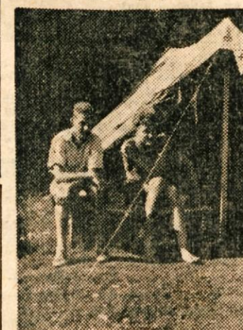
Taborniki v svojem taborišču

Taborniška organizacija v Sloveniji stopa v peto leto svojega delovanja med mladino.