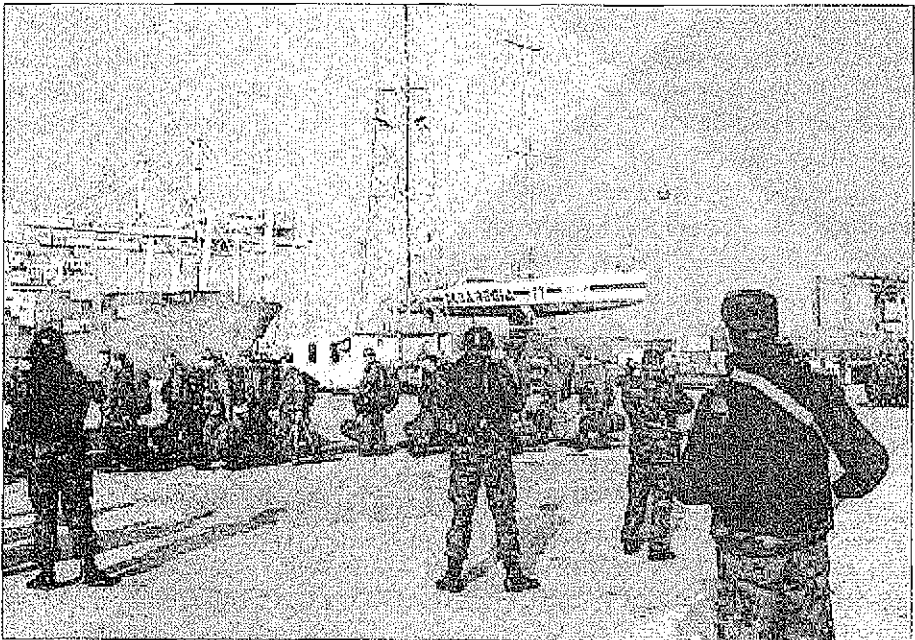
Koper, 25. oktobra 1991: odhod zadnjih pripadnikov JLA iz Slovenije

"napadu JLA", "agresiji" ter "oboroženem spopadu v Sloveniji" (Špegelj, 2001, 238). Špegljevi kolega, letalski general Anton Tus, je svoje poglavje v reprezentativnem Zborniku razprav o vojni na Balkanu poimenoval "Vojna v Sloveniji" toda ta izraz uporablja le v naslovu (Magaš, Žanič, 1999, 67-92). V samem poglavju pa general Tus delovanje JLA v Sloveniji po 26. juniju 1991 opisuje kot "oborožen poseg", oborožene spopade 27. in 28. junija 1991 pa imenuje "boji". Drugi tuji in nekateri domači avtorji skoraj brez izjeme dogajanje v Sloveniji imenujejo "oboroženi spopad". Tako poveljnik zagrebskega vojaškega območja neposredno pred 25. junijem 1991 general Konrad Kolšek sodi, da v Sloveniji nestrokovno uporabljajo poimenovanji "vojna" in "desetdnevna vojna". Namen teh poimenovanj naj bi bil po njegovem mnenju predvsem propaganden ali "domoljuben", medtem ko naj bi l. 1991 dejansko šlo le za "kratkotrajni spopad". Pri tem K. Kolšek navaja mnenja domačih in tujih avtorjev ter več strokovnih definicij vojne (Kolšek, 2001, 281-301). Nekdanji jugoslovanski državni sekretar za ljudsko obrambo admiral Branko Mamula je delovanje JLA na ozemlju Slovenije imenoval z besedo "operacija", njen izid pa je ocenil kot "neuspeh" (Mamula, 2000, 212).