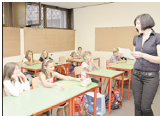
Šola v Romjanu (zgoraj) in na Vrhu (spodaj) BUMBACA, K.B.