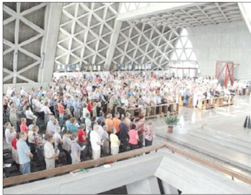
Romarji so dodobra napolnili svetišče na Vejni

Nedeljsko srečanje je bilo tudi sklep kolesarskega romanja radijskih sodelavcev