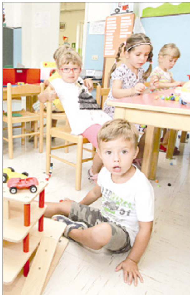
Vrtec (zgoraj) in nižja srednja šola v Doberdobu (spodaj) K.B.

Prostorske težave ostajajo, v tem trenutku pa je na prvem mestu rešitev problema avtobusnega prevoza za nižješolce