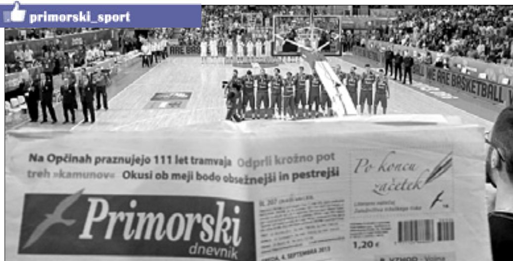
Primorski dnevnik v Areni Bonifika