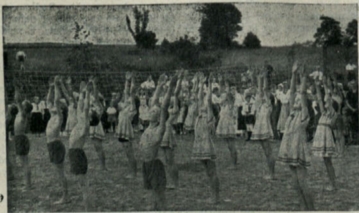
Proste vaje na novem športnem igrišču v Predgradu