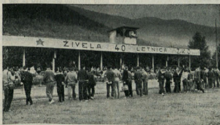
Pred začetkom atletskih tekmovanj