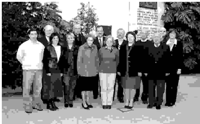
Skupina profesorjev srednje šolskega tečaja v letu 2004

Vsem rojakom, ki so na kateri koli način pripomogli, da smo mogli vse to leto 2004 v redu izpeljati, se Zedinjena Slovenija prav iz srca zahvaljuje.