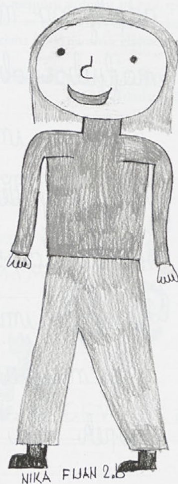
NIKA FLJAN 2. B