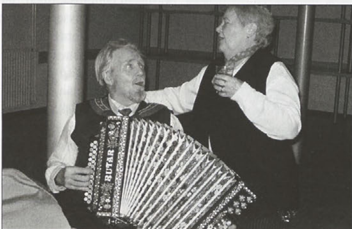
Na občnem zboru so tudi zaigrali in zapeli