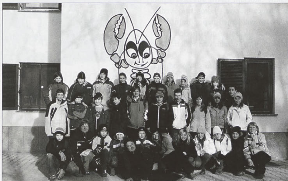
Pred CŠOD Dom Rak v Rakovem Škocjanu, 20. februarja 2009.

mestih. Ker smo bili na Krasu, smo se učili tudi o kraških pojavih in oblikah. V Rakovem Škocjanu raste jelka, ki ima premer pet metrov. Preizkusili smo se v lokostrelstvu. To je bil za nas pravi dogodek, saj smo se vsi prvič srečali z lokom. Ker smo bili vsi začetniki, smo se najprej naučili teorijo, šele potem smo vzeli loke in začeli streljati. Čeprav smo streljali prvič, smo dosegali izjemne rezultate, na katere smo bili zelo ponosni. Vsi smo se najbolj veselili vožnje s kanuji in dočakali smo jo. Polni energije smo veslali po reki Rak in tudi v vodi kdaj obtičali, saj smo veslali prvič in nismo imeli izkušenj. Ker smo vsi navdušeni športniki, smo tudi plezali ter se po vrvi spuščali navzdol. Ko si priplezal do vrha in si se razgledal naokoli, je srce močno bilo, a ko si se spustil po vrvi navzdol, je bil pravi užitek, ki ga ne moreš pozabiti. V Rakovem Škocjanu rastejo podobna drevesa v Halozah, zato jih je bilo zanimivo spoznavati. Počutili smo se kot nekakšni gozdni detektivi. Vsa ta prelepa narava nudi tudi dom rjavim medvedom.