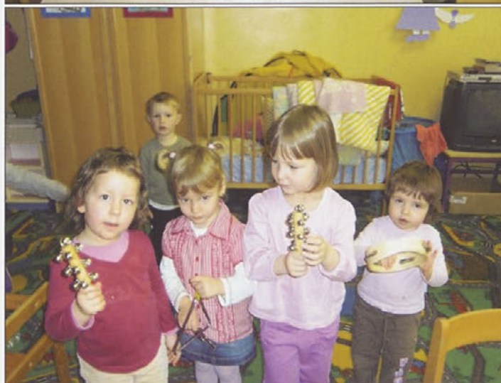
Ob igri je zmeraj lušno in veselo.