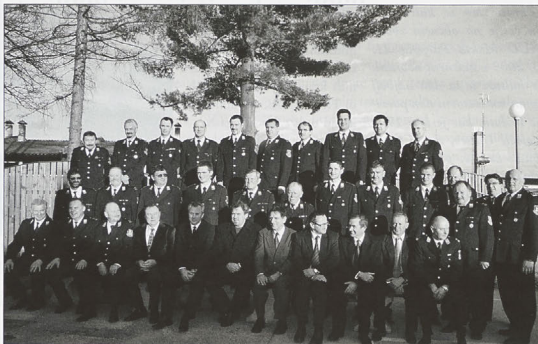
Podpisniki gasilskih aneksov z župani petih občin in vodstvom Območne gasilske zveze Ptuj.

V našem primeru se recesija še ne pozna in načrtujemo, da se bo v letošnjem letu