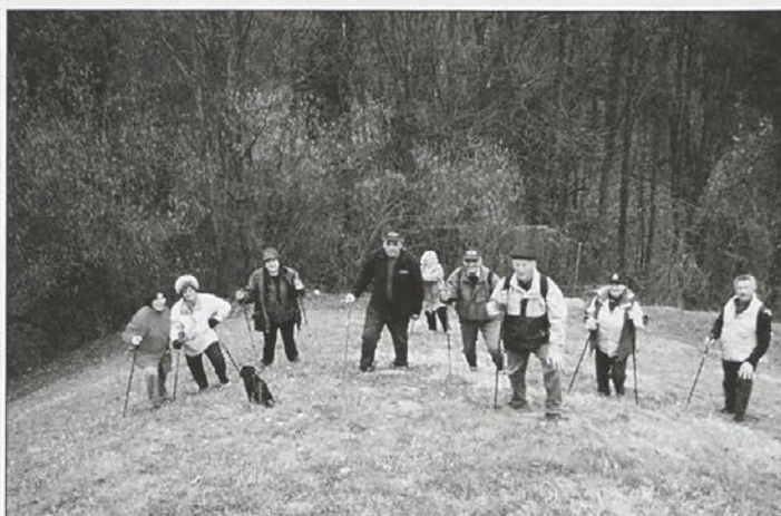
Planinci so se letos že podali na Pot med vinogradi