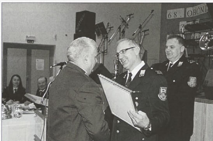
Poveljnik avstrijskih gasilcev Rupert Hammer je bil sprejet v častno članstvo PGD Zavrč.