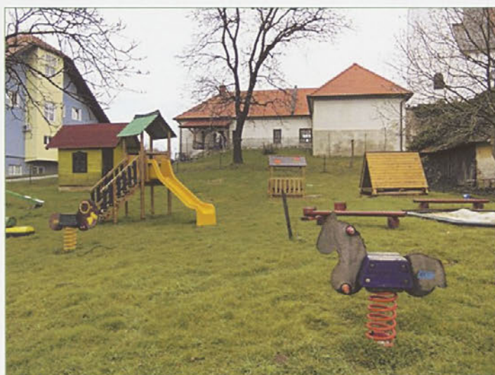
Malčki so veseli novih igrač in zunanjih igral, kjer bodo lahko počeli veliko zanimivega.