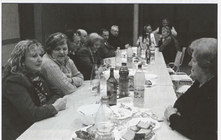
Tudi pri mizi je nastal prijeten pogovor