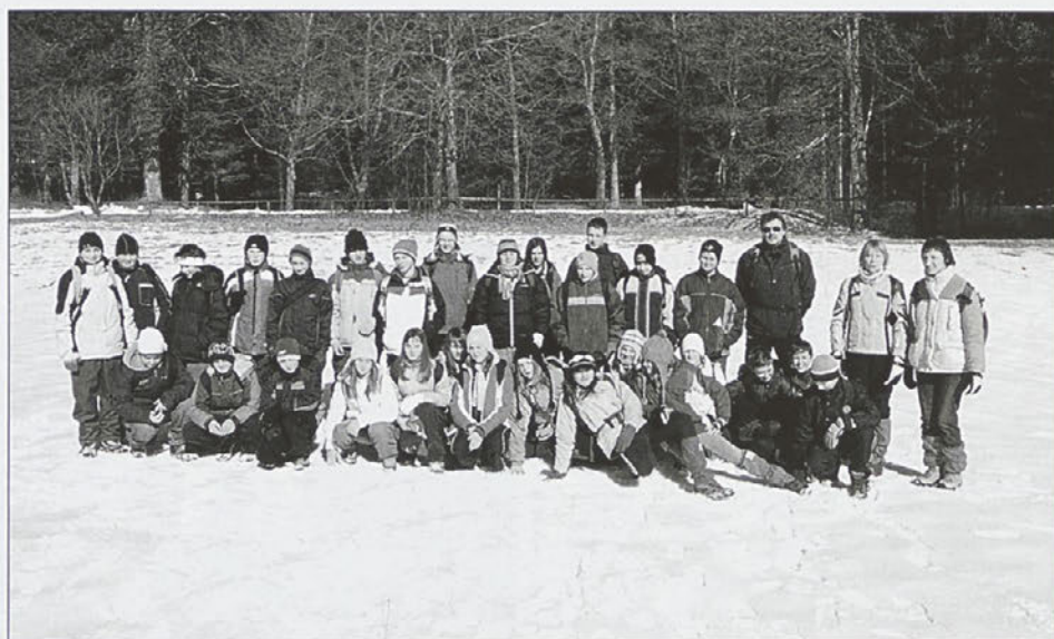
Završki osnovnošolci na naravoslovnem tednu v Rakovem Škocjanu

Ob ogledu kapnikov, zanimivostih in pripovedovanju mentorice smo spoznali, da smo se pri nekaj stvareh uštel. Zelške jame so bile nepozabno doživetje. Ob ogledu največje udornice z imenom Koliševka smo si začeli predstavljati, kakšno moč ima narava. Končno smo dočakali lokostrelstvo. Čeprav nas je v senci malo zabeležilo, je