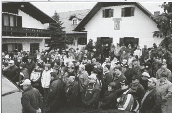
Po Halozah na vincekovo nedeljo, ko je bila tradicionalna Vincekova rez pri Pungračičevih v Drenovcu.