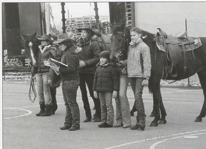
V konjeniškem klubu Borl so prepričani, da bo blagoslov konj postal tradicionalen ...