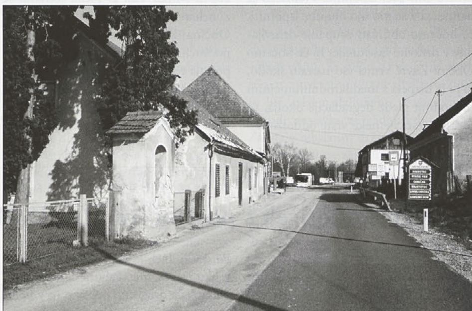
Vstop v občino Zavrč bo imel kmalu drugačno podobo. Vse bliže je izgradnja krožišča ...