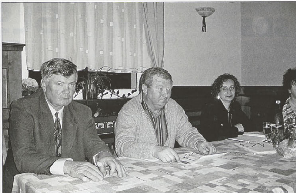
Na občnem zboru so se spomnili začetkov delovanja pred 15 leti, predstavili pa so tudi načrte in cilje za prihodnost.

izvedbi projektov, dogodkov in ostalih dejavnosti. V bodoče želijo pomembno prispevati k še boljšemu sodelovanju s sorodnimi društvi (Govedorejsko društvo, Združenje rejcev prašičev, Biotehniška šola, društva podeželske mladine ...), saj verjamejo, da je v slogi največja moč. To bodo tudi zares potrebovali, saj med najpomembnejše projekte v letu 2009 gotovo spada udeležba na 56. svetovnem prvenstvu v oranju, ki bo 4. in 5. septembra v Moravskih Toplicah. Obenem želijo za svoje stranke najprej korektno pripraviti cenik strojnih storitev, vršiti kakovostne strojne usluge po konkurenčnih cenah, organizirati izobraževanje za izvedbo izrednih prevozov v kmetijstvu ter za uporabnike FFS, sodelovati na kmetijskem sejmu v Gornji Radgoni in v Komendi, še naprej sodelovati z Biotehniško šolo Ptuj (testiranje in servisiranje škropilnih naprav), zagnati posodobljeno spletno stran Strojnih krožkov na državnem nivoju ... Z zunanjimi poslovnimi partnerji želijo še naprej svojim članom dobavljati tako varno delovno obleko kot tudi nadomestne dele za kmetijsko mehanizacijo. V mesecu juniju načrtujejo strokovno ekskurzijo v Romunijo, z namenom videti, kaj počne vzhodnoevropsko, balkansko kmetijstvo. V jesenskem času pa se že ozirajo za novim sejmom kmetijske mehanizacije in tehnike, vablivo se zdi tudi vabilo