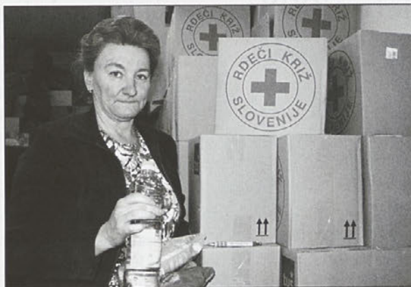
Vse več ljudi potrebuje osnovne življenjske potrebščine.

Na sedežu na Ptuj smo za občane Zavrča razdelili v 10 delitvah še 150 kg moke, 360 kg sladkorja, 450 zavitek