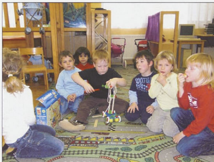
Zavrc̄ski malčki se igrajo z novimi didaktičnimi igrači.