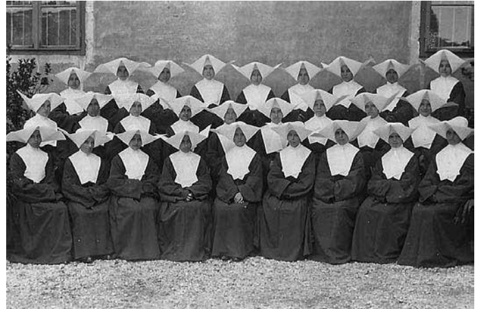
Sestre usmiljenke v strežniški šoli v šolskem letu 1928/29.

Na medicinskem področju jih najdemo na naslednjih delovnih mestih: prva, glavna ali vodilna sestra, ki je praviloma bila tudi hišna predstojnica sestrske skupnosti; sestra pri bolnikih (nima formalne izobrazbe), bolničarka (ima formalno izobrazbo); anesteziistka; pri rentgenu; v lekarni; v laboratoriju; v ambulanti; nočna služba; na oddelkih: kirurški, sestra pri operacijah (nima formalne izobrazbe), instrumentarka (ima formalno izobrazbo), infekcijskem, internem, medicinskem, porodnem, ginekološkem, septičnem, očesnem, dermatološkem, urološkem,