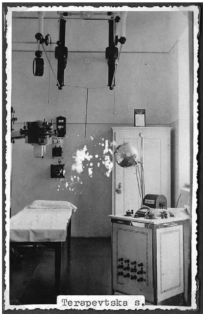
Terapevtska soba v brežiški bolnišnici.

v bolnišnici v Idriji. Zaposlene so bile tudi v Sanatoriju Leonišče, ki je bil v lasti Družbe. 6