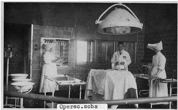
Sestre usmiljenke v operacijski sobi bolnišnice v Mariboru.