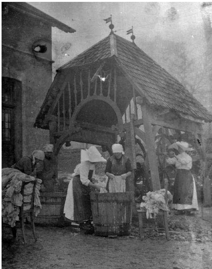
Sestre usmiljenke med pranjem perila v krški bolnišnici.

otorinolaringološkem, nevrološkem, pljučnem, tuberkuloznem, ortopedskem.