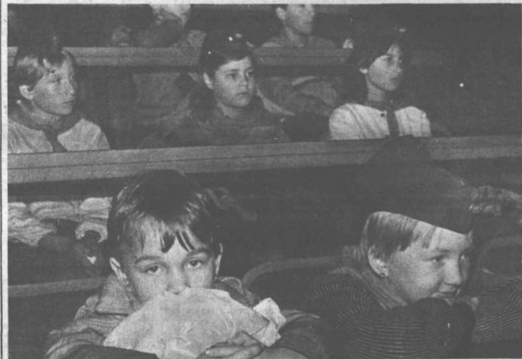
Z občinske pionirske konference