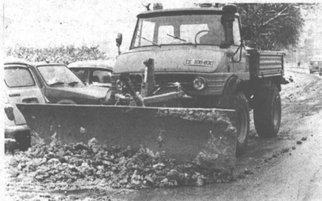
Strojni park je enak, kot lansko leto, dela pa kvečjemu še več

Zima je že pokazala zobe, prvi sneg v tem času pa tudi ni nobena redkost. Nekatere voznike, ki svojih konjičkov še niso uspeli zimsko opremiti, je sneg sicer presenetil, komunalcev pa ne, kot sami zatrjujejo. O tem smo se lahko tudi sami prepričali, saj so s potrebno opremo pohiteli na ceste, čeprav snežna odeja še ni bila debela 10 centimetrov, kolikor je meja, ko morajo po zakonu pričeti s pluzenjem. Pri manjši debelini snega se namreč močno kvirajo plugi.