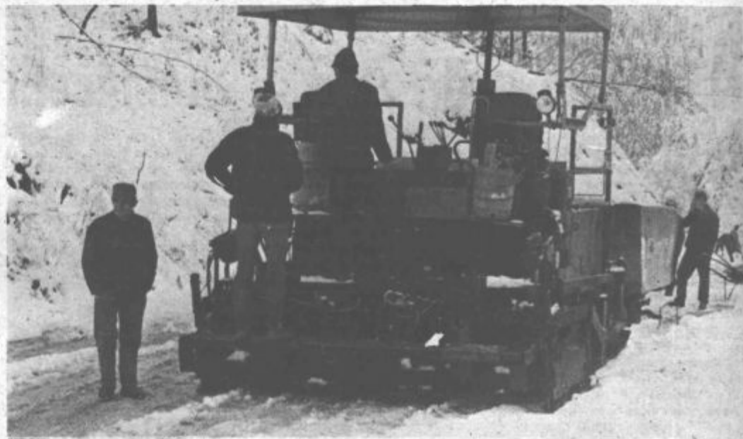
Svečana otvoritev asfaltiranega odseka ceste bo v nedeljo ob 9.30

Novo urejena cesta ima precej manjši naklon, tako da jo bo v zimskih mesecih tudi ob najhujših dneh, ob primernem pluzenju in posipanju, zmoglo vsako primer-