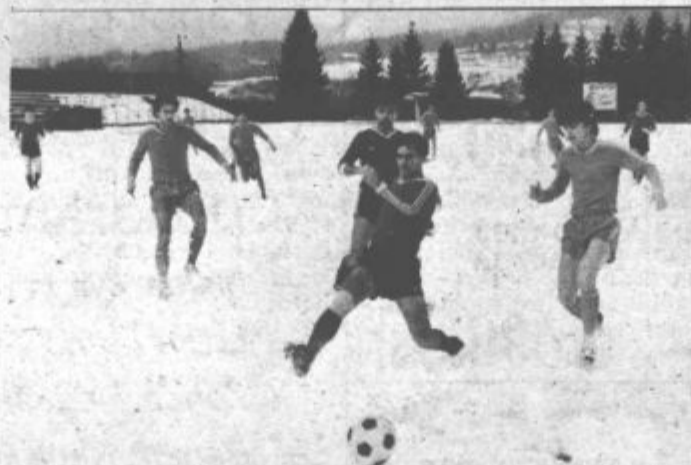
Tudi vodstvo s 3:1 ni bilo dovolj za zmago.