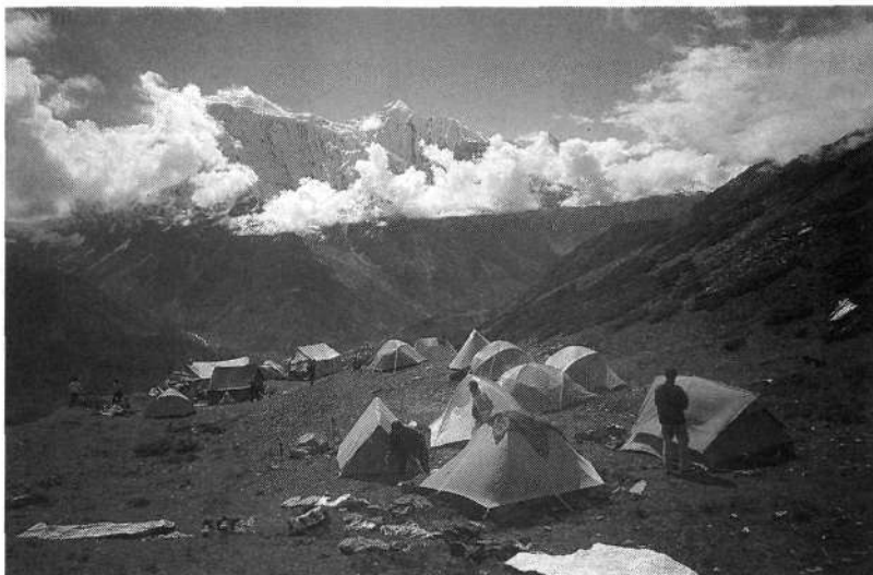
Bazni tabor med vzponom na Naur Peak