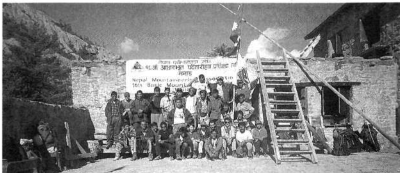
Udeleženci tečaja na šolskem dvorišču v Manangu