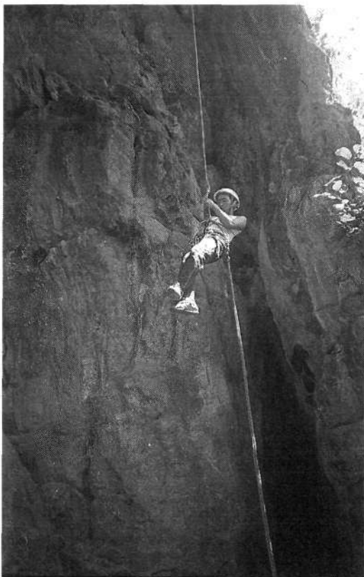
Praktične vaje spuščanja po vrvi v plezalnem vrtcu pri Katmanduju

v avtobus in po dnevu vožnje do kraja Besisahar se je naslednji dan pričel pohod do Mananške doline, kjer stoji stavba šole. Pet dni hoje, okoli 100 kilometrov poti in 2500 višinskih metrov smo spoznavali prelepo deželo in njene ljudi, ki živijo ob reki Marsiandi. Reka nastaja iz ledeniških voda blizu Mananga, pot pa poteka ves čas po ozki dolini ob njeni strugi. Dan za nami so prišli v šolo tudi vsi tečajniki in nadaljevali smo predavanja in vaje. Nekaj praktičnih vaj smo opravili na šoli sami, saj so na steni pripravljene klini in ta namen, nekaj v bližnjih skalah, odšli smo tudi na ledenik pod Gangapurno (7454 m), kjer je večina med tečajniki prvič plezala s cepini in derezami, poglaviti del pa se je odvijal v gorah nad dolino, kjer smo preživeli teden dni.