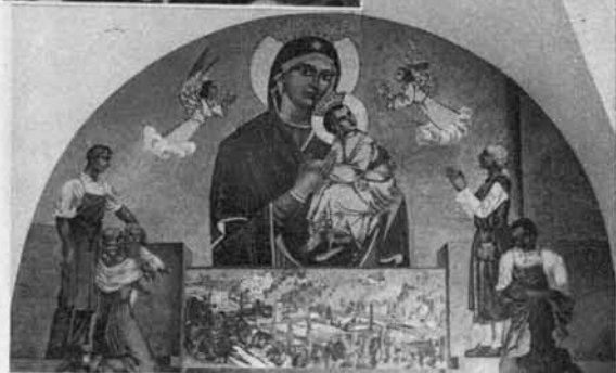
Slike iz prenovljene moške kapele trziške župne cerkve.

Zgoraj: Tovarniški del Trziča z Marijo vedne pomoči ter delavstvom, ki se k nji zateka.