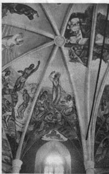
Motiv iz kostanjeviške cerkvice.