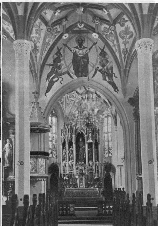
Pogled v notranjščino škofjeloške župne cerkve, ki je bila letos vsa prenovljena; nad vhomom v presbiterij lepa nova slika Kristusa-Kralja.