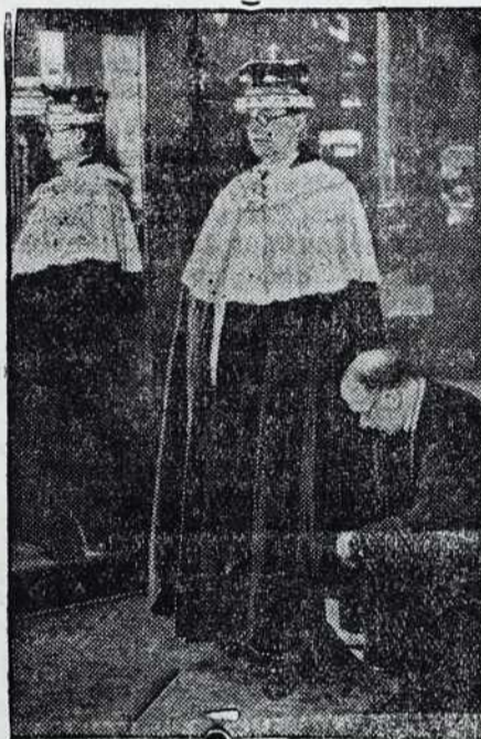
Prpriave za kronanje angleškoga krala Eduarda VIII. se že vršijo. Kronanje de kletl maja. Krojači že delajo državne obleke za angleške lorde. Edna takša obleka košta okoli 30.000 Din.

bila potrebna. Celo zdaj, kda kriza nešče popüščati i brezposelnost se od dneva do dneva povekšava. Dugo smo trpeli i niti ne mislili to reč prnesti v javnost. Kda pa vidimo, da ta reč vsikdar bole stopa v resnost, jo moramo na tom mestu povedati, to je nekrščansko ravnanje z našim šolskim slugom. Pred par leti je občinski odbor ino šolski odbor nastavio šolskoga slugo, ki bi ovak prišo na bremen občine z šest članskov družinov. Do zdaj je bilo vse v redi i vse dobro. Zdaj pa na ednok ne več prostora za šolskoga sluga v šolskom okoliši, mora iti vü, brez toga, da bi se lahko kaj povedalo, da ne držao v največjoj snagi šolske sobe i vse drugo. Zdaj mora vü, občina njemi mora poskrbeti stanovanje ino hrano, pa še vzdržavati novoga šol. slugo. To je dvojno breme za občino. Zdajšnji šolski sluga je jako lepo čisto šolske sobe proti malo loj nagradi i za stanovanje. Guči se, da