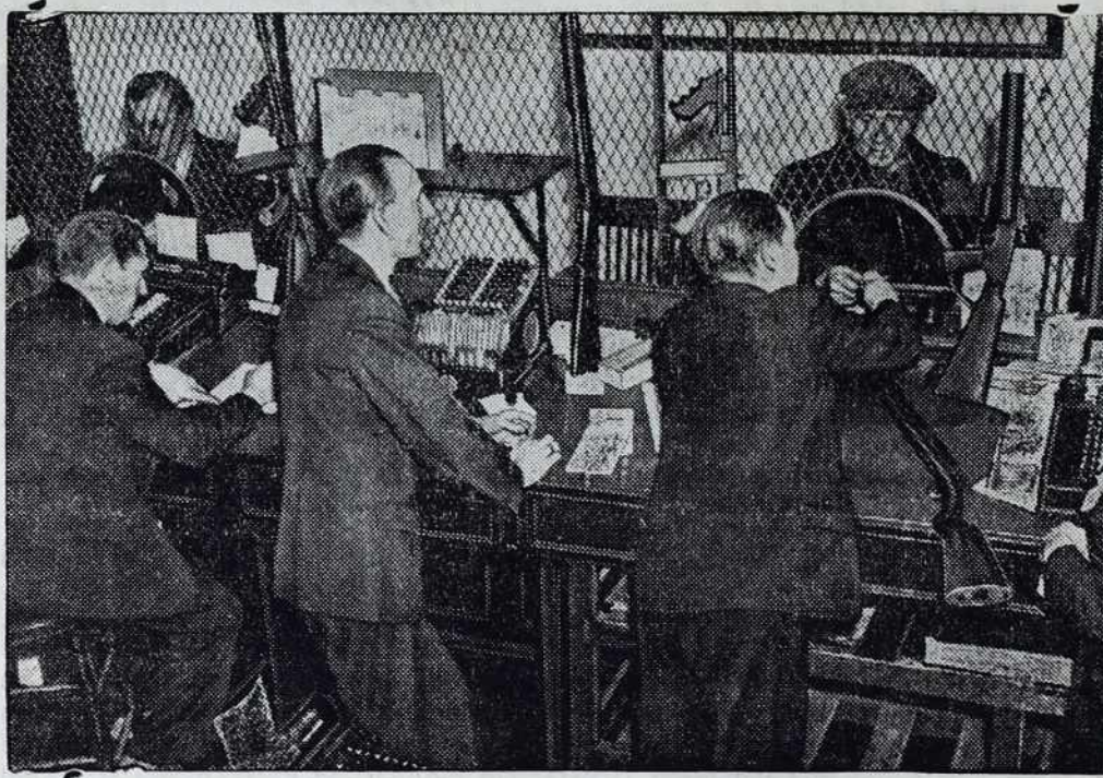
Davkarije so nindri ne prilüblene. V Ameriki majo uradniki pri sebi puške, s šterimi bi se branili, če bi je davkoplaćevalci napadnoli.

Želja po lastnem svetniku je med nami velika. Zavedamo se, da bi za naš narod bilo izrednega pomena, ako nam Gospod Bog izkaže to veliko milost in usliši naše pro-