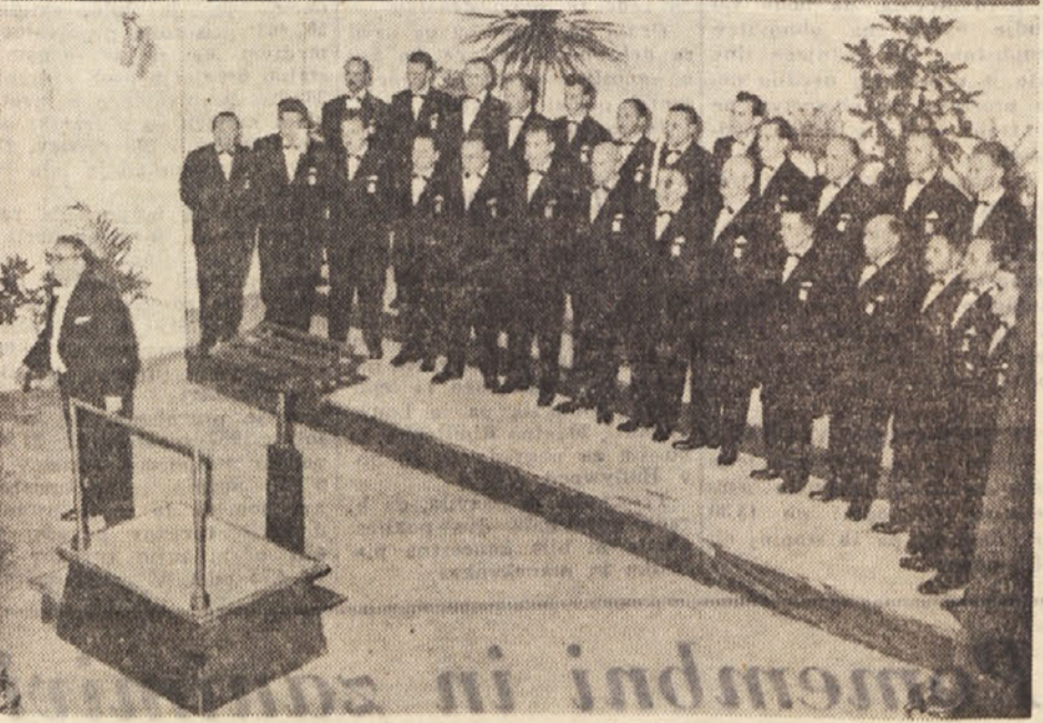
Pevska zbor «Vinko Vodopivec» (zgoraj) in «Slava Klavoras» (spodaj)