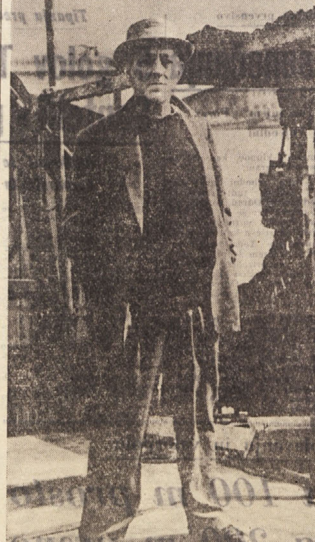
Znameniti angleški igralec, Alec Guinness, ki ga poznamo kot polkovnika iz filma »Mest na reki Kvaja«, igra vlogu Guilleya v filmu »Usta resnice«, ki so ga predvajali včeraj na festivalu v Benetkah

General, kot ga vseh Libanon imenuje, je tih človek z glasom — pravijo — sčrju ali podooben prej profesorju. On je — pripovedujejo za Sehaba neki potopis — sedel dvajset let kot poveljnik vojske na položju in opazoval politično razborno v Libanonu držal arabsko od strani in se ni mešaval v politične borbe