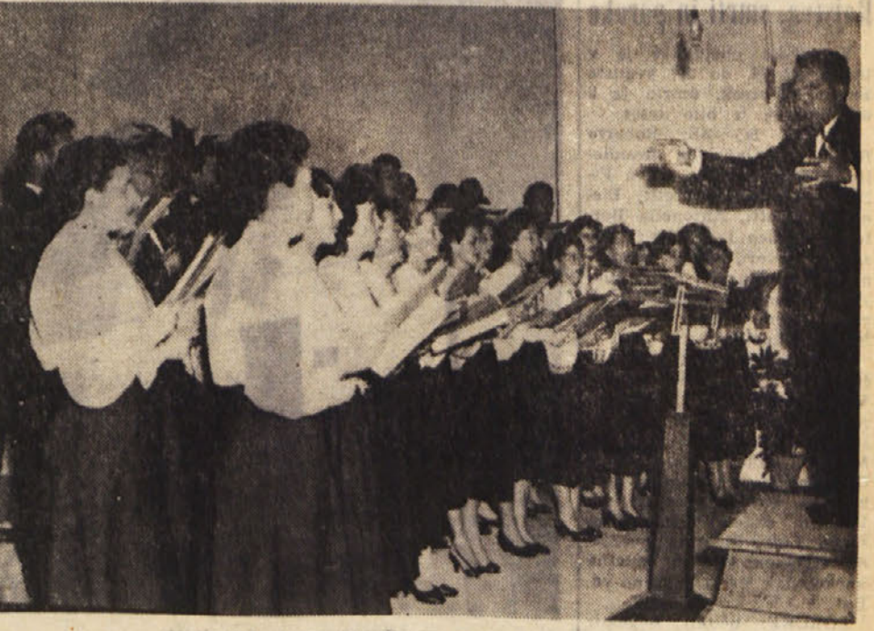
Pevski zbor «Proleters iz Sarajeva