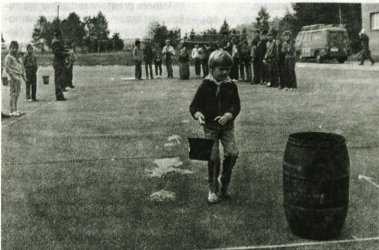
S tekmovanjem so bili zadovoljni najmlajši-pionirji gasilci. Rezultati so pokazali, da so bile priprave na tekmovanje dobre.