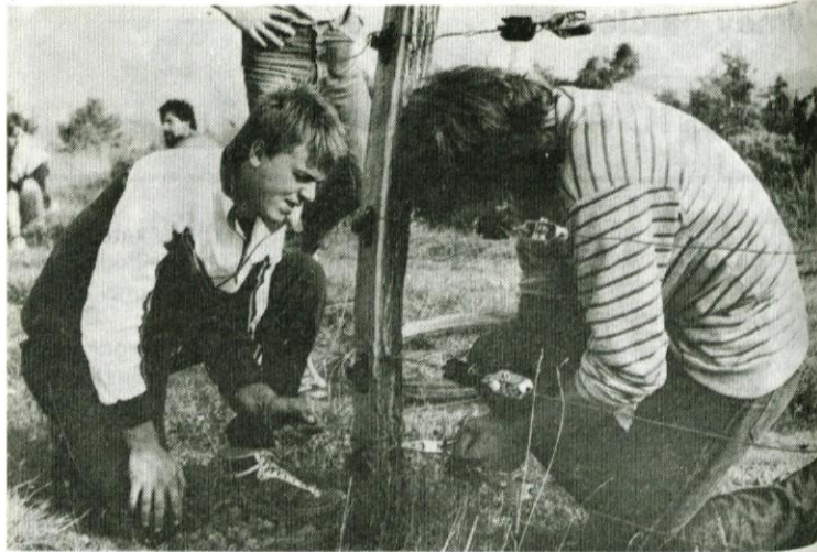
Utrinek z delovišča na MDA Brkini 1985