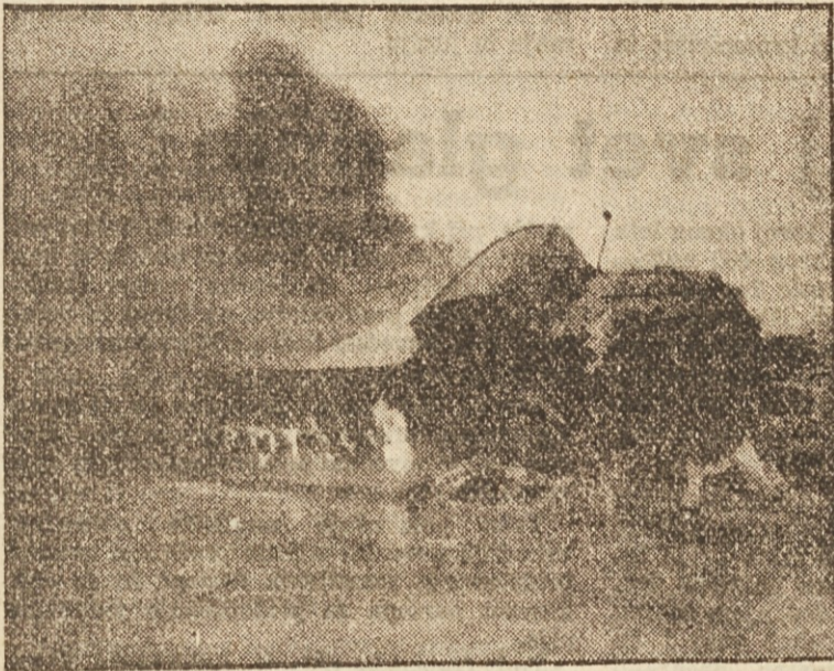
V sveti deželi divjajo boji med Arabci in Judi. Slika kaže v bojih uničen auto.

Ko je umrl Boudwin II. in mu je sledil njegov brat, so mohamedanci vnovič vdrli