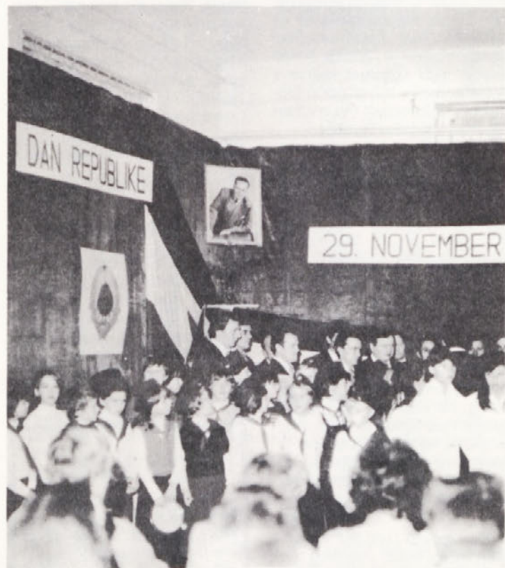
Zadnji delovni dan v novembru so v jedilnici TOZD TPP v sodelovanju s KS in osnovno šolo iz Stopič pripravili proslavo ob DNEVU REPUBLIKE. – Organizatorji iz TOZD TPP so znova dokazali, da je možno z malo dobre volje organizirati lepo proslavo.