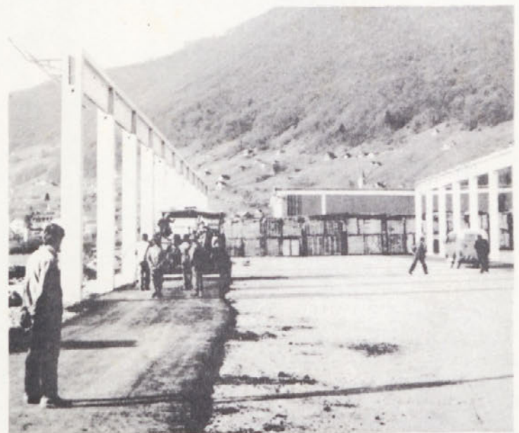
Čeprav „nadstrešnica“, kjer bomo zračno sušili les, še nima strehe, pa so že pričeli polagati asfalt.