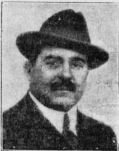
Peter Živković novi predsednik JNS