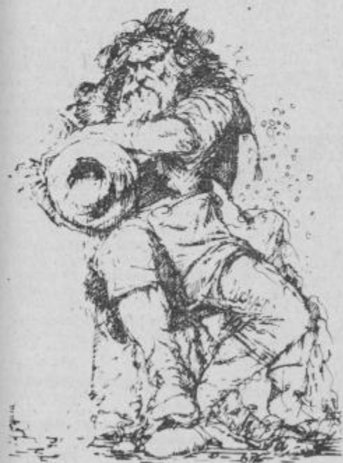
Vinjeta Barda lucundusa.