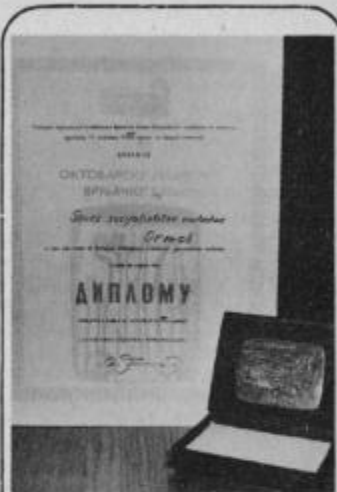
Najvišje priznanje občine Vrnjačka Banja za mladino občine Ormož.

Posebna skupina članov DPD Svoboda Slov. Bistrica, ki so jo sestavljali predvsem mladi občani Slov. Bistrice pa je sodelovala na osrednjih svečanostih v Svetozarevu s posebej v ta namen pripravljenim kulturnim programom. VH