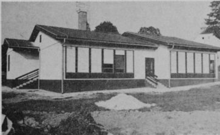
Vrtec z dvema oddelkoma v Makolah

Izgradnje tega, za kraj in okolico nad vse pomembnega objekta, je veljala okoli 200 milijonov SD. Denar so zagotovili občinska skupnost otroškega varstva Slov. Bistrica iz kreditov republiške skupnosti za otroško varstvo, del sredstev v obliki kredita pa je prispeval Marles, ki je vrtec tudi postavil. Gotovo pa se krajanji ne bi veselili te pomembne pridobitve, če zanjo ne bi sami veliko prispevali. Predvsem so prispevali svoj delež v prostovoljnem delu pa tudi materialu, saj so sami opravili vsa dela pri izgradnji temeljev, kanalizacije in ostalih del za blizu 1000 prostovoljnih delavcev. VH