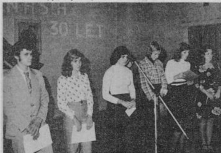
Utrinek s proslave 30-letnice dela OO ZSMS Obrež. Razen recitacij je v programu sodelovala tudi središka godba in obreški folkloristi.