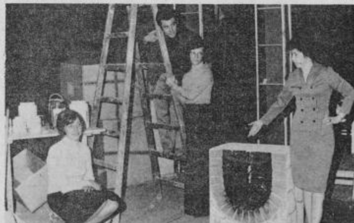
Utrinki z vaje za „Sreča na kredit“