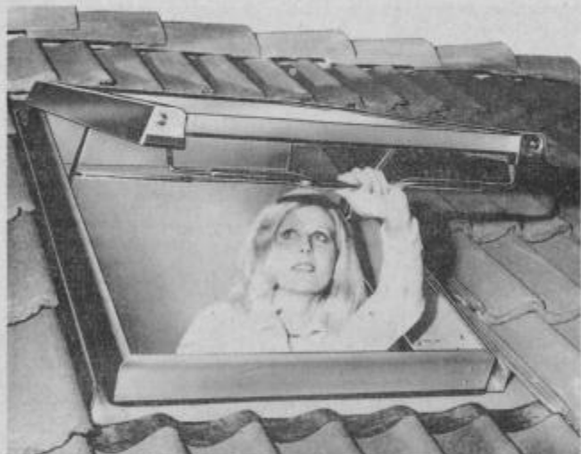
p u r a l stanovanjsko strešno okno