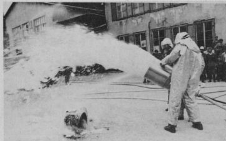
Z zadnjega skupnega nastopa gasilcev IMPOL-a in Steklarne v bistriški TOZD, ob uspešni uporabi aparata za gašenje s peno