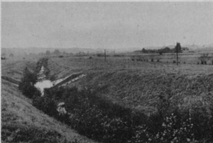
Sejanska dolina — na fotografiji je samo delček — je že preprejena z odvodnimi jarki, ki gospodarsko pomenijo veliko pridobitev. Del doline je tudi že melioriran, velika večina pa še čaka . . .