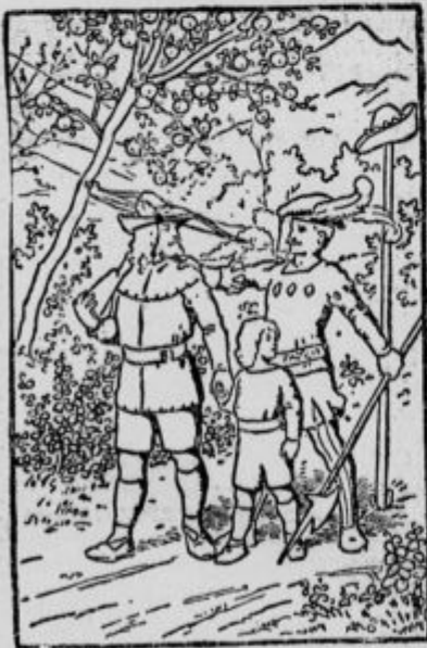
Kje je drugi stražnik?

Življenje zagreni nadležen kašelj , izčrpa moči in oslabi telo. In vendar je mogoče zanesljivo lajšanje in hitra odstranitev kašlja s Thymomel Scillae, lekarnarja B. Fragnerja v Pragi, ki stane 2-20 K steklenica.