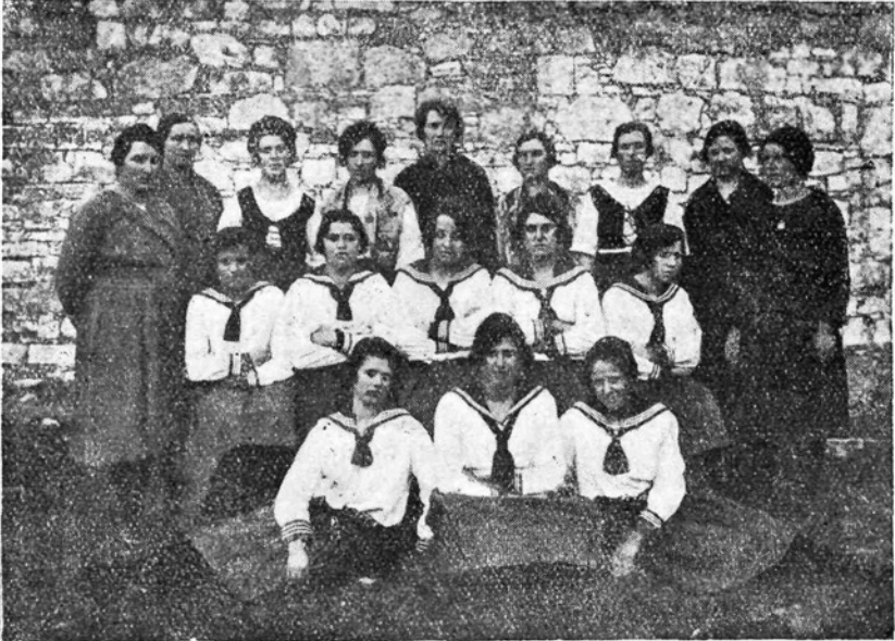
Dekliški krožek v Rifembergu.

Na nekaj ne smem zabiti! Vsako društvo ima svojo knjižnico. Ali se je poslužujejo članice in s kakšnim uspehom? Velikega pomena za razvoj duševnosti in pridobivanje znanja so edino knjige, a le dobre