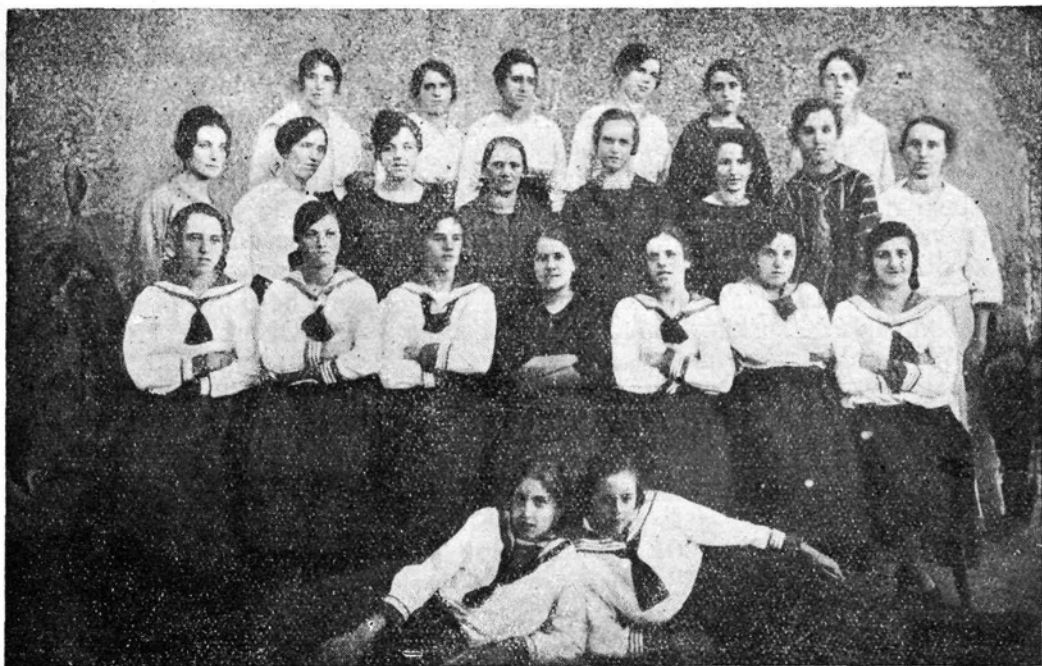
Dekliški krožek v Vrhopolju.

Isti prizor po društvih! Povsod je pomlad, povsod mladostno življenje in ko bi ne vela burja kulturne brezpravnosti, bi pognali po naših svežih organizacijah cvetovi, ki bi jih zavidal svet. Pa je bolje za cvetove in društva, da nimajo preveč in prezgodnjega solnca, sicer prehitro ovenejo in vsak mrazek jih uniči. V borbi je življenje.