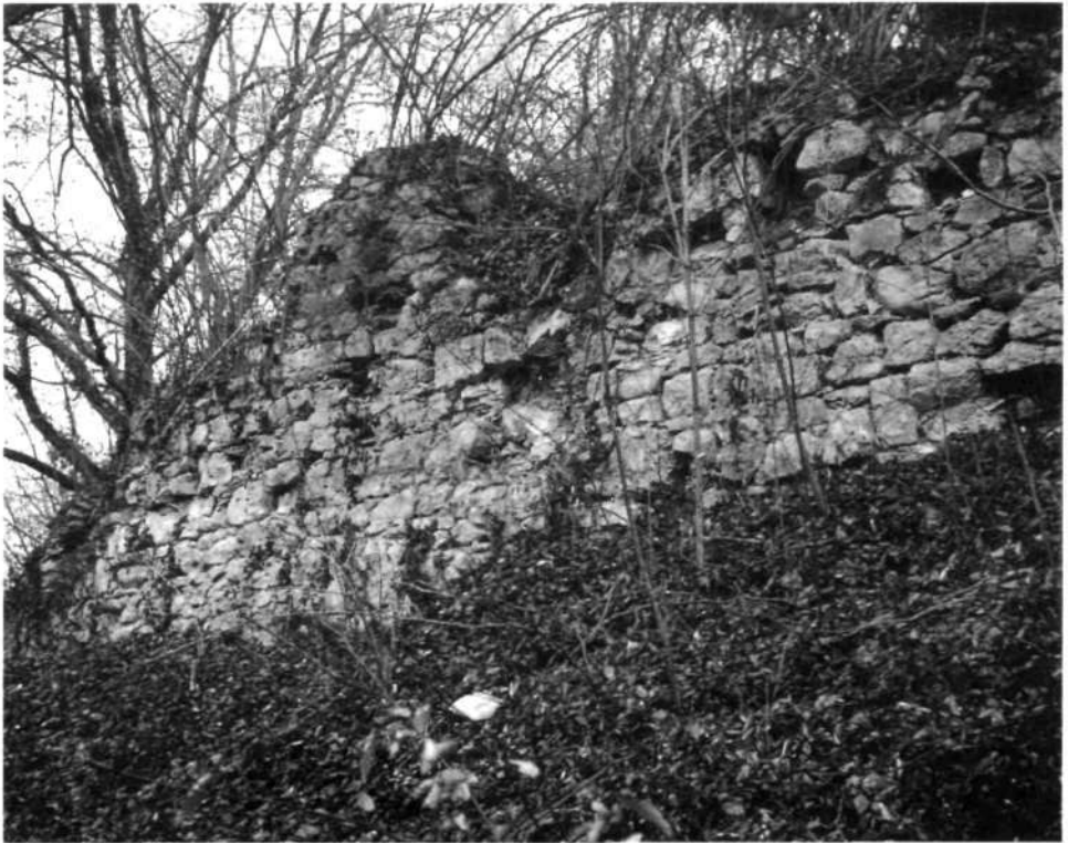
Na pobočju proti Radulji so še sledi zunanjega zidu nekdanjega mogočnega lepotca dolenjske freisinške posesti (foto Florjančič, jesen 1997)

Nemci so med okupacijo Antonu Ulmu obljubili ustrezno imetje v rajhu, če se izseli iz banditskega ozemlja. Leta 1942 so partizani požgali grad, ki je bil nato prepuščen propadu in odnašanju gradbenega materiala.