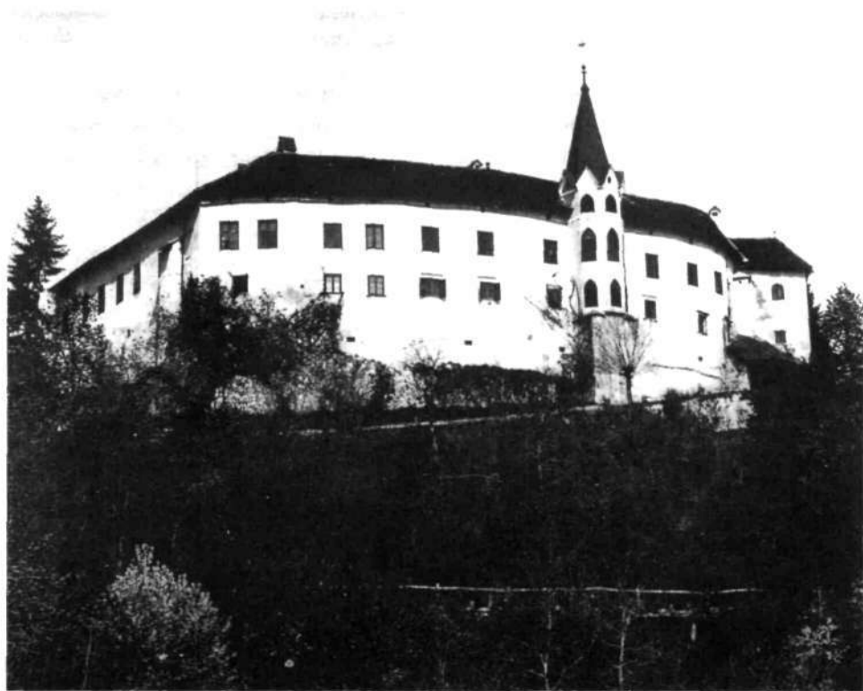
Slika z razglednice pred drugo svetovno vojno prikazuje grad, ko so bili njegovi lastniki Ulmi

Leta 1693 je Klevevž kupil cistercijanski samostan v Stični, ki ga je nato leta 1719 prodal sestrski opatiji v Kostanjevici za 43.000 goldinarjev. Po jožefinskih reformah konec 18. stoletja je klevevško gospodarstvo prešlo v verski zaklad. Leta 1807