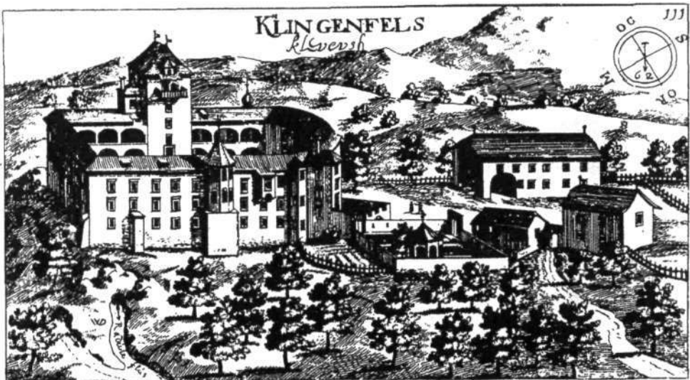
Tak je bil približno klevevski grad, ko je prešel iz freisinških rok k Mosconom (po Topographia Ducatus Carniolae Modernae , J. W. Valvasor, Wagensperg, 1679)