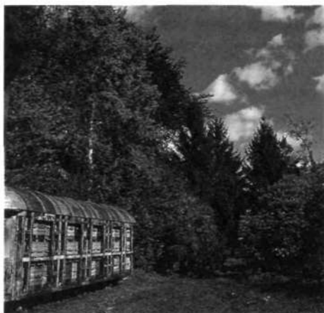
Takašno je nekdanje grajsko notranje dvorišče danes (foto Florjančič, junij 1998)