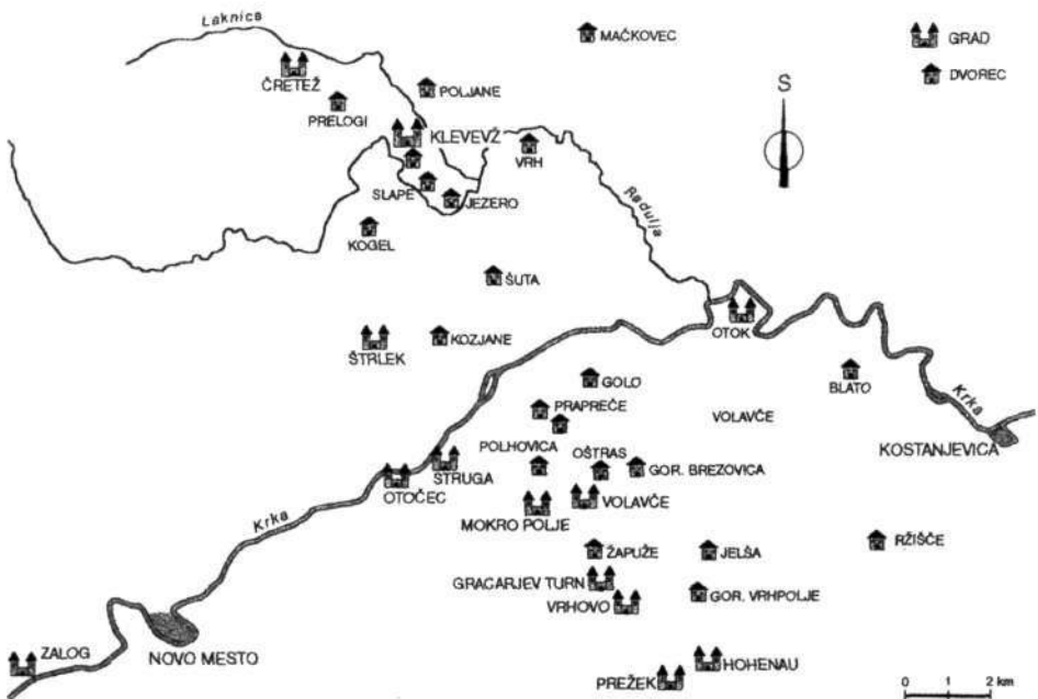
Gradovi in dvorci v območju klevčevega gospostva (prirejeno po Blazniku)

Oblikovanje freisinške posesti na Dolenjskem v začetku 11. stoletja moramo gledati v luči obnove po uničujočih madžarskih vpadih sesutega karolinškega rimsko-nemškega cesarstva v drugi polovici 10. stoletja. »Med novostmi, ki jih je prinesel takratni čas, so bile mejne grofije temeljne teritorialne enote, v katere je bil orga-