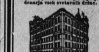
Podružnica v Pittsburghu: 600 SMITHFIELD STREET, PITTSBURGH, PA.