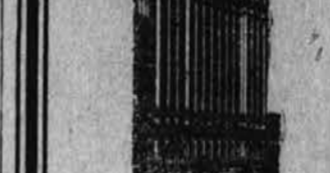
Podružnica: 11 BROADWAY, NEW YORK, katera se prda samo z prodajanjem denarja vseh svetovnih držav.