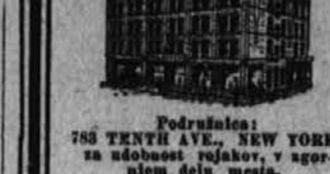
Podružnica: 783 TENTH AVE., NEW YORK, za udobnost rojakov, v agenciji dela mesia.