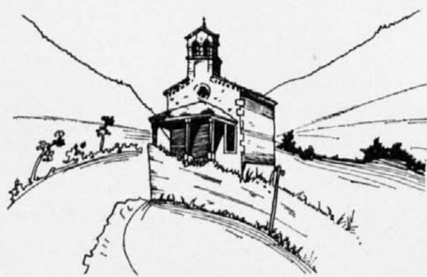
GOSTILNA SIRK »PRI LOVCU« Subida - Krmin

Brestovica - Sesljan - Ronke - Buenos Aires, 29. decembra 1976