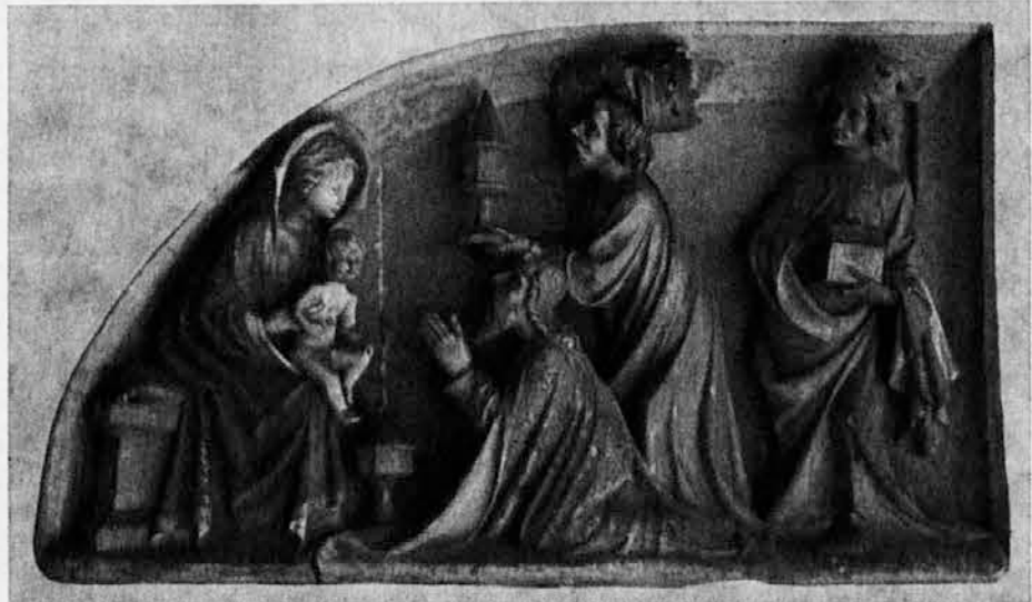
Sv. Trije kralji pred novorojenim Detetom. Slika je nastala okrog leta 1415 in se hrani v svetišču na Ptujski gori