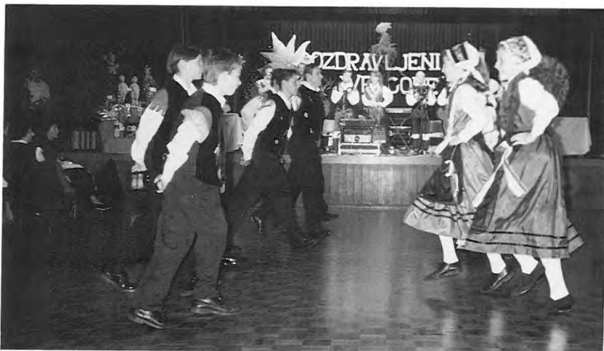
Folklorna skupina pozdravlja "Show Ekart"