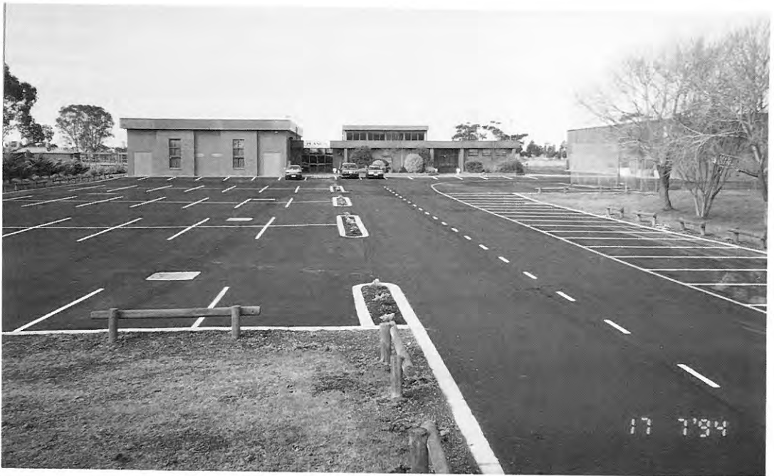
Novi obraz "Planice"...