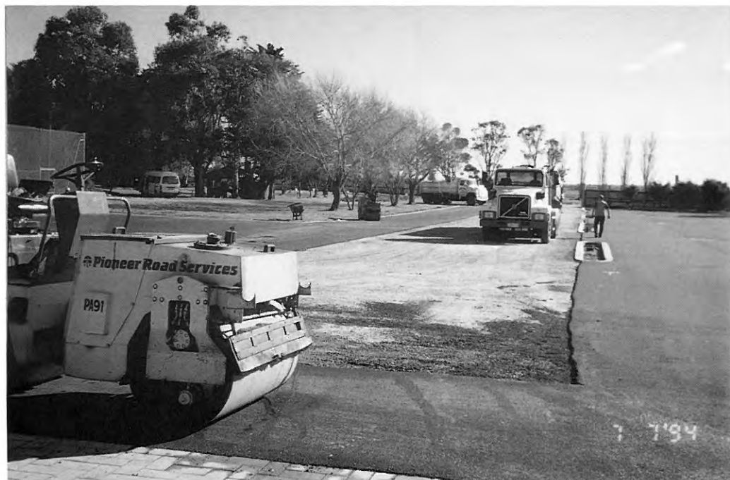
Polovica dela že končana ...