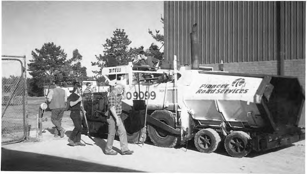
Fantje - še malo, pa bo konec ...