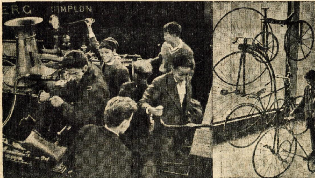
Visoka šola javnega prometa je prometni muzej v Luzernu (Švica), kjer se zlasti mladina lahko tudi seznanja z vsem, kar je v zvezi s prometom v preteklosti in sedanosti. Na prvi sliki vidite ogled lokomotive iz leta 1858, ki omogoča zelo nazoren pouk. Na drugi strani pa so razstavljena kolesa — najstarejše iz leta 1817 in tvorijo nekako surrealistično sliko iz preteklega časa

»Saj.« Ana je hitela razgrinjati prevleke za blazine in ob sveči občudovati čipkaste vložke. »Poglej,« je rekla in mu pomolila prevleko z drobno izvezenim vzorcem, »to sem delala, ko sem bila še v samostanski šoli.«