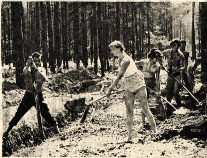
Tudi šibke roke brigadirjev niso kar tako...

va. Najbolj je razgibano športno in kulturno življenje. Imeli smo kulturni večer, na katerem se je posebej izkazal naš mali »Bine«, ki nas je zabaval dobro uro. Imeli smo medčeta