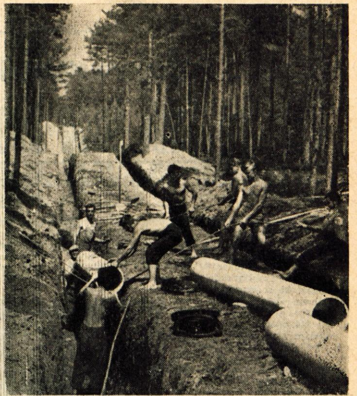
BRIGADIRJI NA SUHI POLAGAJO CEVI ZA VODOVODNO OMREŽJE