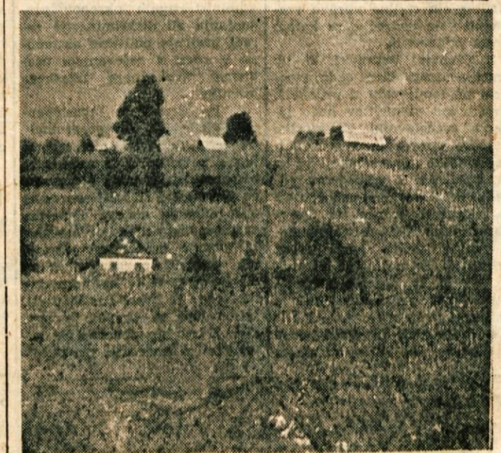
Na Dolenjskem, Belokranjskem že grozdje zori...

Ljudje se sprašujejo, zakaj ni za take nepoboljšljive, ki kot nekdanji pomagači okupatorja rovarijo in kalijo javni red, ostrejših kazni. M. L.