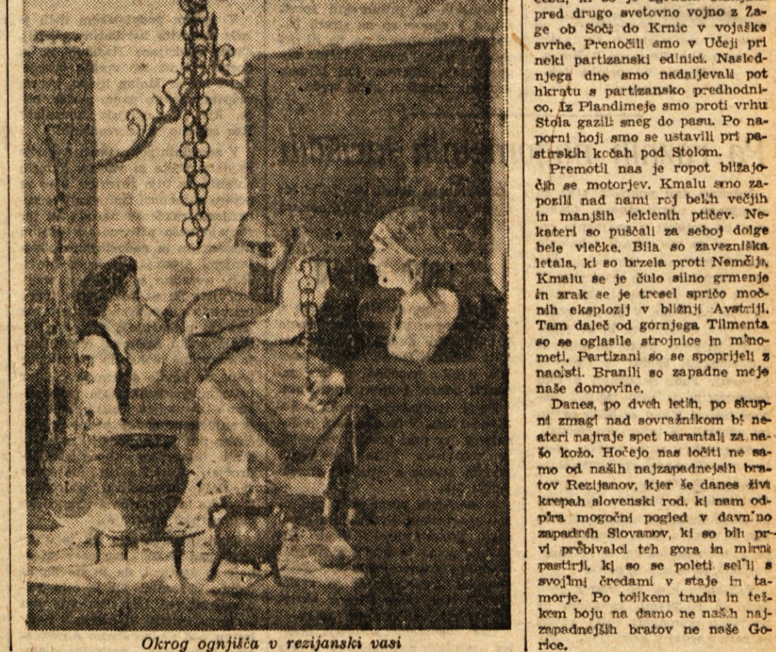
Okrog ognjišta v rezijanski vasi