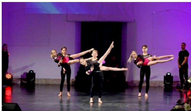
Člani Gimnastičnega društva GIA Ptuj