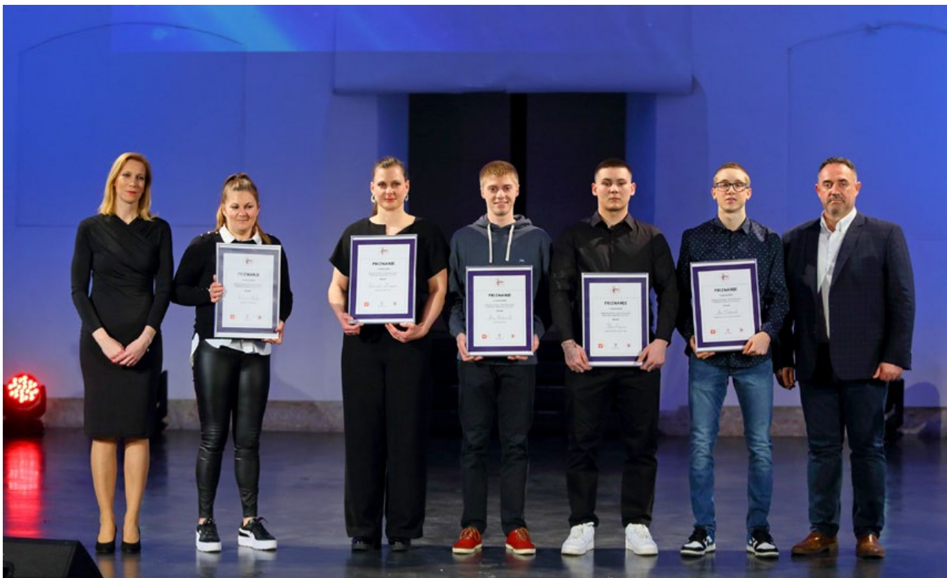
Državni prvak v individualnih športnih panogah leta 2023