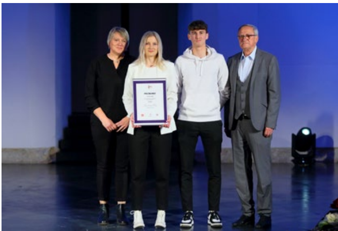
Najuspešnejša srednja šola za leto 2023 je Gimnazija Ptuj.