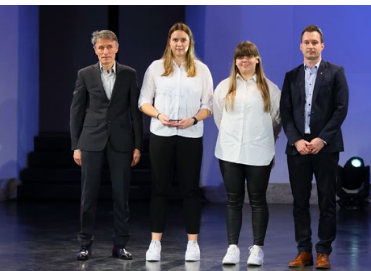
Najboljša ženska ekipa je ekipa Ženskega rokometnega kluba Žiher hiše Ptuj - Ormož.

Najboljša moška ekipa je ekipa Strelskega kluba Ptuj. Klub je v sezoni 2022/2023 osvojil drugo mesto v 1. A državni strelski ligi