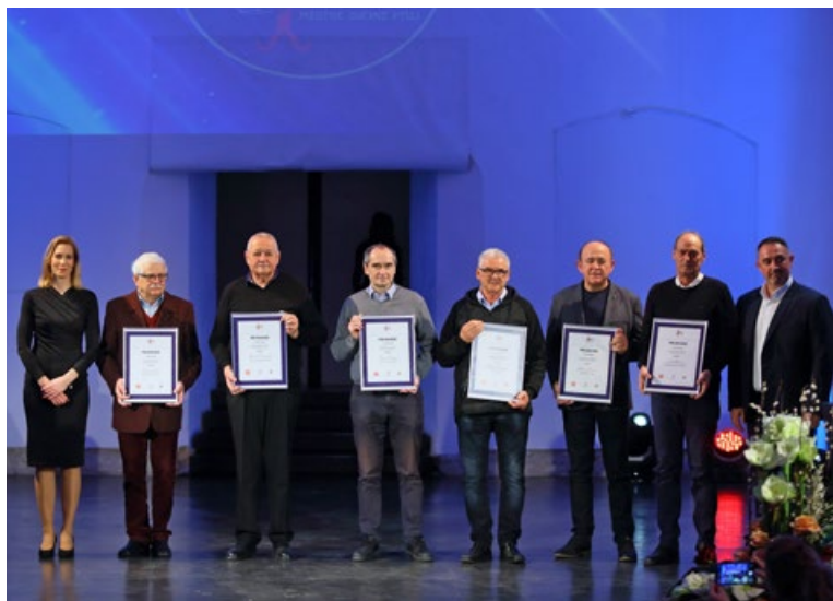
Najzaslužnejši športni delavci