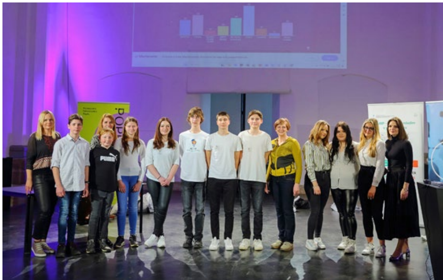
Zmagovalci 2024. Od leve ekipa Zeko, OŠ Ormož, ekipa Učitek, OŠ Olge Meglič, in ekipa Music holder, ŠC Ptuj.

V četrtek, 22. februarja, se je v veliki dvorani Dominikanskega samostana na Ptujju odvijala že tradicionalna prireditev Podjetniški izziv za mlade, ki je tekmovalni izbor najboljših podjetniških idej osnovnošolcev in srednješolcev s Ptujja in okolice.