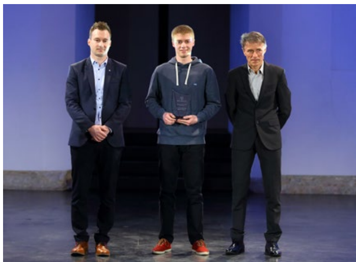
Najboljša moška ekipa je ekipa Strelskega kluba Ptuj.