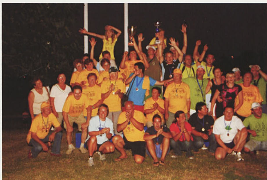
Zmagovalna ekipa VO Gorišnica

Prireditve je spremljalo veliko število gledalcev, ki so v izjemno vročem poletnem dnevu ustvarili zelo prijetno vzdušje. Z olimpijado smo bili zadovoljni, saj je pomenila dan druženja, rekreacije in tako pokazala smiselnost takšnih prireditev.