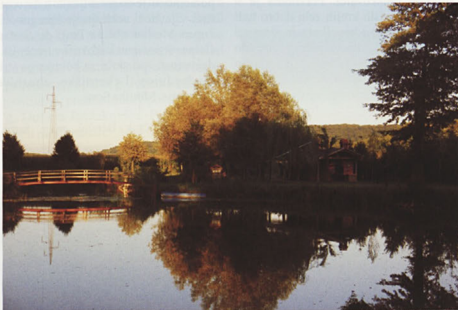
Lepo urejeni ribniki so vsem nam v ponos