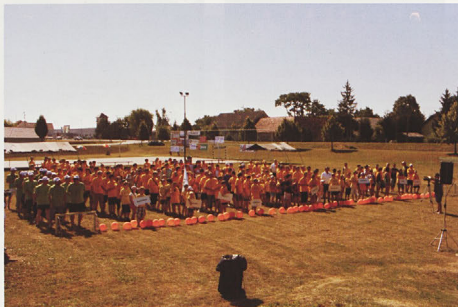
Množična udeležba na vaški olimpijadi v Moškanjcih