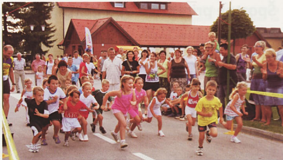
Tudi najmlajšim ni manjkalo tekmovalnega duha