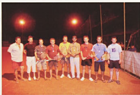
Zmagovalci teniškega turnirja