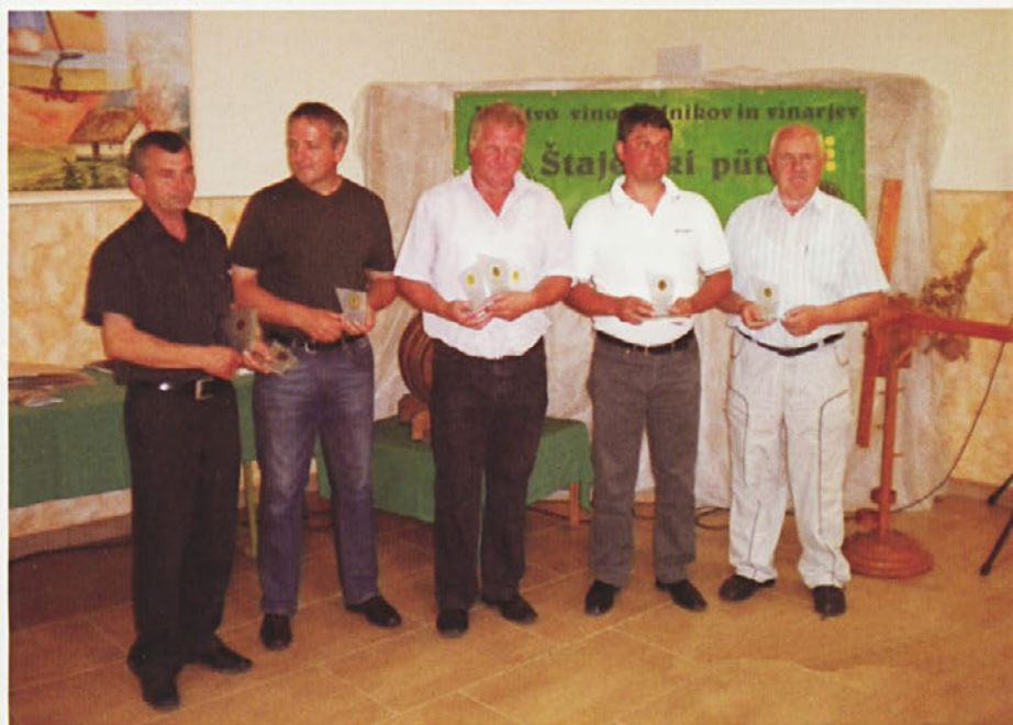
Šampioni pütarskega praznika

Za nemoten potek in serviranja vina komisiji je odlično poskrbela 6-članska ekipa, tako, da je delo potekalo v ustreznih pogojih. Presledki med ocenjevanjem so bili