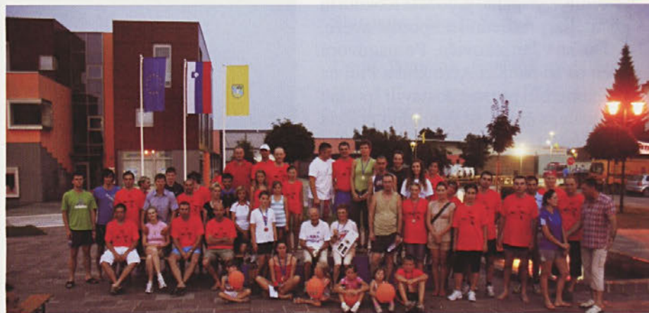
Vsi, ki so pretekli in prehodili progo v hudi vročini, so zmagovalci