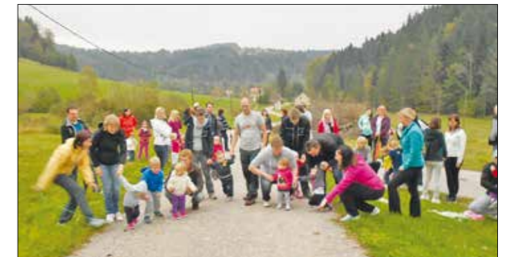
Start krova v Podkoglju v kategoriji najmlajših