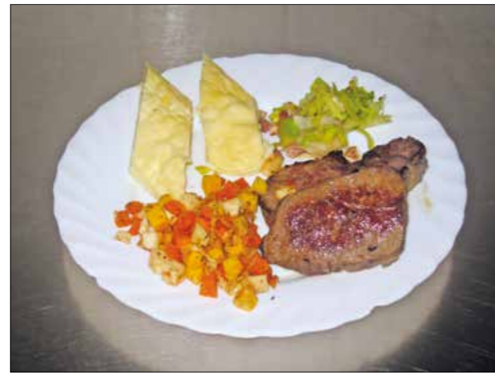
Velikolaška govedina, sirovi štruklji in zelenjavna priloga – slovenska kulinarčna ponudba.