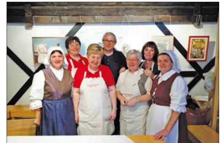
Nagrajenec v družbi Društva podeželskih žena, ki so poskrbele za slastno pogostitev