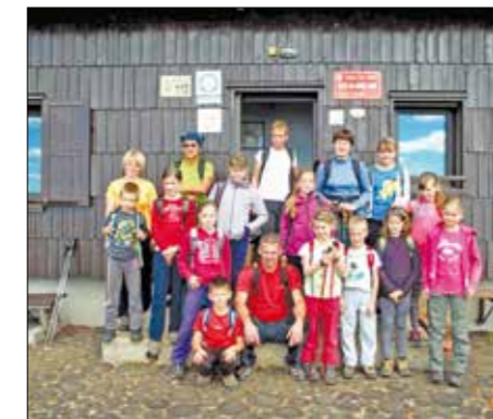
Na kriški gori pri koči