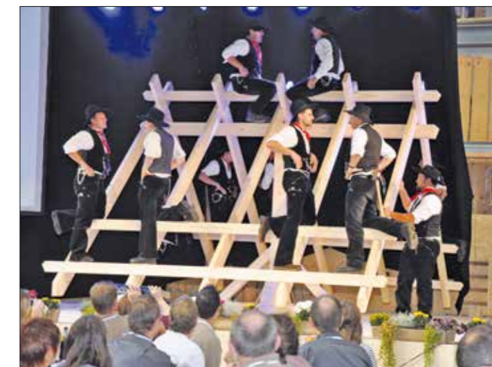
Star običaj švicarskih tesarjev, imenovan Zimmermans-Klatsch. Pred gledalci so z veliko hitrostjo sestavili leseno ostrešje, ki se je vrtelo okoli svoje osi.

Geslo letošnje razstave je bilo Mitenang – Skupaj. Na razstavi se je predstavilo 99 razstavljalcev. Svoji razstavni prostor je dobila tudi naša občina Velike Lašče.