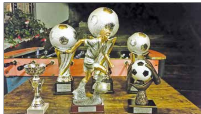
Pokali za najboljše v letošnji sezoni