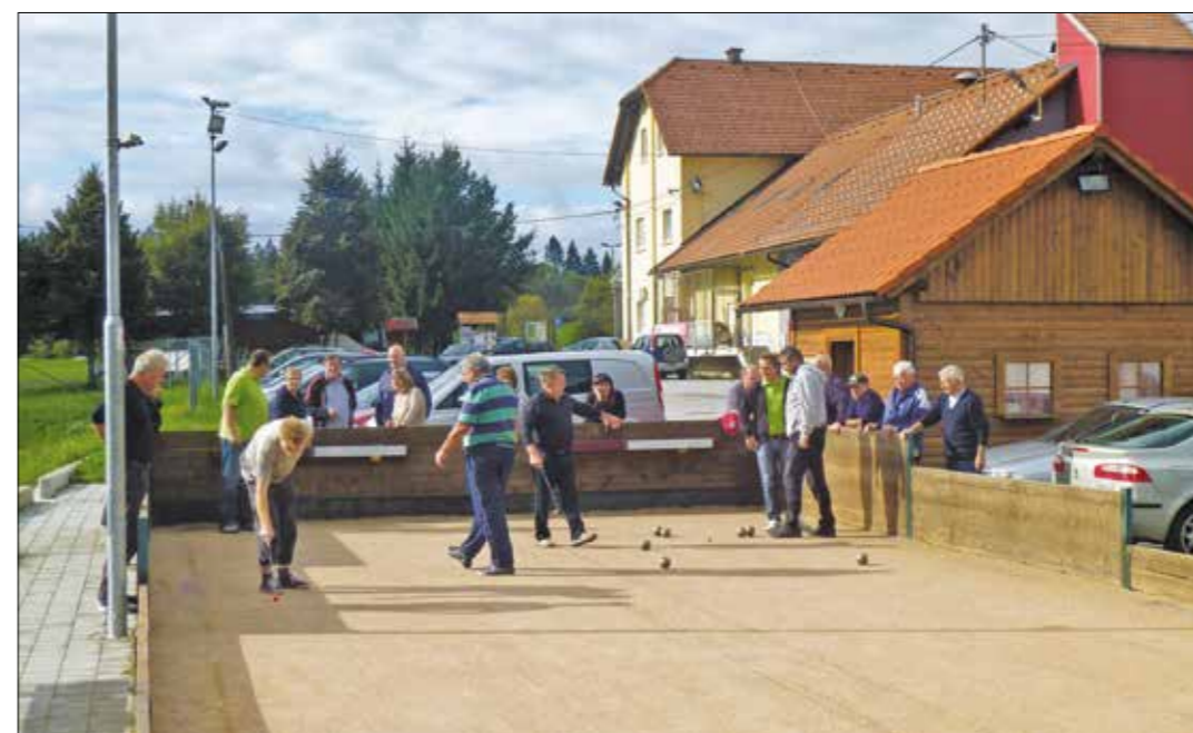
Tekmovalo se je na obeh baliniščih