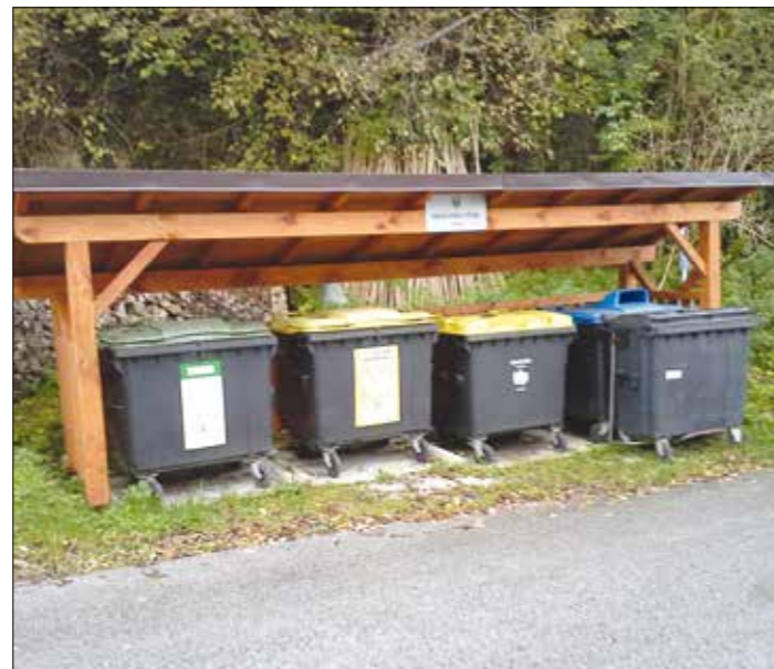
Pod gradom Turjak