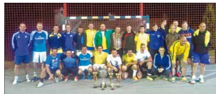
Skupinska slika igralcev najboljših treh ekip

Pripravil: Aleš Pirman, KMN Velike Lašče