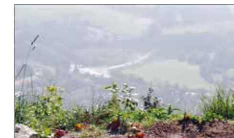
Pogled z vrha na koncu

pojedel sendviče, ki smo jih dobili v šoli. Na vrhu je bilo kakor v nebesih, saj so oblaki prekrivali Ljubljansko kotlino. Potem so se oblaki malo razmaknili, da smo vsaj malo videli dolino pod seboj. Na poti navzdol smo pozvonili na zvon želja ter si nekaj