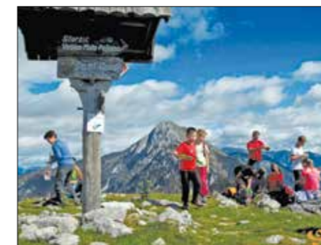
Na Tolstem vrhu