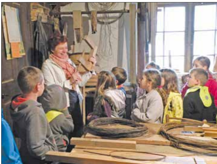
V mizarski delavnici