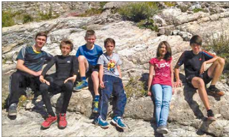
Vseh šest tekmovalec v gorskem okolju

Drugo atlesko tekmovanje je bil kros v Loškem Potoku , in sicer v petek, 3. 10. 2014. Tega krosa se udeležujemo že več let in smo večinoma zelo uspešni. A tako velike bere medalj kot letos še nismo imeli. Kar 14 učencev je domov prišlo z medaljo okrog vratu. Sicer pa je bila konkurenca precej močna, sodelovali so učenci 8 (pretežno okoliških) šol.