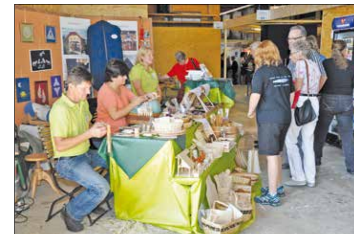
Stojnica s suho robo. Ročnega izdelovanja zobotrebcev v Švici ne poznajo.