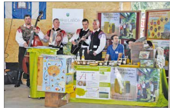
Ansambel Krpani in čebelji pridelki predstavnikov Čebelarskega društva Velike Lašče.