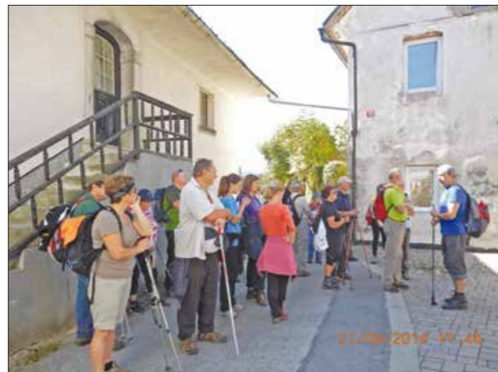
V starem delu Rašice