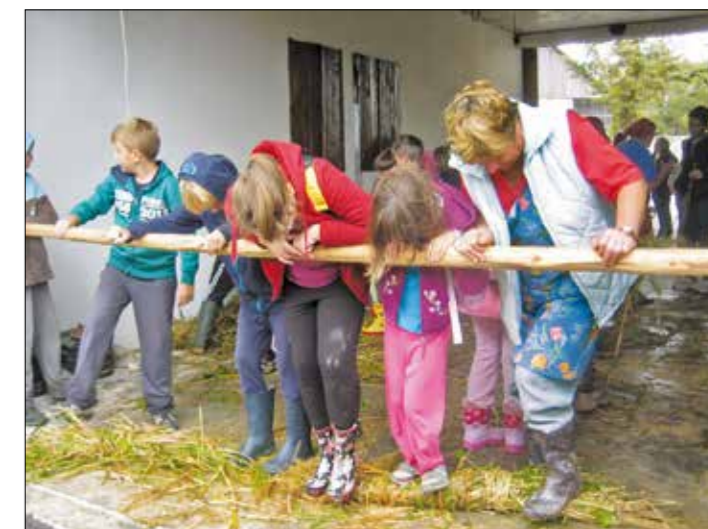
Hitro so se naučili ...