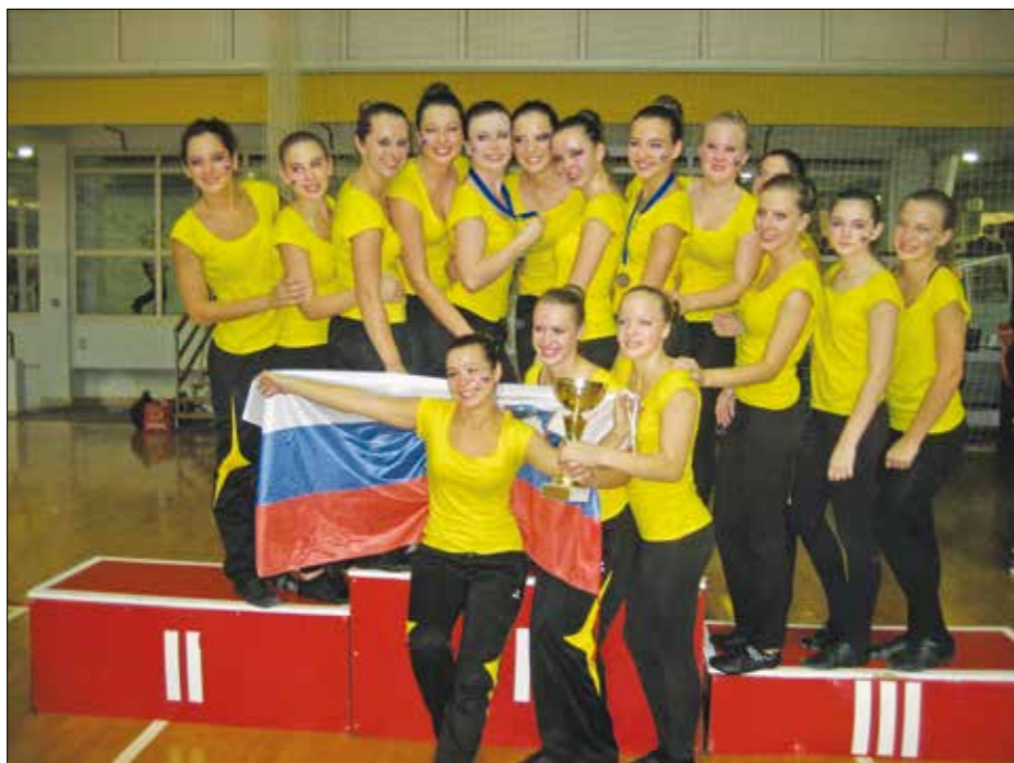
Vesetje ob sanjskem dosežku