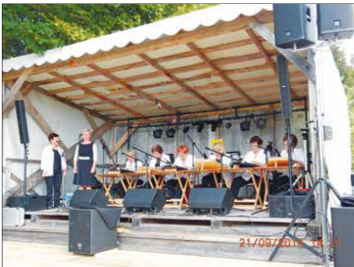
Nastopajoče Strune mile