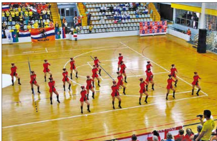
Z odločni koraki v nastopu "Vojaki" so ribniške seniorke prikoralale na 3. mesto.