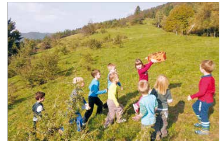
Na cilju, visoko nad Karlovico, smo našli zaklad.