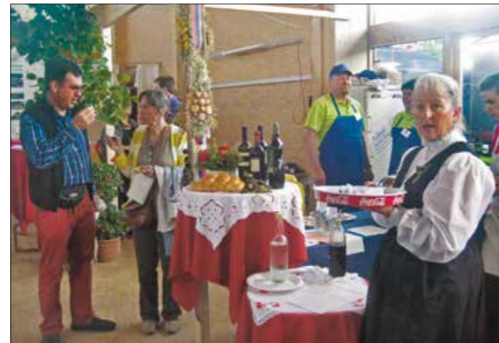
Prijazno ponujen kozarček je le redko kdo odklonil.