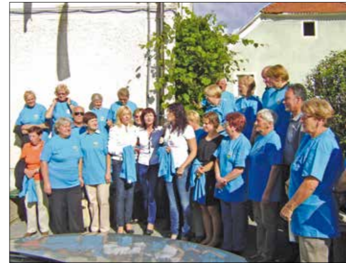
Pred Glasbeno šolo

Na dan demence 21. septembra je bila po vsej Sloveniji akcija združenja Spominčica „Sprehodimo se po domačem kraju“. Tudi Društvo upokojencev Velike Lašče je organiziralo s pomočjo Spominčice in Občine Velike Lašče tako akcijo. Svoje člane je popeljalo na sprehod po Velikih Laščah.