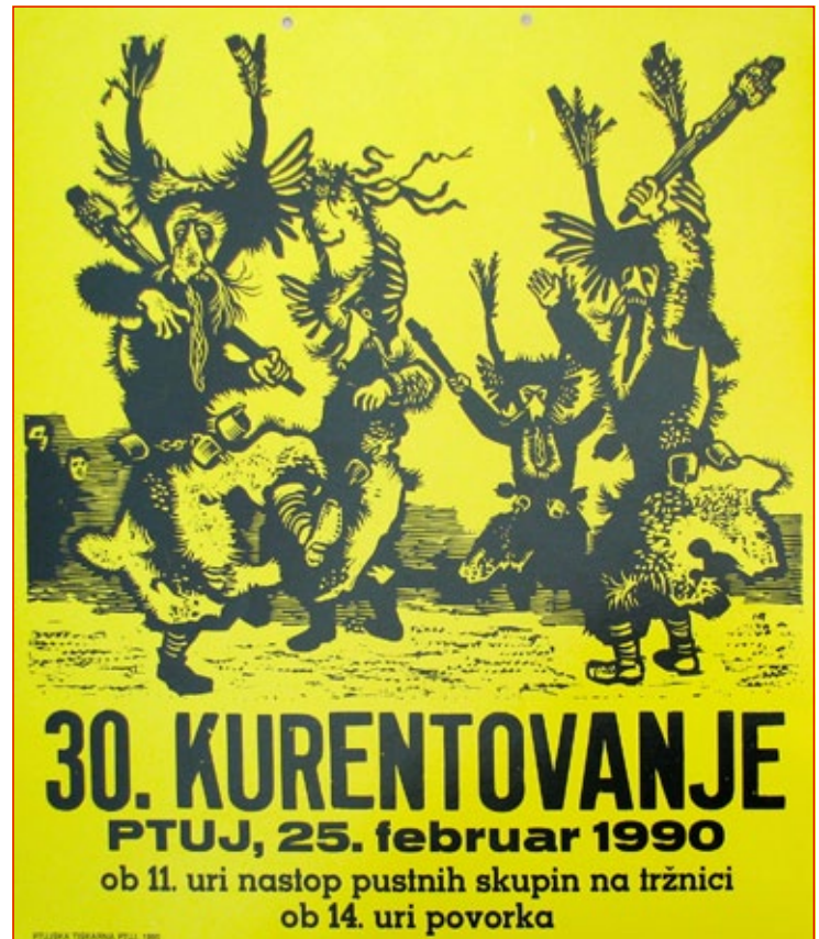
Plakat iz leta 1990

Izhodišče modernemu pustovanju in polet pustnim in karnevalskim prireditvam na Ptuj je dalo okrepljeno meščanstvo 19. stoletja, razvoj mesta in nastanek raznih društev. Številna so kar tekmovala med seboj, katero bo imelo bolj iz-