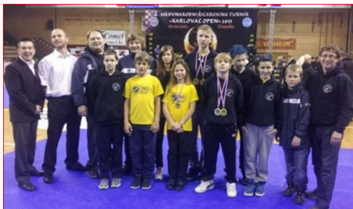
Ptujčani v Karlovcu