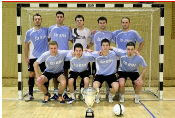
Nogometiši ŠD Rim – zmagovalna ekipa zimske lige malega nogometa.

V okviru športno-humanitarne prireditve so v revijalnih tekmah sodelovale ekipe Football club Ptuj, Kenguru, Makole, Hajdoše, Podlehnik, Hajdina, Ormož, Markovci, Središče ob Dravi, Bukovci, Videm, Drava, Podvinci, Ge-