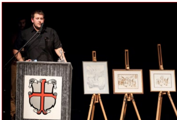
Člani Leo kluba Ptuj so tudi tokrat s pomočjo likovne kolonije zbirali denar za dobrodelne namene.

umetnikov pa tudi dela že uveljavljenih in tako zbirali denar za nakup elektronske lupe za slabovidnega učenca 9. razreda osnovne šole na Grajeni. Lupa omogoča