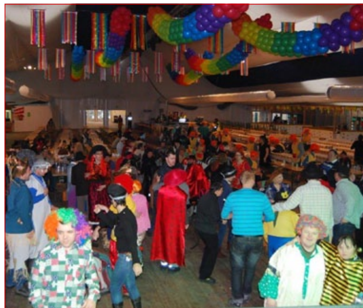
Veselo pustno rajanje uporabnikov sodelujočih invalidskih in humanitarnih organizacij.

že četrto leto zapored potekalo tradicionalno družabno pustno sreča-