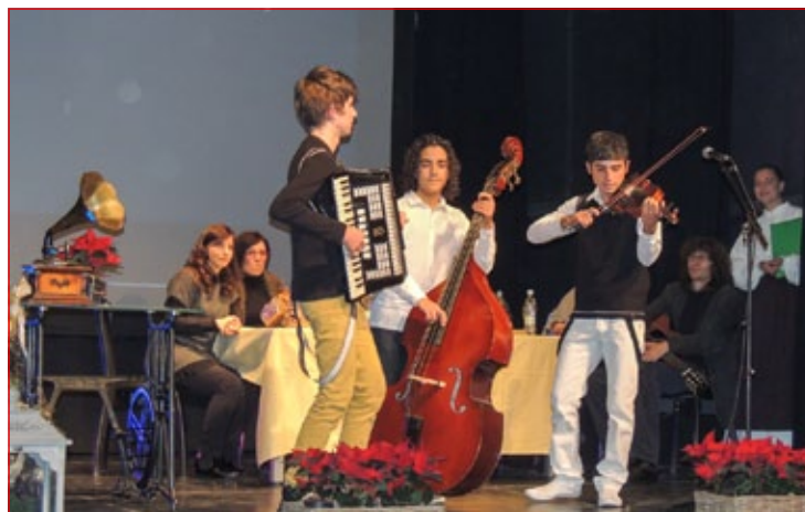
Glasbena skupina prekmurske romske skupnosti, Mlada Langa