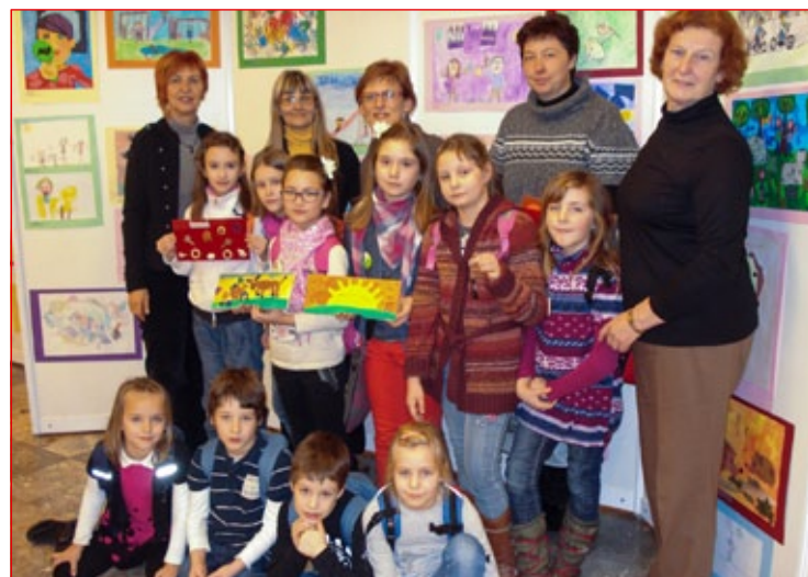
Nagrajeni učenci z mentoricami

Učenci prvega, drugega in tretjega razreda OŠ Mladika Ptuj smo likovno ustvarjali za 6. mednarodni kulturno likovni natečaj Igraj se z