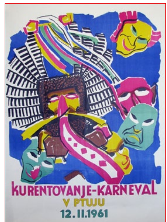
Plakat iz leta 1961

kov, škofov in nun, je to pri Cerkvi sprožilo velik val negotovanja; duhovščina in škof iz Maribora so se pritožili pri političnem uradu. Vsi udeleženci so bili kaznovani in vsak je moral plačati 25 goldinarjev kazni, kar je bila visoka kazen za malo zabave v enem popoldnevu. Ptujski kronist je zapisal: »... in zato bo najbrž to tudi zadnja povorka in s tem za vedno