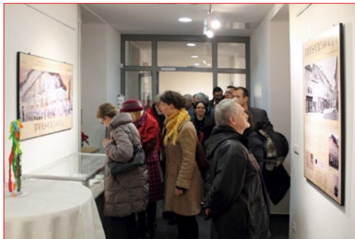
V Zgodovinskem arhivu na Ptuju lahko na razstavi z naslovom Drobci iz zgodovine posameznih hiš in njihovih lastnikov v Prešernovi ulici na Ptuju spoznate zgodovino 16 hiš.

Večji del podatkov sta našla v Zgodovinskem arhivu Ptuj, nekaj pa še v Štajerskem deželnem arhi-