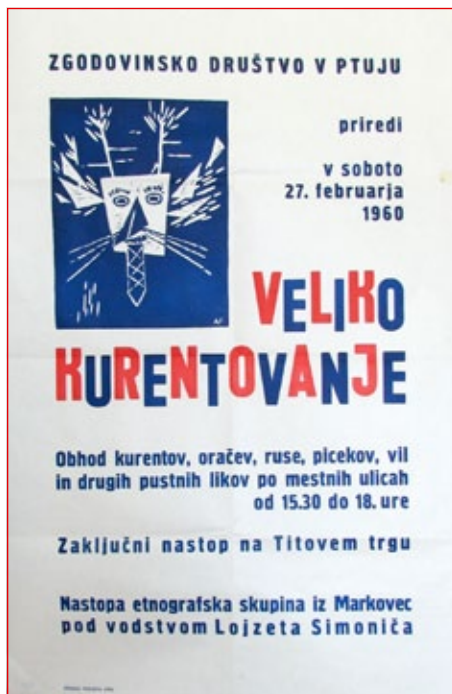
Plakat iz leta 1960

voščili. Tudi te je starojugoslovska oblast želela ukiniti. Pa se je kurentom uspelo mimo mitnice pod kupom slame na vozu pretihotapili v mesto in meščanom predati svoje pogansko sporočilo.