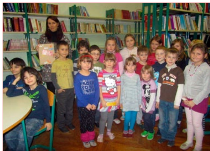
Na Pravljicni čajanki so otroci z zanimanjem prisluhnilo pravljici ter se posladkali s piškoti in okusnim čajem.

ima vsak razred svojo gredico, za katero mora skrbeti.