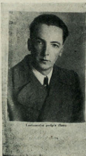
Jože Šeško se je pred sovražniki skrival tudi z ilegalnimi imeni. Na tej izkaznici se je »pisal« Sila Ivan

Uspeh je tudi vključiti v vse masovne organizacije na Kočevskem, večkrat tudi na vodilne položaje, člane in simpatizerje Komunistične partije.