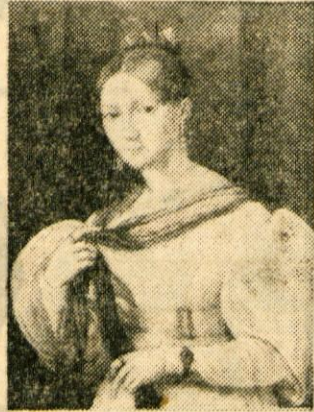
Doba Primčeve Julije

Razočaran zve na Dunaju, d a je že prestar za sprejem na akademijo. Vendar so mu dovolili, da se je kot izredni študent udeleževal pouka. To mu je omogočil naš slavni ro-