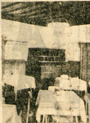
Prijetno urejena notranjost

Marsikaj se je izpremenilo, a ostal je čisti gorski zrak, ostale so večne mogočne gore nad temnim jezerom, ostal je starinski grad, ostala je