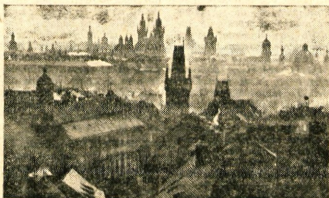
Pogled na Prago s Hradčanov

Obiskovalci pa ne fotografirajo samo mostu, temveč tudi novo zanimivost — galebe in vse mogoče vodne ptice od labodov do rac. Tisoči teh letečih prebivalcev daljnih severnih vod letajo ob obali Vltave. Postala jim je prijetna dom, kakor je tudi Praga prijeten dom mnogim Čehom.