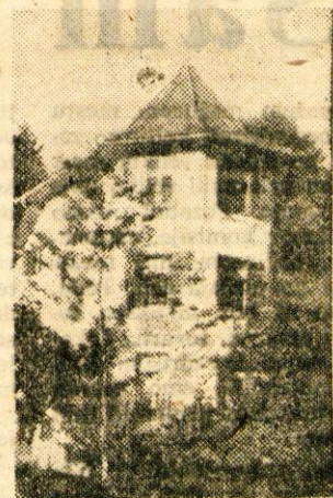
Pogled na del gradu

V letošnji sezoni so že začeli prihajati prvi gostje. Z agencijo Hotel Plan iz Holandije so sklenjene pogodbe za 45 ležišč za 155 dni. Vsakih 14 dni se menjajo skupine. Posamezne domače in tuje agen-