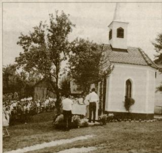
Na blagoslovu prenovljene Žmavčeve kapele se je zbralo več kot 150 domačinov.