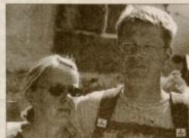
Frid in Bakley iz Nemčije

"Podatke o Sloveniji sva dobila na razstavišču Expo 2000 v Hannoveru. Odločila sva se, da prideva v Slovenijo za dva tedna, na Ptuj bova ostala tri dni. Sposodila sva si kolesi, tako da sva si že ogledala okolico Or-