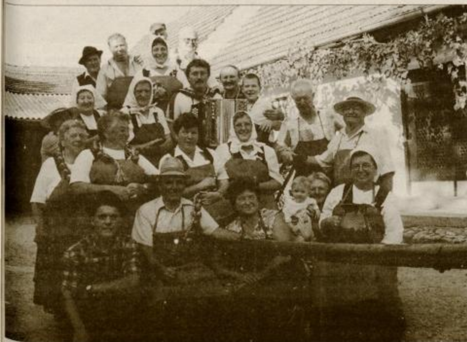
Dornavski lukarji so pripravljani za osrednjo prireditiv

SPODNJA POLSKAVA / SPODNJEPOLSKAVSKO POLETJE 2000