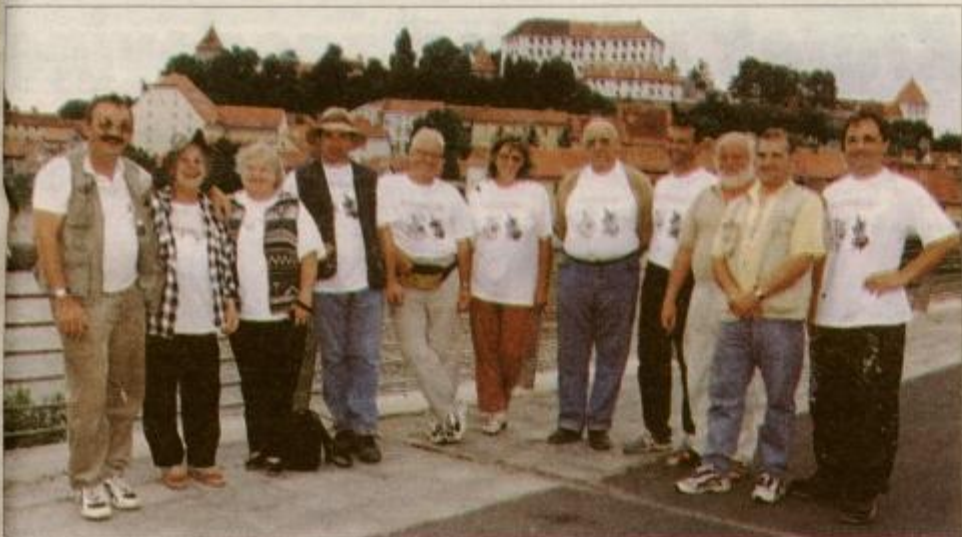
Udeleženci slikarske kolonije Ptuj-Bled pred svojim najljubšim motivom, veduto Ptuja.

Po prvem delu blejskega likovnega srečanju konec julija, ki se je končalo z blejskimi koncertnimi večeri in razstavo prvega dela slikarskih del v festivalni dvorani na Bledu, je od petka, 4., do nedelje, 6. avgusta, v Ptuj potekal drugi del slikarske kolonije Ptuj-Bled 2000, na kateri je na ptujskih ulicah in v bližnji okolici ustvarjalo 14 slikarjev, po sedem z Bleda in iz Ptuja.