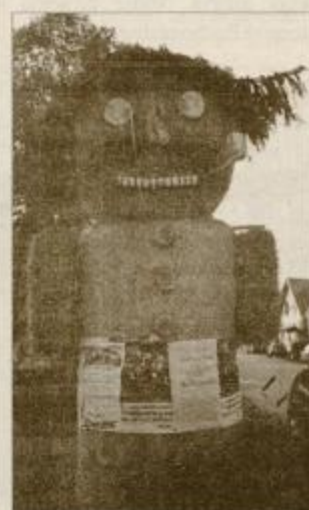
Slamnati možic vabi na prireditve.