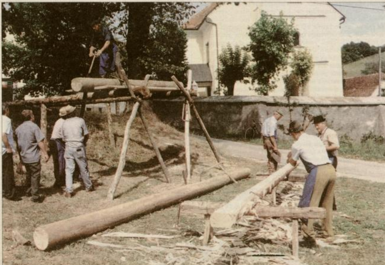
Nekoč zares, tokrat pa le na petem kmečkem prazniku v haloškem Leskovcu.