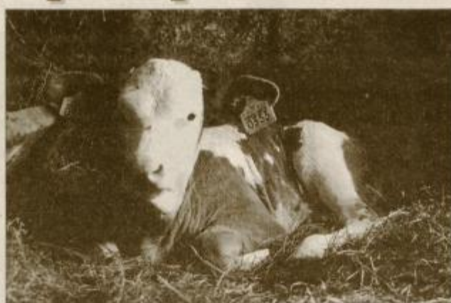
Pravilno označena žival

V zadnjih nekaj letih smo bili priča nekaterim aferam, ki so bile bolj ali manj neposredno povezane s kmetijsko pridelavo na območju Evropske unije. Če se spomnimo samo bolj odmevnih: v Avstriji so pred več kot desetletjem pridobivali vino s pomočjo sredstva proti zamrzovanju; zadnja odmevnejša manipulacija z živili živalskega izvora so odkrili v letošnjem letu v Italiji, povezano s pridobivanjem masla iz maščob, ki niso imele niti daljne povezave z mlekom; pred tem smo doživeli biotinsko afero v Belgiji; devdeseta leta pa je najbolj zaznamovalo odkritje bolezni goveda, posledice katere še vedno čutijo kmetje v mnogih evropskih državah. Govorimo seveda o bolezni BSE (bovina spongiformna encefalopatija), s popularnim imenom bolezen norih krav. Posledica vseh teh dogodkov je strah potrošnika pred novimi in novimi manipulacijami, ki so zdravju škodljive ali celo smrtno nevarne.