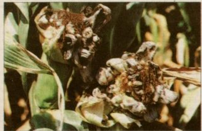
Bulava snet na od suše prizadeti koruzi

Potem ko si je narava nekoliko opomogla od dolgotrajne pomladne in zgodnje poletne suše, so se za lastnike koruznih posevkov začele nove težave. Koruzišča je v velikem obsegu napadla glivična bolezen, imenovana bulava snet, ki jo kmetovalci sicer poznajo, vendar se doslej še ni pojavila v takšnem obsegu.