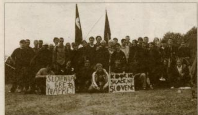
Slovenski udeleženci festivala na Švedskem