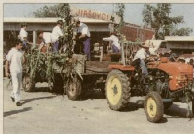
Predstavitve posameznih destrniških vasi je uspela

Na Destrniku so konec tedna uspešno izpeljali tradicionalni kmečki praznik, že devetnajstič. Prireditvi naklonjeno vreme je kljub visokim temperaturam privabilo številne obiskovalce od blizu in daleč. Turistično društvo Destrnik je prikaz starih kmečkih opravil, obrti in orodij letos združilo v povorko z več kot 200 nastopajočimi.