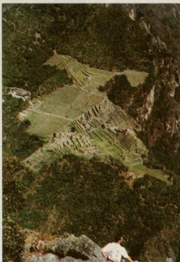
Z vrha Huayna Pichu se vidi, da je Machu Pichu v obliki kondorja

Trekking, ki ga nisem planiral, se je izkazal za enega vrhuncev potovanja. Pomagal mi je pri spoznavanju ljudi in sprejemanju delčkov inkovske resnice. Vsekakor je bil več kot le navaden štiridnevni izlet. Označil sem ga kot pot skozi čas, ki je bil nagrajen s prihodom v Machu Pichu. Pot skozi čas bi lahko označil tudi celotno potovanje, saj se mi je razlika med časom, trenutkom in realnostjo zdela komaj zaznavna.