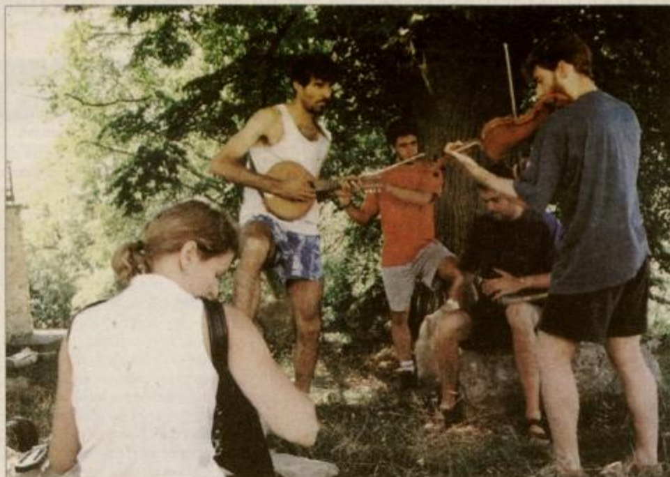
Pri muziciranju smo konec julija zmotili udeležence tradicionalnega glasbenega tabora.

Šola, ki je v zelo slabem stanju, trenutno ne omogoča izvedbe obširnejših ali ambicioznejših programov, meni