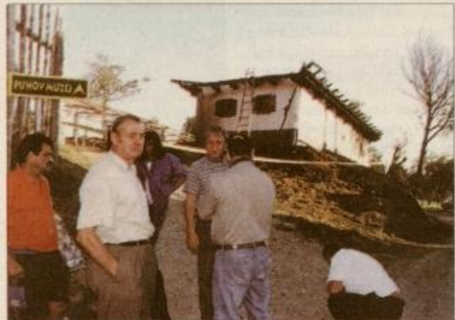
Zgroženi domačini iz Sakušaka nemo zro na pogoreli ponos svojega kraja in občine Juršinci