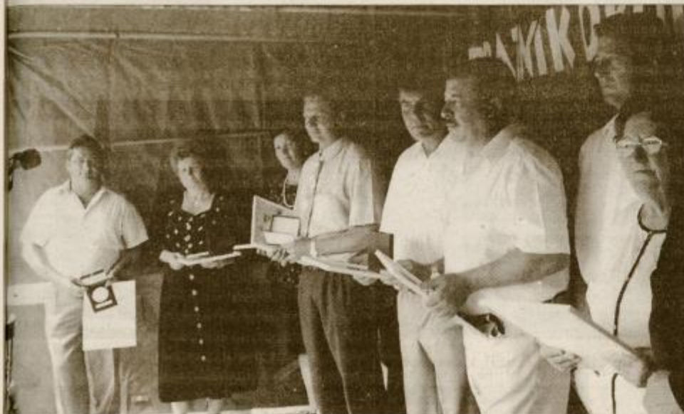
Dobitniki letošnjih priznanj in plaketa

DORNAVA / LÜKARI PRIPRAVLJENI NA OSREDNJO PRIREDITEV