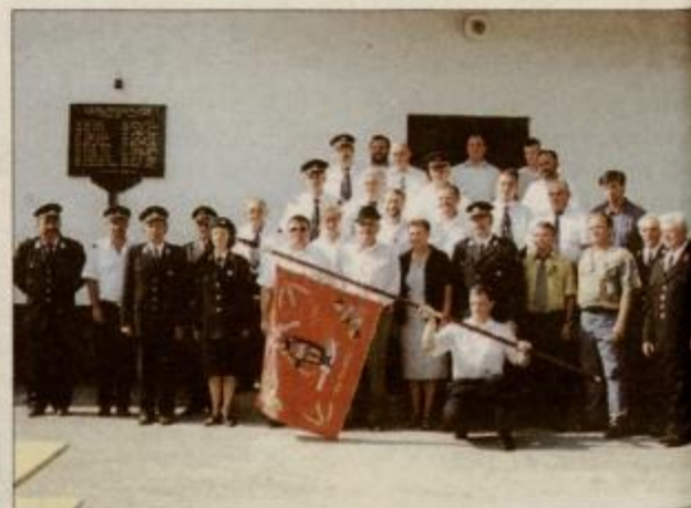
Botri z novim praporjem GD Podvinci, ki je usklajen z državnimi simboli.