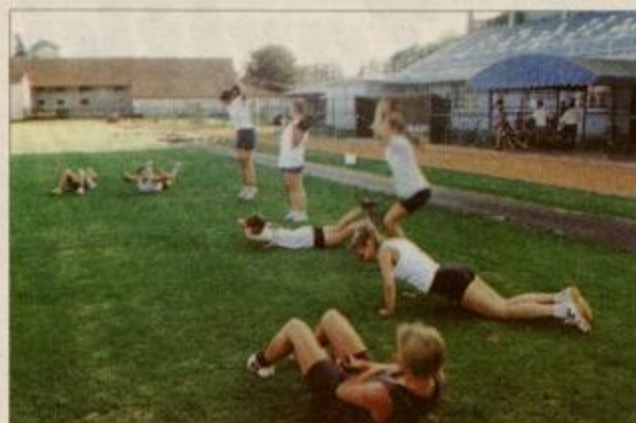
Dekleta ŽOK Elektrollogistika delajo zelo zavzeto