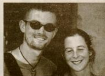
Dorothy in Jan iz Švice