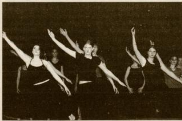
Utrinek s predstave plesne družine Gea DPD Svoboda Ptuj na medobmočnem srečanju Plesni navdihi letos maja v Ptujju

Tako bodo že septembra 2000 dali v uporabo vsem, ki bi na kakršen koli način želeli izražati svoje umetniške navdihe, staro steklarsko delavnico. Zaposlili bodo tudi človeka preko javnih del, ki bo skrbel za pomoč in organizacijo ter izvajanje projektov v delavnicah, na primer