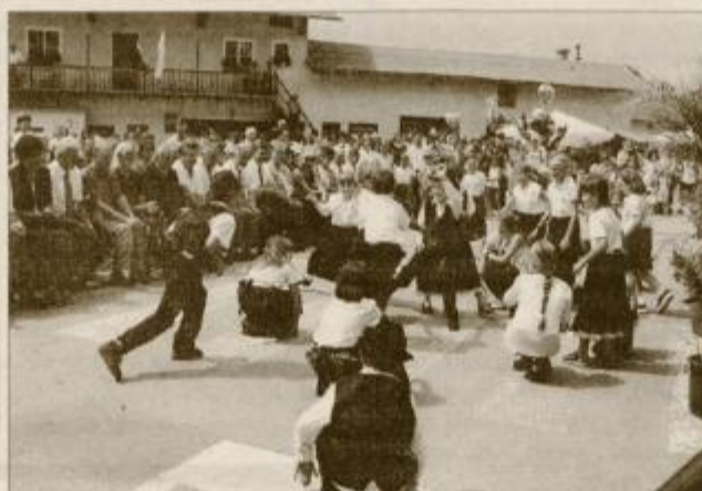
Utrinek iz kulturnega programa: otroška folklorna skupina Trta