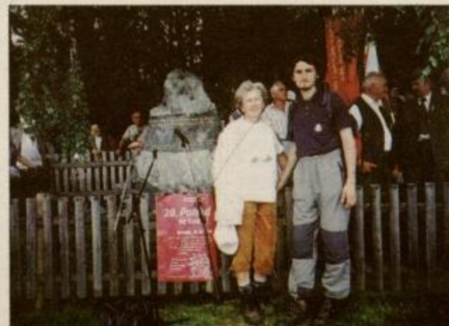
Na zaključku pohoda pri spomeniku Domnovi četi na Komelji