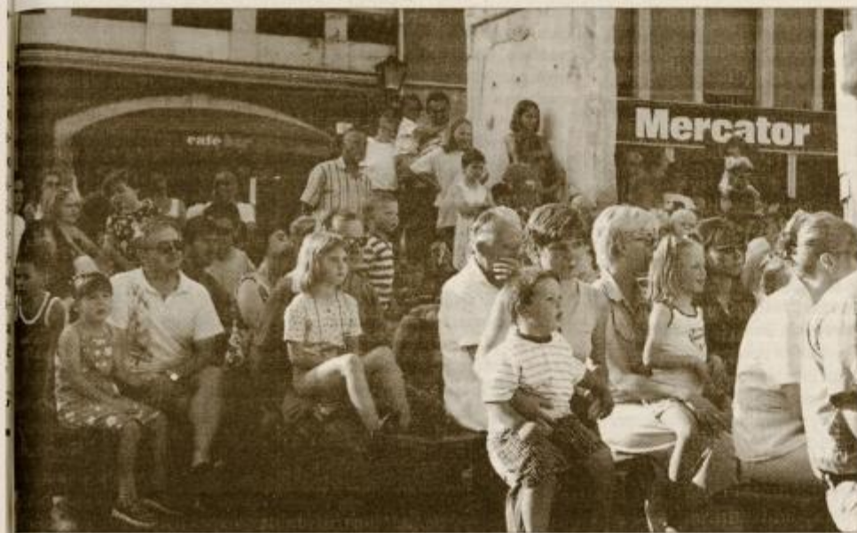
Lutkovne predstave so pri mladih Ptujčanih nadvse priljubljene