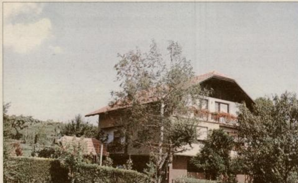
Za najlepše urejeno je komisija ocenila stanovanjsko hišo Lenke Krajnc iz Zgornjega Leskovca.