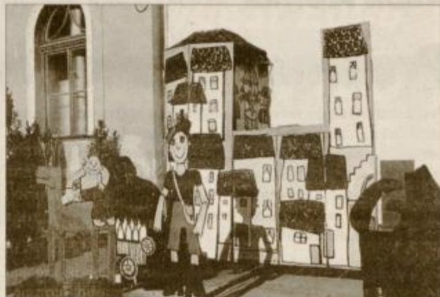
Utrinek z Vajenca Hlapiča

Poletni lutkovni pristan se je v soboto, 8. julija, zaključil s Sneguljčico, ki jo je izvajalo Družinsko gledališče Kolenc iz Vavč. V igri so spet otroci, tri sestrice, ki so se šle igrat na podstrešje, saj jih je mama okarala, ker so se popackale. Tam so našle babičino skrinjo z obleko, ki je točno takšna, kot jo ima Sneguljčica, potrebovale so še mačeho in igra se je lahko pričela. Prav vse se je zgodilo tako kot v pravljici. Mačeha je za Sneguljčico zvarila jabolko, palčki so verjeli, da jo lahko reši nekdo, ki jo ima resnično rad, in lepi princ res pride. Tri sestrice pa počasi začnejo zaupati v besede enega od palčkov, da se ti v življenju ne more zgoditi