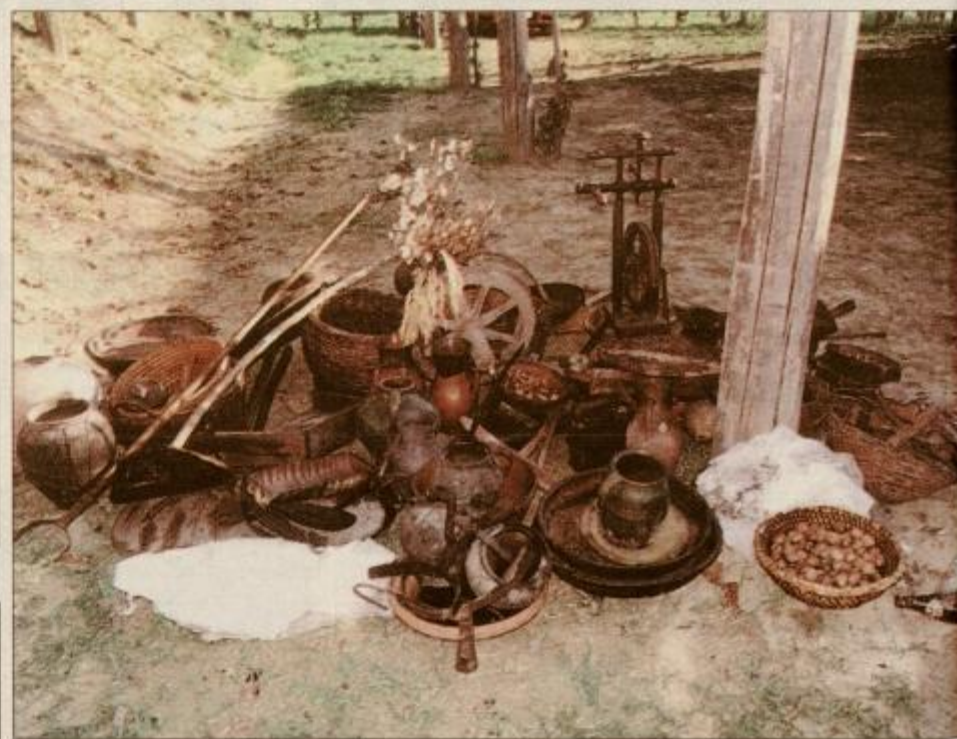
To je vse iz Puhovega muzeja, kar je uspelo rešiti domačinom in gasilcem iz objema zubljev