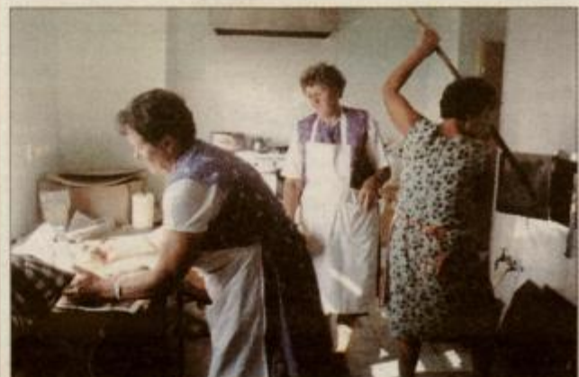
Uspešne so bile v pripravi gibanic tudi članice destrniškega turističnega društva