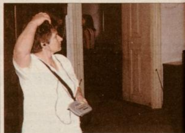
Z zgoščenko je sprehod po gradu za turista veliko bolj samostojen.

V avgustu je uporaba prenosne aparature skupaj s torbico brezplačna. Dobite jo na muzejski blagajni, si jo pritrpite okrog pasu in se svobodno sprehodite po muzejskih zbirkah. Ta mesec se lahko s slušalkami sprehajate zastoj, kasneje pa bo za to, še ob vstopnici, ki stane 600 tolarjev, potrebno doplačati sto tolarjev. Zaenkrat lahko to ugodnost izrabijo samo slovensko govoreči turisti, v septembru pa naj bi začeli uvajati zgoščenko z angleškim, nemškim in itali-