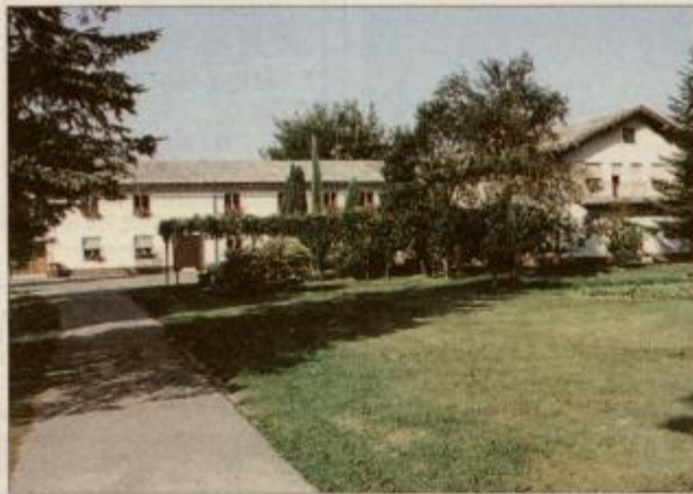
Lepo urejeno župnišče v Vidmu pri Ptuj

Pestro dogajanje na vročem nedeljskem soncu je na peti kmečki praznik pred gasilski dom v Leskovcu v nedeljo privabilo številne domačine in obiskovalce od drugod. Prireditev so začeli s prikazom domačih obrti v Halo-zah, otvoritvijo kulinarične razstave, nadaljevali s kmečkimi igrami in kulturnim programom ter zaključili z razglasitvijo rezultatov. Kmečke igre so bile letos že petič, četrtič v organizaciji domačega turističnega društva Klopotec.