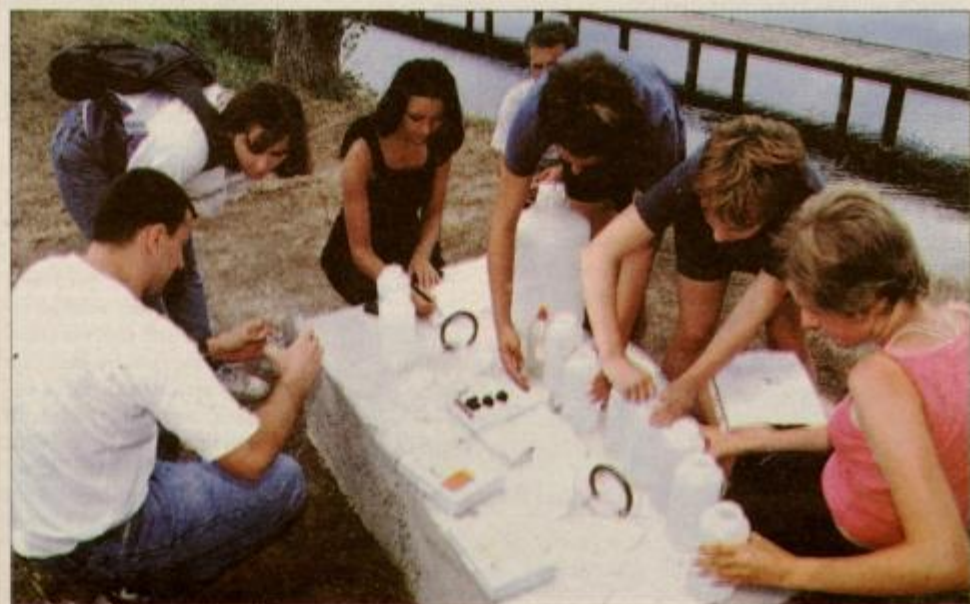
Udeleženci tabora med delom.