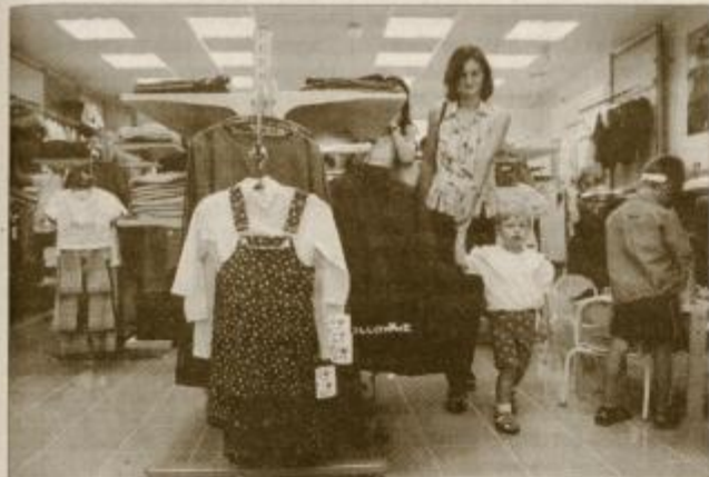
Ciciban so obnovili in povečali.