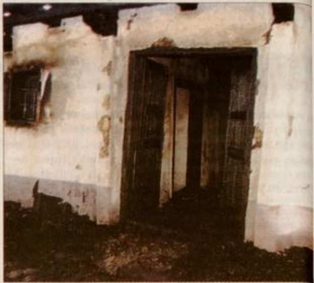
Žal ta vrata ne bodo vodila v Puhov muzej

vedeli le še to, da je materialna škoda ocenjena na več kot 10 milijonov tolarjev, moralna in kulturna škoda pa je veliko višja. Domačini so potrli, a trdo upajo, da bodo domnevnega storilca ali vzrok požara kmalu ugotovili. Kakorkoli že, na tem pogorišču naj bi prej kot v letu dni stala nova cimprača, nov Puhov muzej, ki bo zagotovo več kot ponos tega kraja in občine.