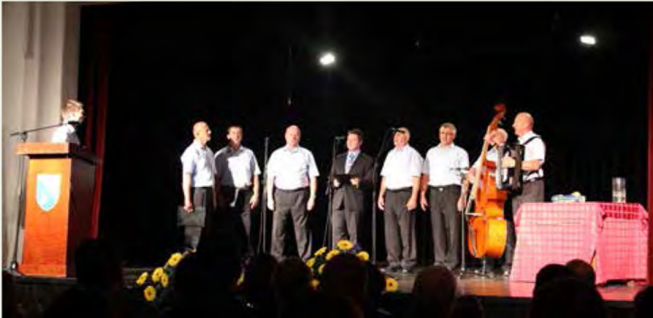
Slavnostno sejo je popestril oktet Belmura

V četrtek, 14. avgusta 2014, je v okviru praznovanja 18. občinskega praznika Občine Beltinci v Kulturnem domu v Beltincih potekala slavnostna seja Občinskega sveta.