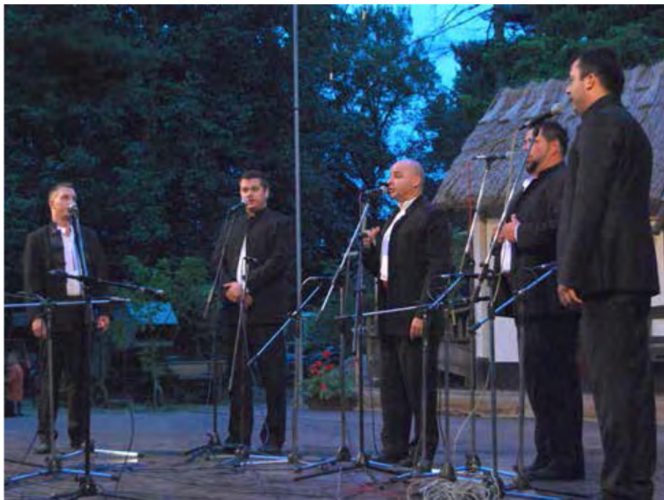
Prvič smo na folklornem festivalu slišali tudi čisto pravo klapsko petje

Konec julija je v Beltincih tradicionalno zaznamovan s folklornim festivalom. Tokrat se je na prireditvenem prostoru v zavetju krošenj mogočnih dreves beltinskega parka zbralo okoli 300 plesalcev, godcev in pevcev. Poleg njih so tisti, ki jim je mar, predstavljali ljudske običaje posameznih krajevnih skupnosti domače občine, predvsem pa se je na njem ponovno zbrala množica tistih, ki imajo to radi.