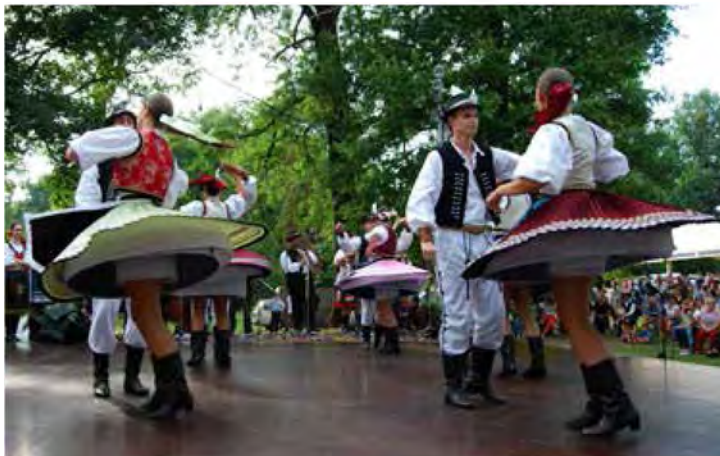
Nastop slovaške skupine v čudovitem ambientu beltinškega parka. Tokrat res zadnjič?!