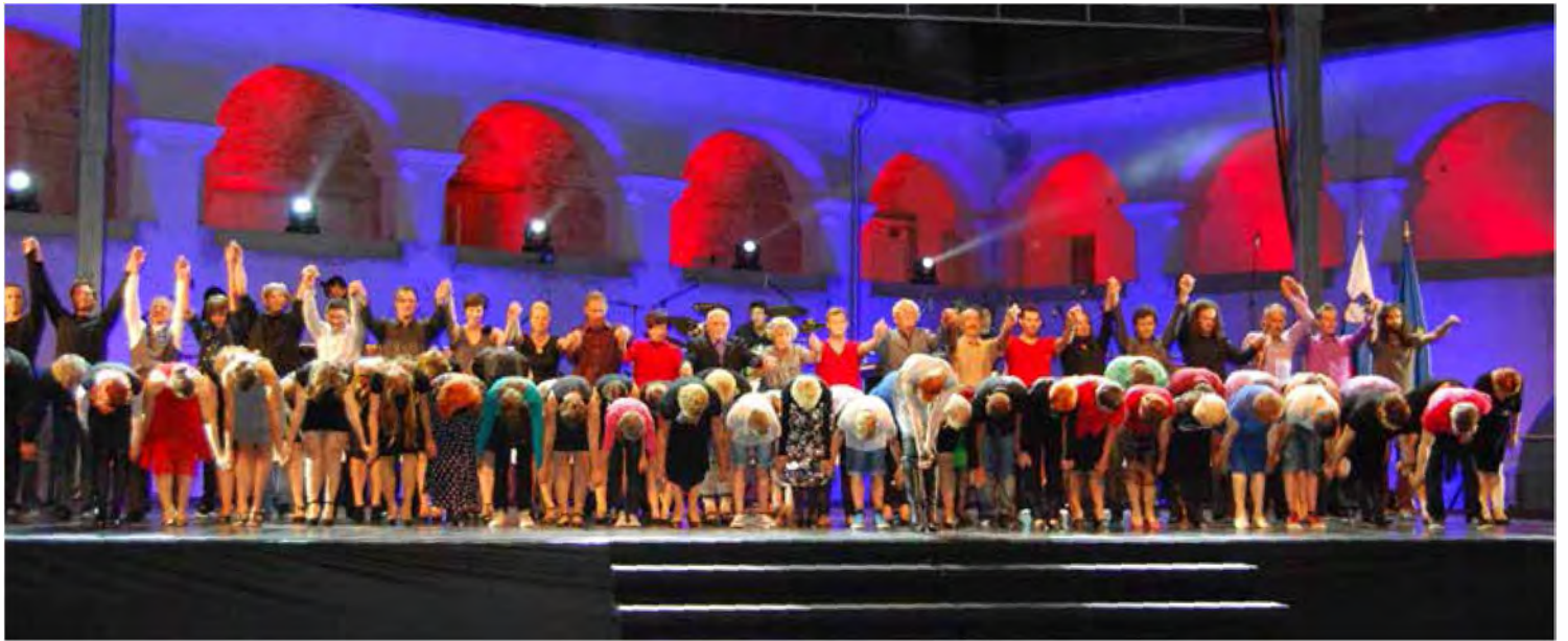
Umetniški program »Danes Prekmurje!« je potekal v duhu medgeneracijskega sodelovanja