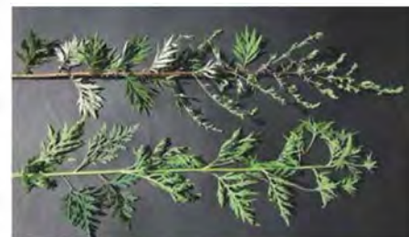
Primerjava pelina (zgoraj) in pelinolistne ambrozije (spodaj)

Največ zamenjav ambrozije je z navadnim pelinom ( Artemisia vulgaris ) zaradi podobne strukture listov, čeprav je spodnja stran listov pri pelinu bolj sivkaste barve.