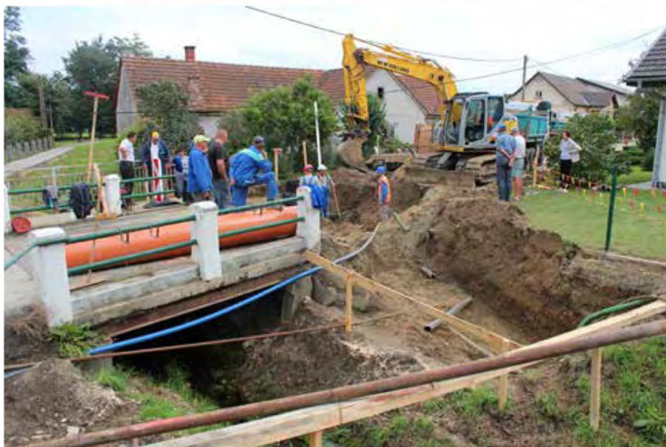
Obnovitvena dela na Gregorčičevi so zelo obsežna in zahtevna

Občina Beltinci je s podpisom pogodbe s podjetjem SGP POMGRAD d.d., ki je bil izbran na javnem razpisu, pričela z izvajanjem projekta Rekonstrukcije Gregorčičeve ulice v Beltincih ter z odstranitvijo obstoječega objekta in novogradnjo mostu čez potok Črnec na istoimenski ulici. Dela, ki so se z