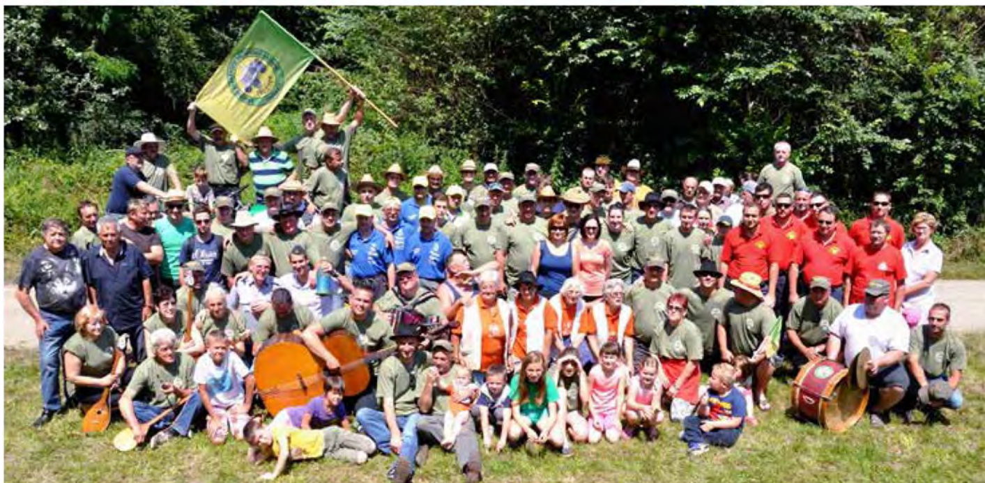
Skupinska fotografija udeležencev 3. rallya v razširjeni postavi

V soboto, 28. 6. 2014 je potekal 3. rally »Pufkačev«. Kot je že skorajda tradicija, smo se »Pufkači« na dan rallyja zbrali pred domom krajanov v Ižakovcih. Po kavi in domačih fankah, ki so jih pripravile članice skupine Lan, je sledil pozdrav udeležencem in predstavitev proge rallya. Zbralo se je okoli 100 ljubiteljev starodobne tehnike, ki so s seboj pripeljali 35 starejših traktorjev. Pot nas je vodila najprej do Beltinskega gradu, kjer smo opravili prvi načrtovan postanek. Na dvorišču gradu nas je pričakalo TD Beltinci in tamburaška skupi-