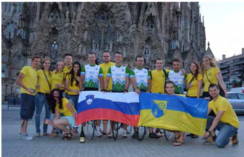
Po 1428 kilometrih je bilo veselje nepopisno