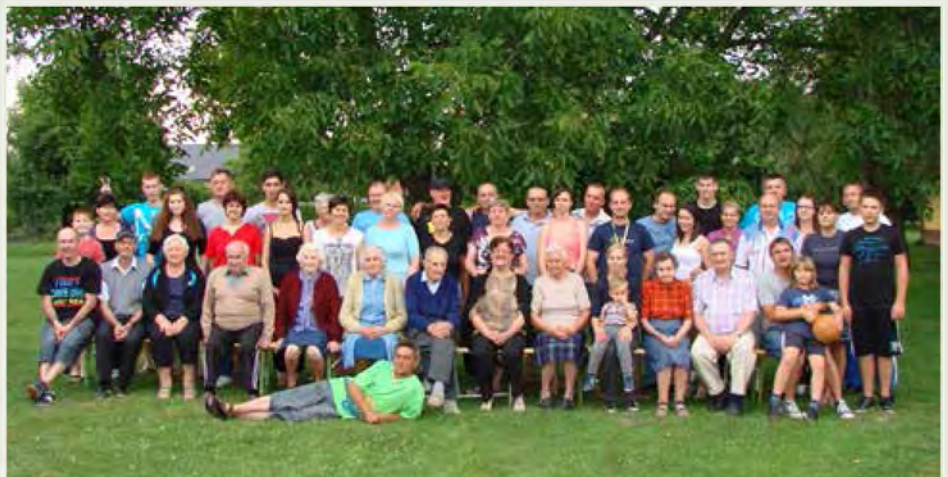
Skupinska slika udeležencev 3. uličnega piknika ob Črncu