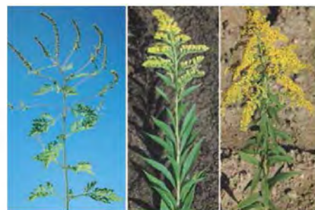
Primerjava rastlin v cvetenju: pelinolistna ambrozija (levo) z orjaško zlato rogozo (v sredini) in kanadsko zlato rogozo (desno)