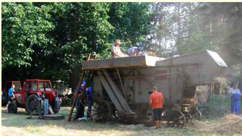
»Mašin« je bil prava paša za oči številnih obiskovalcev sobotnega dogajanja

Nato smo se podali na žetev domače pšenice na njive pri Ižakovcih, kjer smo poželi še dodatnih osem križev, tako da je je bilo za cel voz.