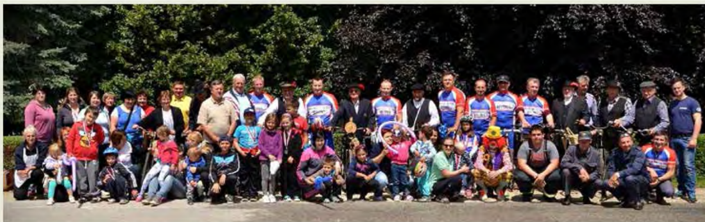
Skupinska slika udeležencev Minikronometra 2014