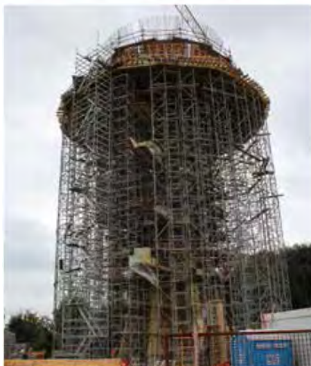
Vodovodni stolp raste

V Občini Beltinci še naprej poteka gradnja vodovodnega omrežja v sklopu projekta »Pomurski vodovod – sistem B«. Skupna gradnja transportnih cevovodov in objektov (vodovod in vodohram Beltinci) že presega 85 odstotkov, zaključena je gradnja primarnih cevovodov, krepko čez polovico pa je tudi že gradnja sekundarnih vodovodov. V prihodnjih mesecih se bodo izvedla še manjkajoča asfaltna dela na določenih odsekih, kjer le-ta še manjkajo. V naselju