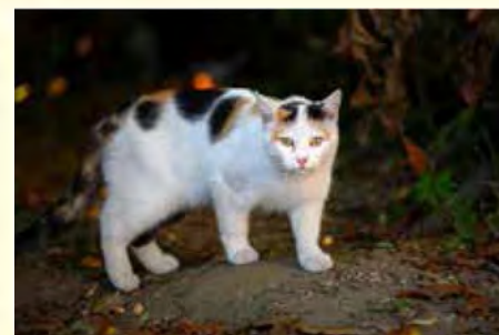
Bodimo pozorni na živali ob cesti