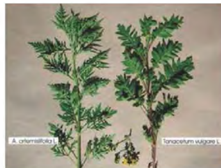
Primerjava pelinolistne ambrozije (levo) in navadnega vratiča (desno)