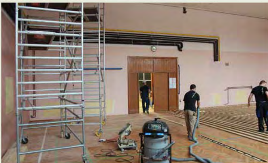
Posodobitvena dela v mali telovadnici so v polnem teku

Konceptualizacija temelji na dveh izhodiščih in sicer: na eni strani imamo obstoječ prostor z danimi gabariti in spremljajočimi prostori, na drugi strani pa potencialne uporabnike, ki jih je smiselno vezati na takšen objekt in prostor. V presečišču teh dveh izhodišč pa se nahaja športna tehnologija. Takšna konceptualizacija nam omogoča izvajanje opredeljenih programov za izbrane potencialne uporabnike, kar predstavlja drugačen algoritem opremljanja športnih objektov in površin, ki nekako izhaja iz standardizacijskega pristopa, kjer se šele po izgradnji začnemo dejansko ukvarjati s potencialnimi uporabniki in programi. Torej po našem iMOTUS Fusion Conceptu (nadalje: iFC) gre za zlitje različnih interesov, pristopov, tehnologij, programov, uporabnikov, itd. v eno najustreznejšo rešitev, ki je sinergijski rezultat optimalnih rešitev na posameznih področjih.